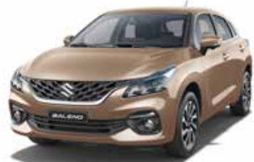
بيج لؤلؤي ميتاليك Beige Pearl Metallic (WBJ)