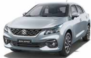
فضي لؤلؤي ميتاليك Silver Pearl Metallic (WBE)