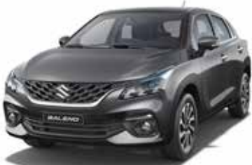
رمادي لؤلؤي ميتاليك Grey Pearl Metallic (WBF)