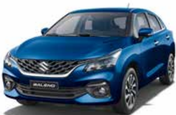
أزرق لؤلؤي ميتاليك Blue Pearl Metallic (WBH)