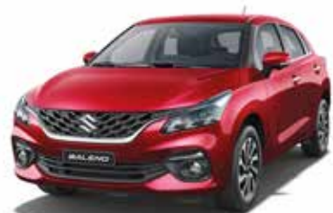
أحمر لؤلؤي ميتاليك Red Pearl Metallic (WBG)