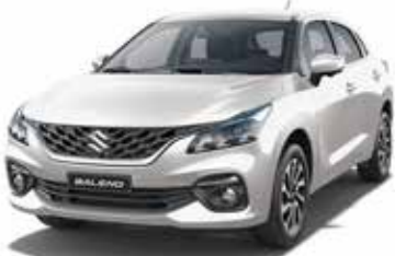
أبيض لؤلؤي Arctic White Pearl (ZHJ)