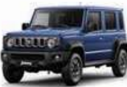
أزرق Blue Pearl Metallic (WBH)