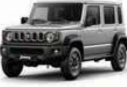
فضي Silky Silver Metallic (Z2S)