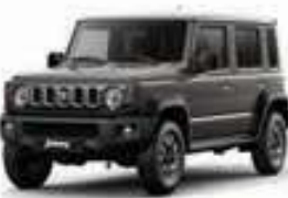
رمادي Granite Gray Metallic (ZTN)