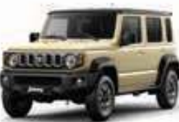
بيج/أسود Ivory Metallic + Black Pearl (E5J)