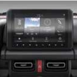
نظام عرض الصوت Display Audio