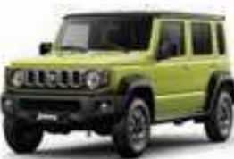
أصفر/أسود Kinetic Yellow + Black Pearl (E5H)