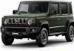
أخضر Jungle Green (WA7)