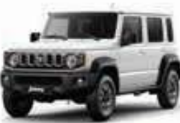
أبيض Arctic White Pearl (ZJH)