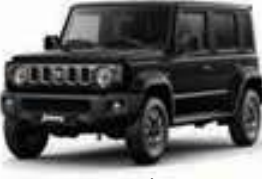
أسود Blush Black Pearl (WB3)