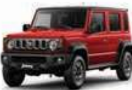
أحمر/أسود Red Metallic + Black Pearl (E5R)