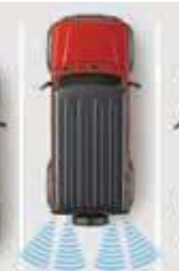
مجسات وقوف خلفية Rear Parking Sensors