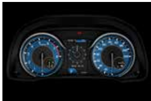
Stylish Meter Cluster