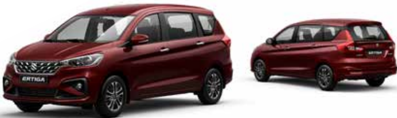
أحمر ميتاليك Auburn Red Pearl Metallic (ZYY)