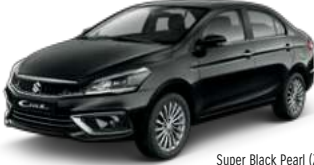
Super Black Pearl (ZTT)