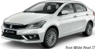
Pure White Pearl (ZYG)

*: The result will be changed based on customer usage. **: Specification may be changed without prior notice.