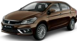
Dignity Brown Pearl Metallic (ZQU)