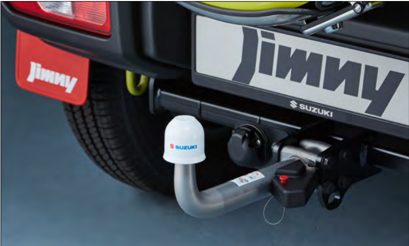
Anhängerkupplung 1, 2 72901-78R00-000