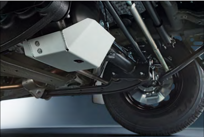
Differenzialschutz vorn 1 Art.-Nr. 9912J-78R31-000