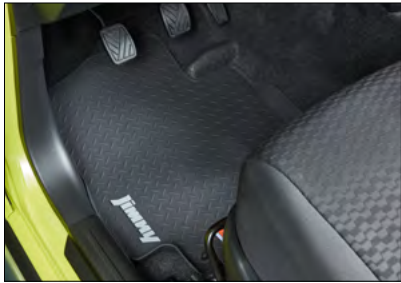
Fußmatten-Set Gummi Art.-Nr. 75901-78R71-000