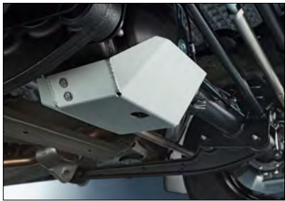
Differenzialschutz vorn 1 Art.-Nr. 9912J-78R31-000