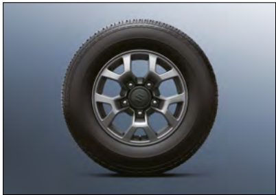
Alufelge 15 3,4 Art.-Nr. 43210-78R01-0BK