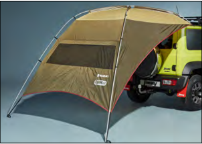
Schutzzelt 1 Art.-Nr. 99243-78R01-000