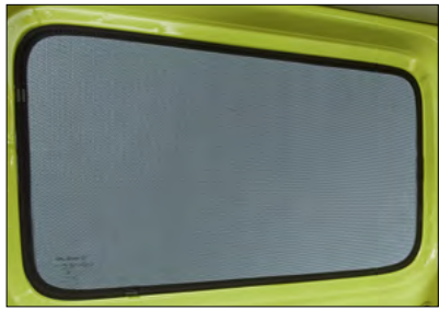
Sonnenblenden-Set 1 Art.-Nr. 990E0-78R20-000