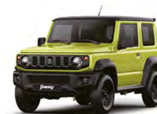
Kinetic Yellow/ Bluish Black Pearl Metallic

Gut möglich, dass Sie schon aus beruflichen Gründen gedecktere Farbtöne bevorzugen. Der Jimny bietet Ihnen dafür eine breite Auswahl. 2 der 6 Lackierungen sind außerdem mit schwarz abgesetztem Dach zu haben. Mit Kinetic Yellow zum Beispiel gibt das Ihrem Fahrzeug eine sehr expressive Note. An dieser Stelle lässt der Jimny mal alle „Nutzfahrzeug“-Vernunft phantasievoll hinter sich. Warum auch nicht.