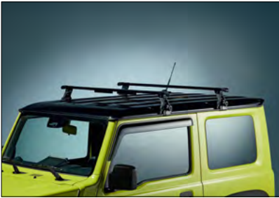
Grundträger 4 Art.-Nr. 78901-78R10-000