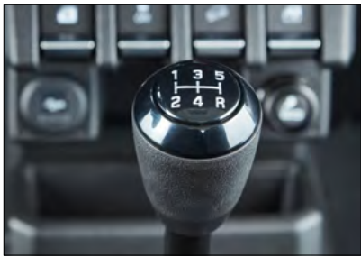
Schaltknauf Art.-Nr. 28113-77R20-000