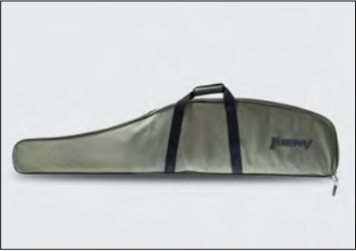
Gewehrtaische 3 Art.-Nr. 990F0-JYGBG-000