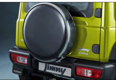
Reserveradabdeckung mit Platte 1,3 Art.-Nr. 990E0-78R13-000