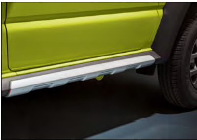
Seitenschweller 1 Art.-Nr. 99112-78R10-000