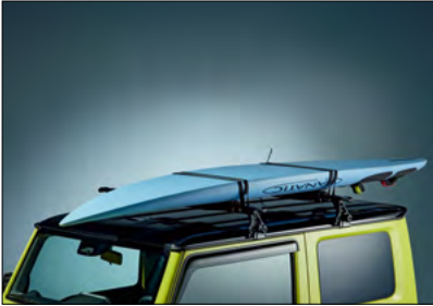
Surfbrettmodul 4, 5 Art.-Nr. 99179-78R00-000