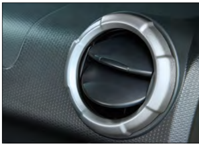
Lüftungsdüsen-Dekor-Set Art.-Nr. 99233-78R00-QMC