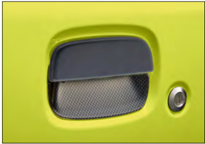
Türgriffschalen-Set Art.-Nr. 99126-78R00-000