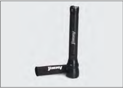
LED-Taschenlampe 2 Art.-Nr. 990F0-JYLED-000