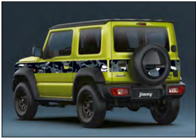
Dekor »Camouflage« 2 Art.-Nr. 990E0-78R92-GRY