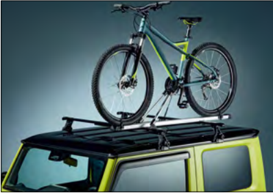
Fahrradmodul 4, 5 Art.-Nr. 9917B-78R00-000