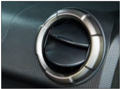
Lüftungsdüsen-Dekor-Set Art.-Nr. 99233-78R00-QKJ