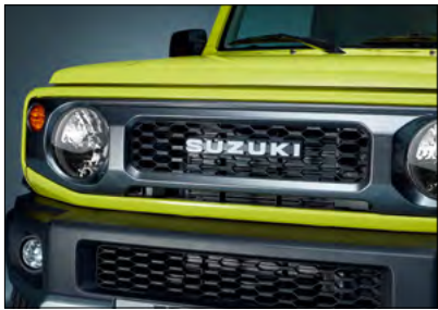
Frontgrill 1 Art.-Nr. 9911C-78R00-ZSC