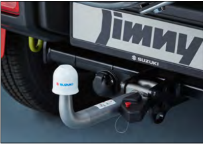
Anhängerkupplung 1, 2 Art.-Nr. 72901-78R00-000 E-Satz, 13-polig 3 , Art.-Nr. 990E0-78R65-000 E-Satz, 7-polig 3 , Art.-Nr. 990E0-78R64-000