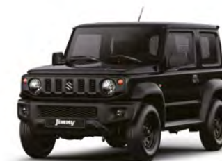
Bluish Black Pearl Metallic