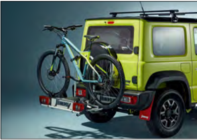
Fahrradheckträger 1, 3 Art.-Nr. 990E0-59J22-000