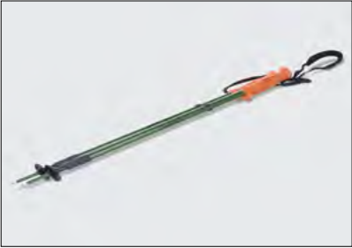
Trekking-Stöcke 5 Art.-Nr. 990F0-JYTST-000