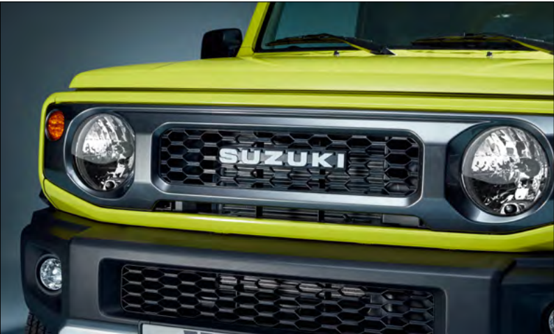
Frontgrill 1 Art.-Nr. 9911C-78R00-ZSC