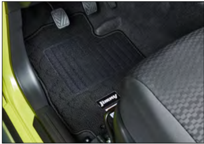
Fußmatten-Set »DLX« Art.-Nr. 75907-77R80-000