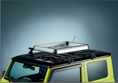
Dachkorb 4, 5 Art.-Nr. 99177-78R00-000