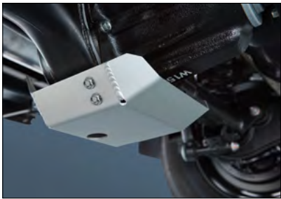
Differenzialschutz hinten 1 Art.-Nr. 9912J-78R41-000