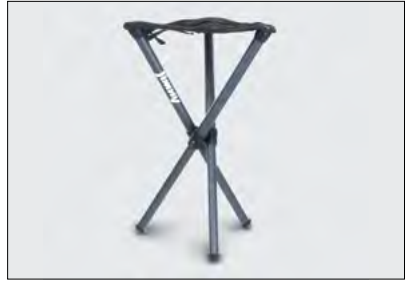
3-Bein-Hocker 4 Art.-Nr. 990F0-JYWAK-000