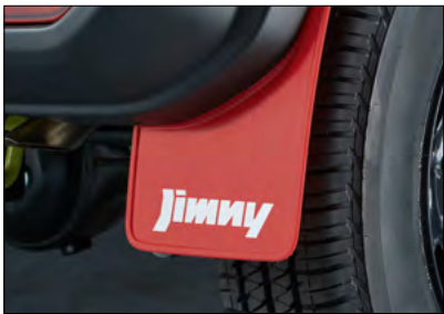
Schmutzfänger-Set 1 Art.-Nr. 99118-78R10-RD1 (hinten) Art.-Nr. 99118-78R00-RD1 (vorne)