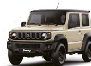
Chiffon Ivory Metallic/ Bluish Black Pearl Metallic