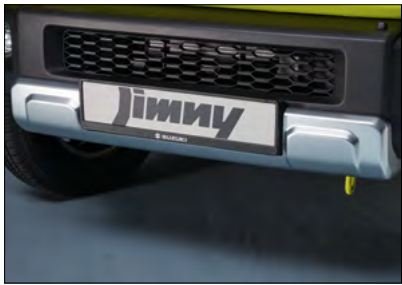
Unterfahrschutz 1 Art.-Nr. 99115-78R10-000