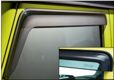
Windabweiser-Set Art.-Nr. 99120-78R11-000