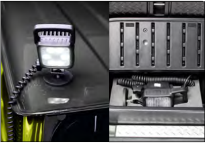
LED-Arbeitsleuchte Art.-Nr. 990E0-78R46-000