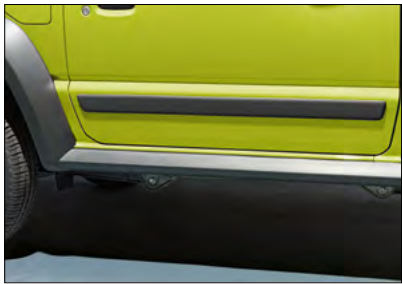
Seitenschutzleisten-Set Art.-Nr. 990E0-78R07-000