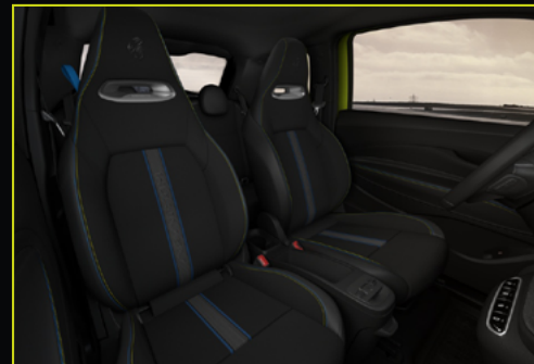
869 / 872 Tissu en technoprène avec logo Scorpion brodé