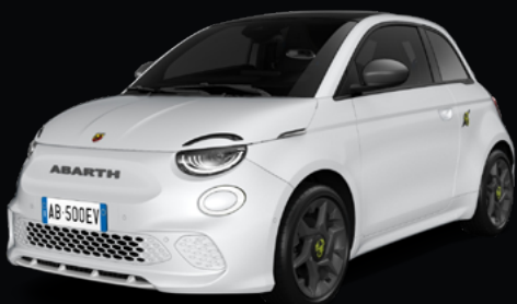
NOUVELLE ABARTH 500e PACK