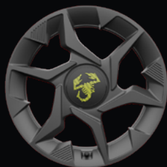
OR2 JANTES ALLIAGE 17"