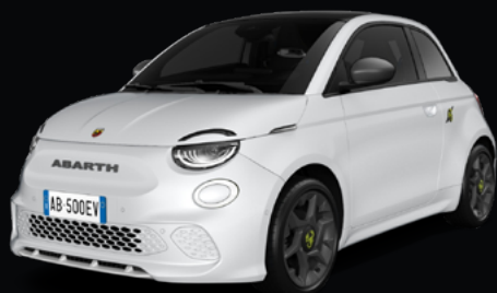
268 BLANC ANTIDOTE* 850 €