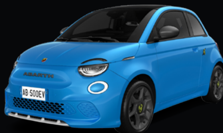
877 BLEU POISON* 850 €