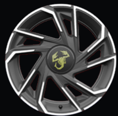
OR4 JANTES ALLIAGE 18" GRIS TITANE DIAMANTÉES