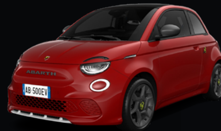
111 ROUGE ADRÉNALINE* 850 €