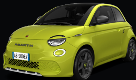
878 VERT ACIDE Gratuit