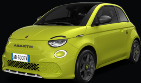
NOUVELLE ABARTH 500e