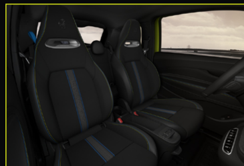
869 / 872 Tissu en technoprène avec logo Scorpion brodé