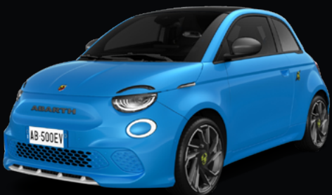
NOUVELLE ABARTH 500e TURISMO