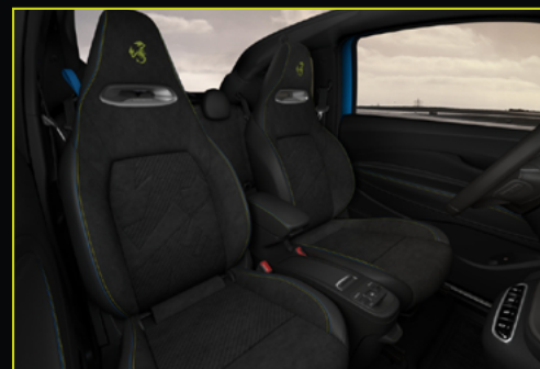
804 / 805 Sport Cuir et Alcantara®