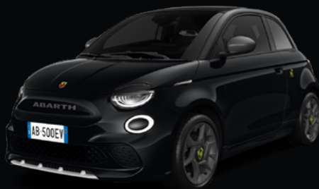
601 NOIR VENOM* 850 €