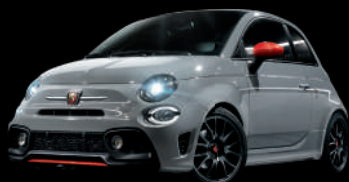
676 Grigio Campovolo (グレー) +レッドアクセント