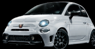
268 Bianco Gara (ホワイト)