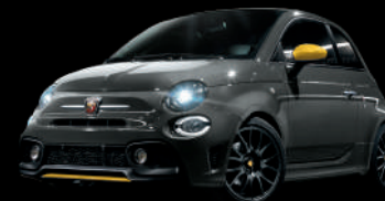
695 Grigio Record (グレー) +イエローアクセント