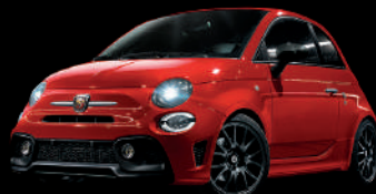
111 Rosso Passione (レッド)