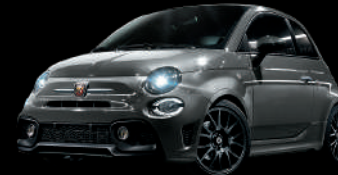
695 Grigio Record (グレー)