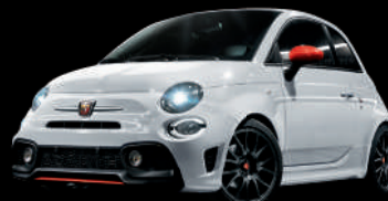
268 Bianco Gara (ホワイト) +レッドアクセント