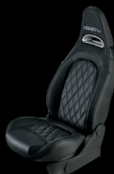
557 ブラック レザー