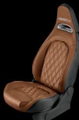
613 / 897 ブラウン レザー