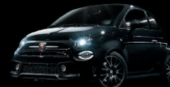
876 Nero Scorpione (ブラック)