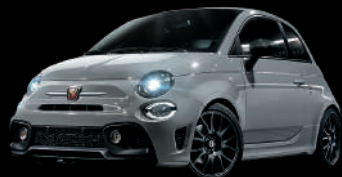
676 Grigio Campovolo (グレー)