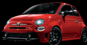
111 Rosso Passione (レッド) +ブラックアクセント