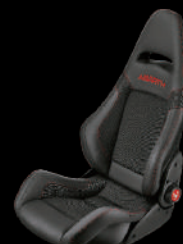
829 ブラック レザー/アルカンターラ (Sabelt)