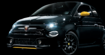
876 Nero Scorpione (ブラック) +イエローアクセント