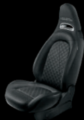
378 ブラック ファブリック