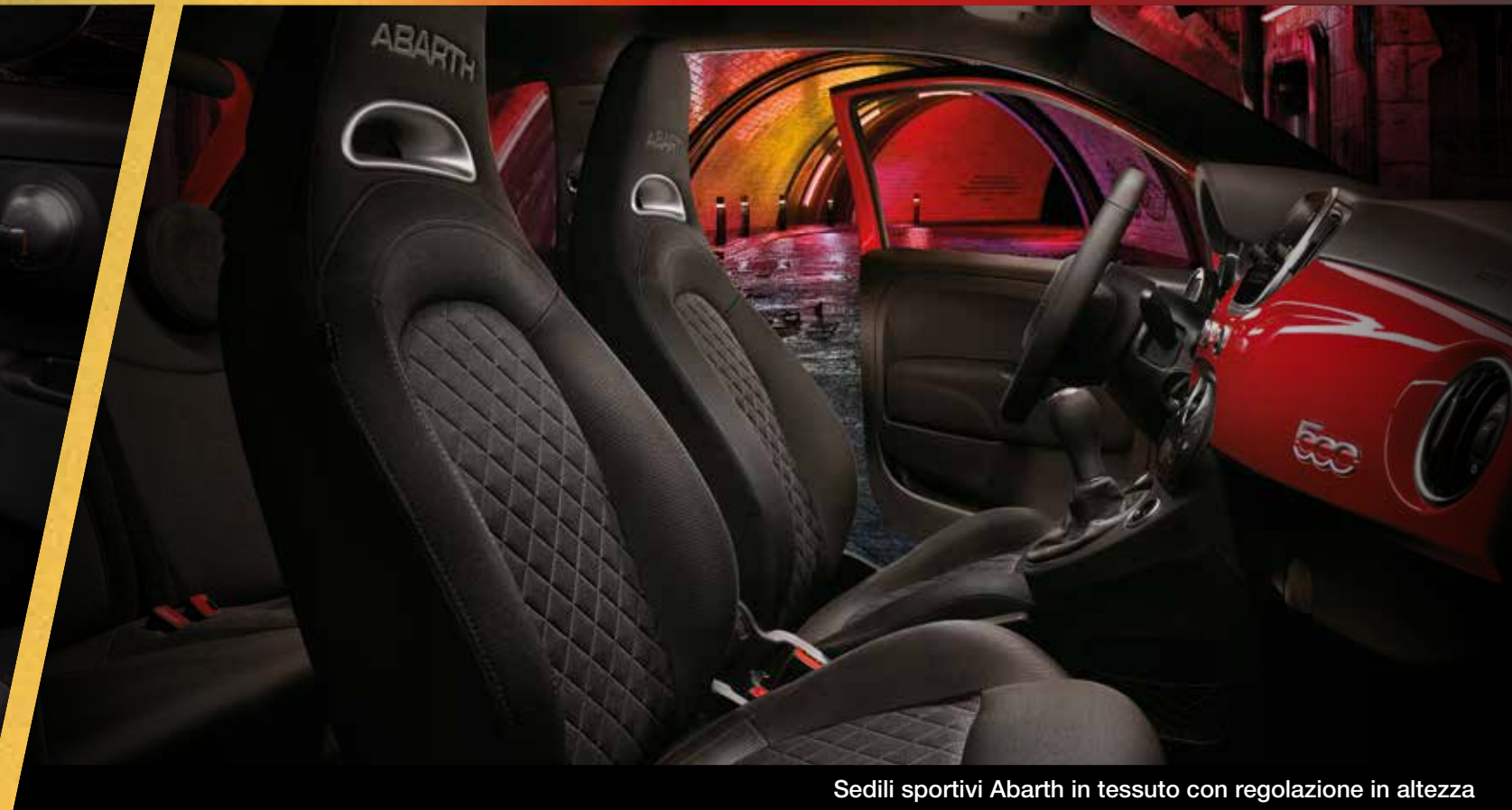
Sedili sportivi Abarth in tessuto con regolazione in altezza