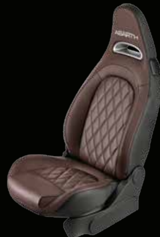
Pelle Helmet Brown (opt su 595, 595 Turismo e 595 Competizione)