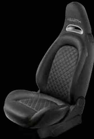
Tessuto nero (di serie su 595)