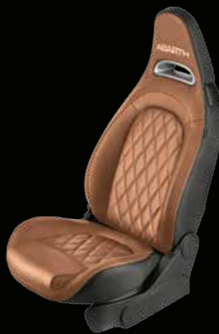
Pelle cuoio (opt su 595, 595 Turismo e 595 Competizione)