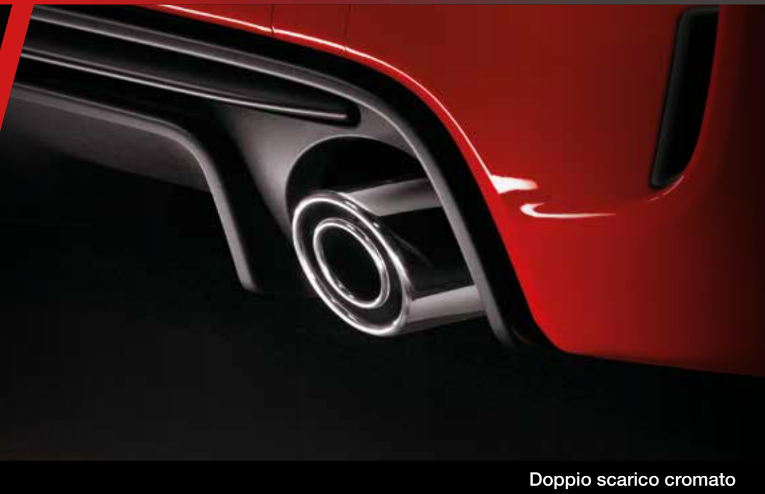
Doppio scarico cromato