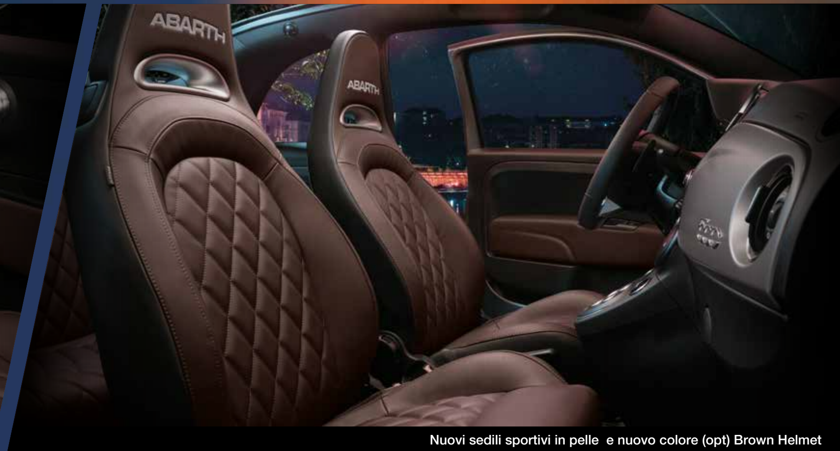
Nuovi sedili sportivi in pelle e nuovo colore (opt) Brown Helmet