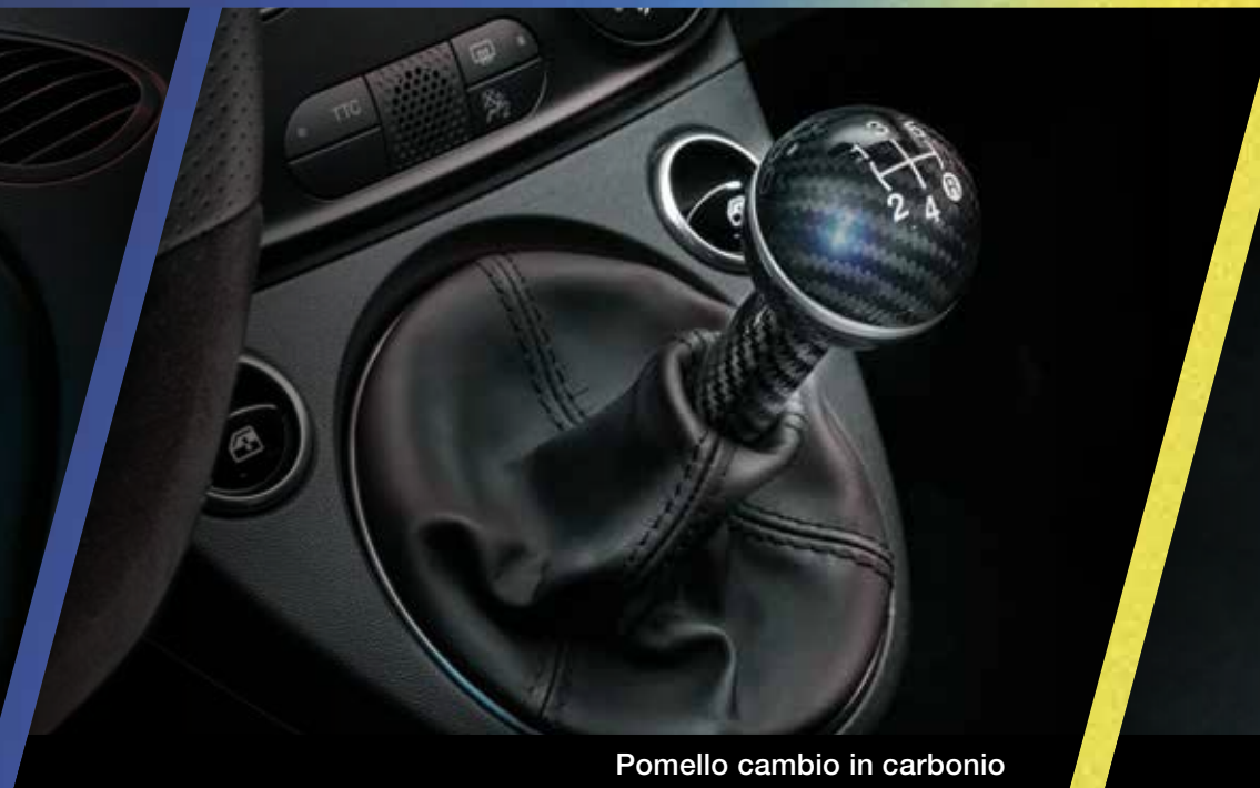
Pomello cambio in carbonio