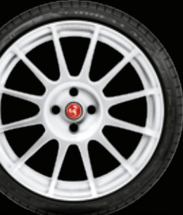
17" SUPERSPORT BIANCO RACING