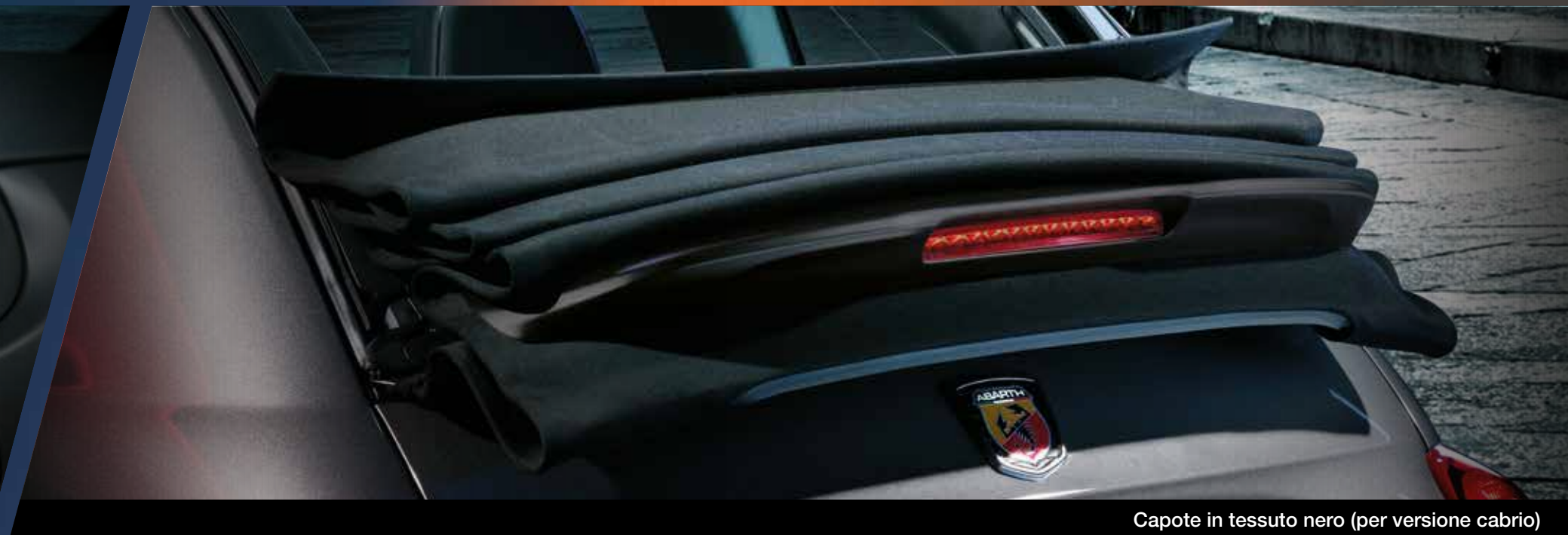
Capote in tessuto nero (per versione cabrio)