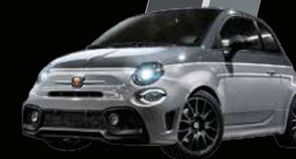
Grigio Pista / Grigio Campovolo