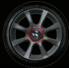
16" 8 RAZZE