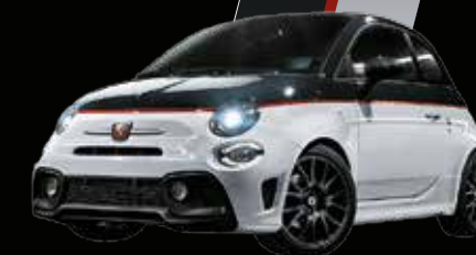
Nero Scorpione / Bianco Gara