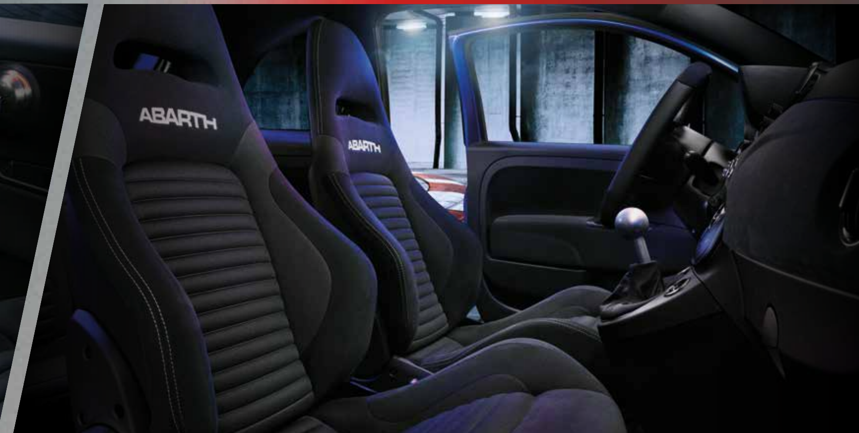
Sedili Sabelt® GT con guscio Tar Cold Grey