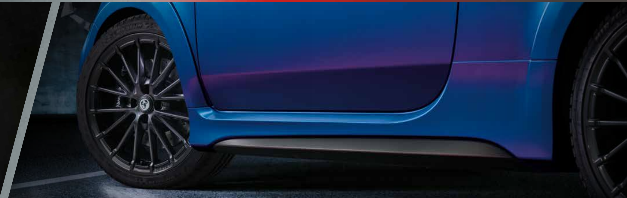
Body kit (opt disponibile solo in abbinamento ai colori Blu Rally e Scorpion Black) e nuovi cerchi Montecarlo da 17"