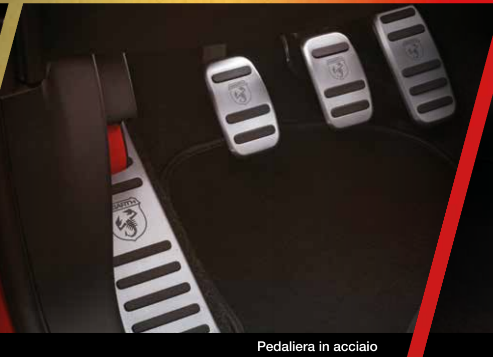
Pedaliera in acciaio