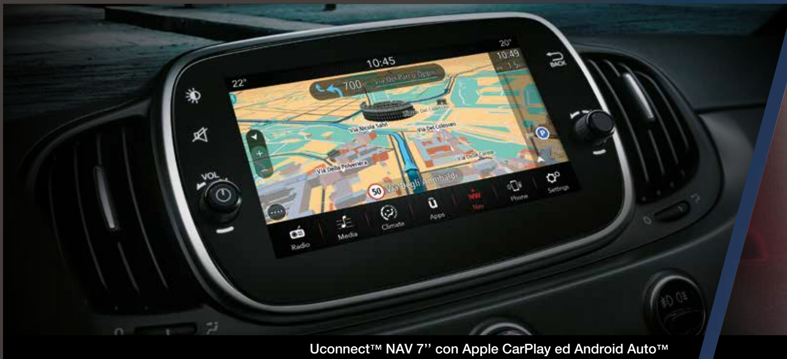
Uconnect™ NAV 7" con Apple CarPlay ed Android Auto™