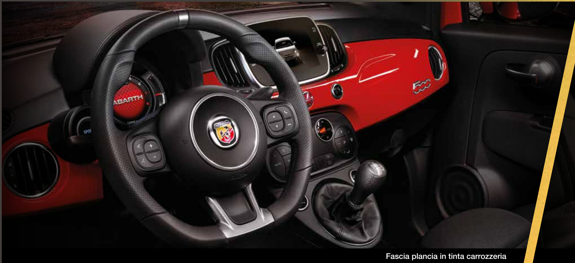
Fascia plancia in tinta carrozzeria