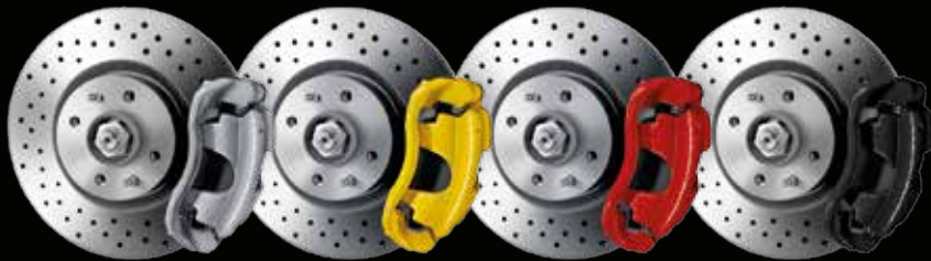
Grigio (di serie su 595 Turismo)