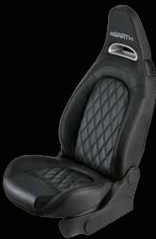
Pelle nera (di serie su 595 Turismo)