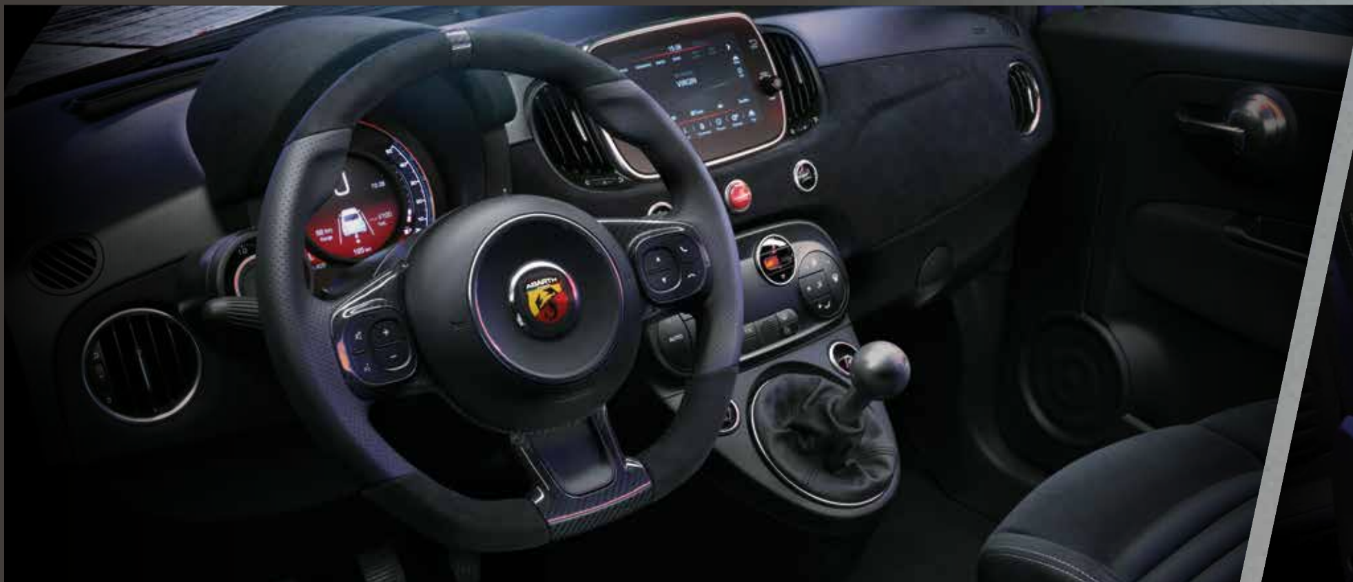
Fascia plancia (opt), volante e cupolotto in Alcantara®