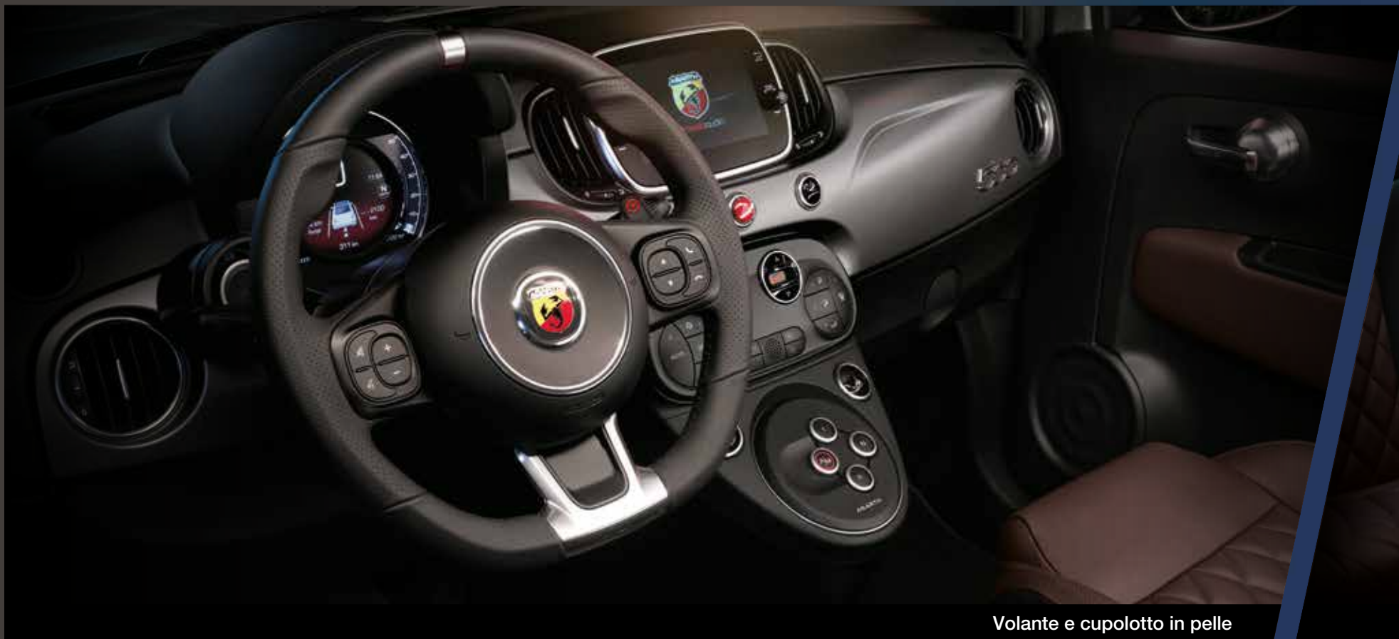
Volante e cupolotto in pelle