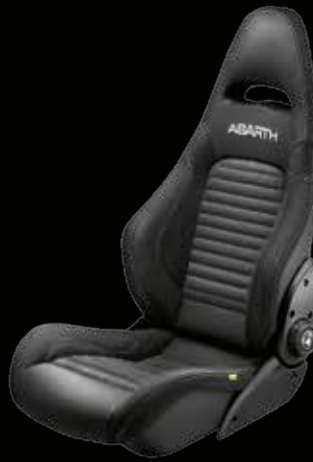
Sabelt® GT pelle nera (opt su 595 Turismo e 595 Competizione)