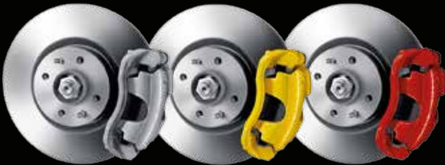
Pinze freno non verniciate (di serie su 595)