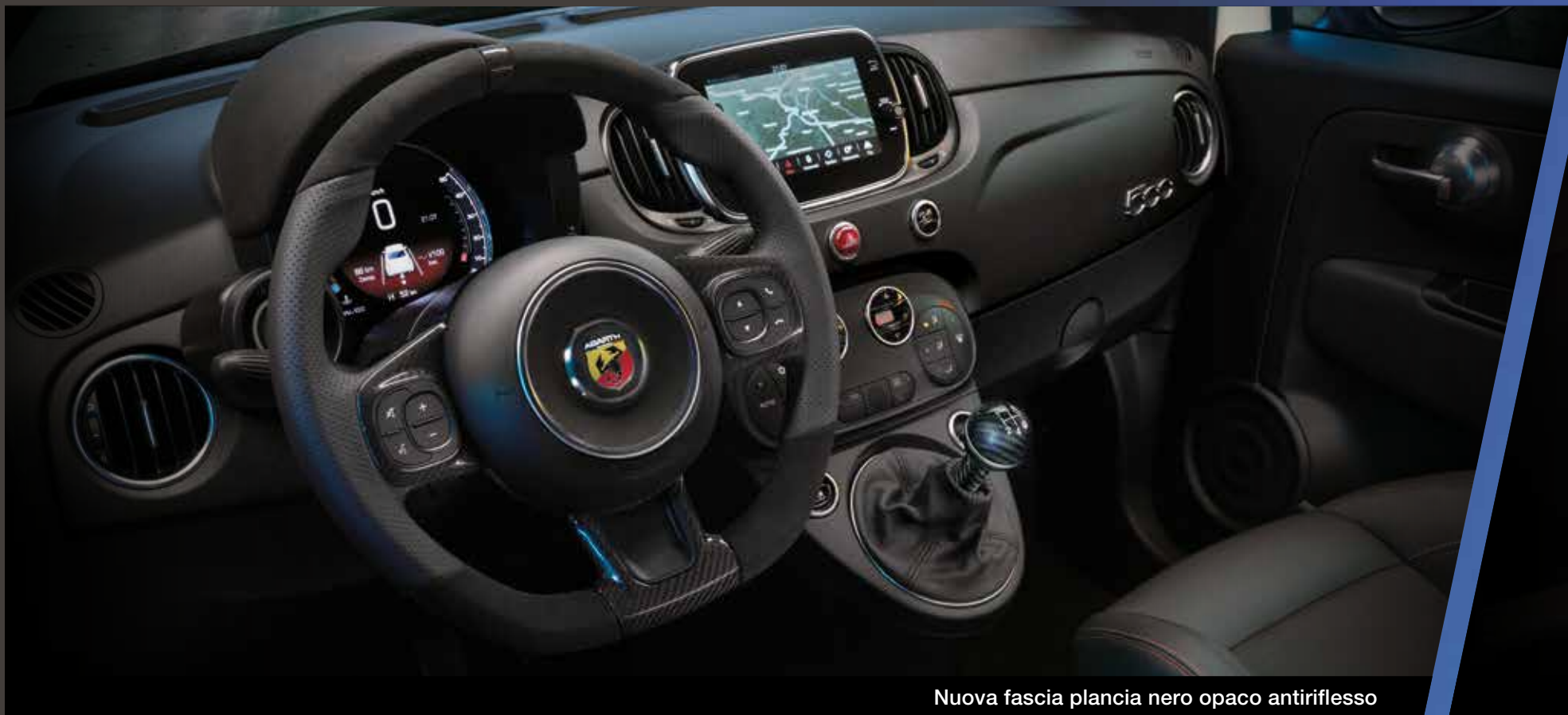
Nuova fascia plancia nero opaco antiriflesso