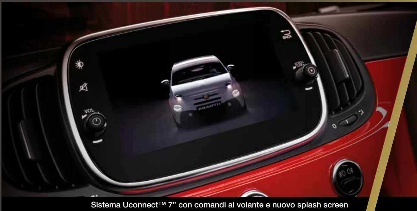
Sistema Uconnect™ 7" con comandi al volante e nuovo splash screen