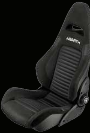
Sabelt® GT tessuto (di serie su 595 Competizione)

Progettato per garantire la tenuta laterale come in gara. Ideale per diventare tutt'uno con la vettura e ottenere il massimo dalla guida sportiva.