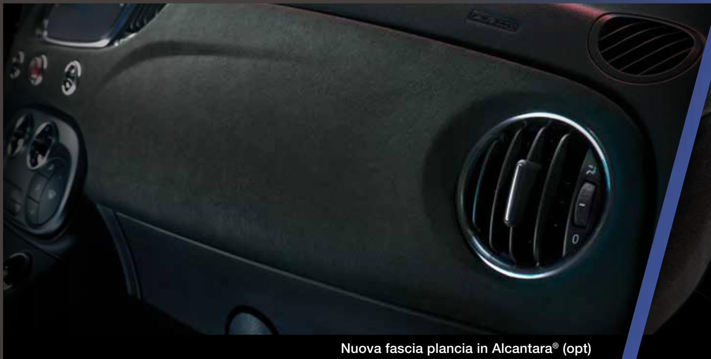
Nuova fascia plancia in Alcantara® (opt)