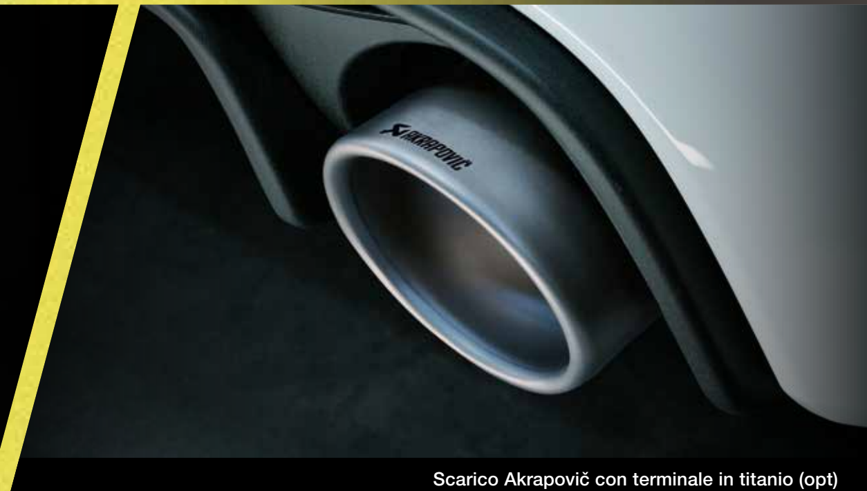
Scarico Akrapovič con terminale in titanio (opt)