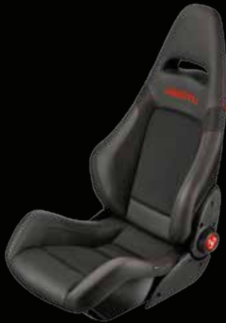
Sabelt® Racing carbonio con guscio in carbonio (di serie su 595 esseesse)

Progettato per garantire la tenuta laterale come in gara. Ideale per diventare tutt'uno con la vettura e ottenere il massimo dalla guida sportiva.