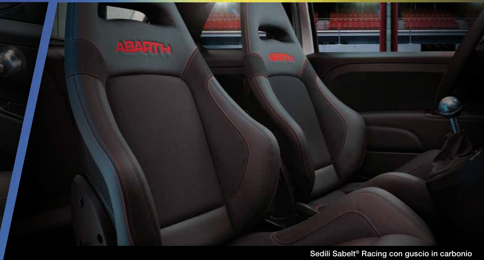
Sedili Sabelt® Racing con guscio in carbonio