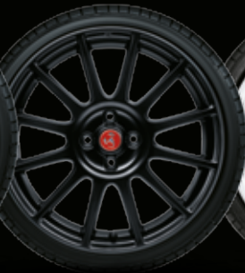
17" SUPERSPORT NERO OPACO