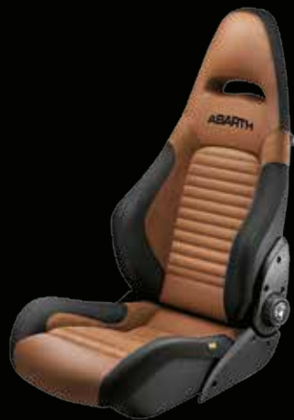
Sabelt® GT pelle tabacco (opt su 595 Turismo e 595 Competizione)

Assicura un'elevata tenuta laterale e un comfort unico, anche nei lunghi viaggi.