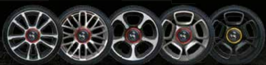
17" TURISMO 17" TOURING 17" TROFEO 17" SPORT 17" SPORT MATT BLACK