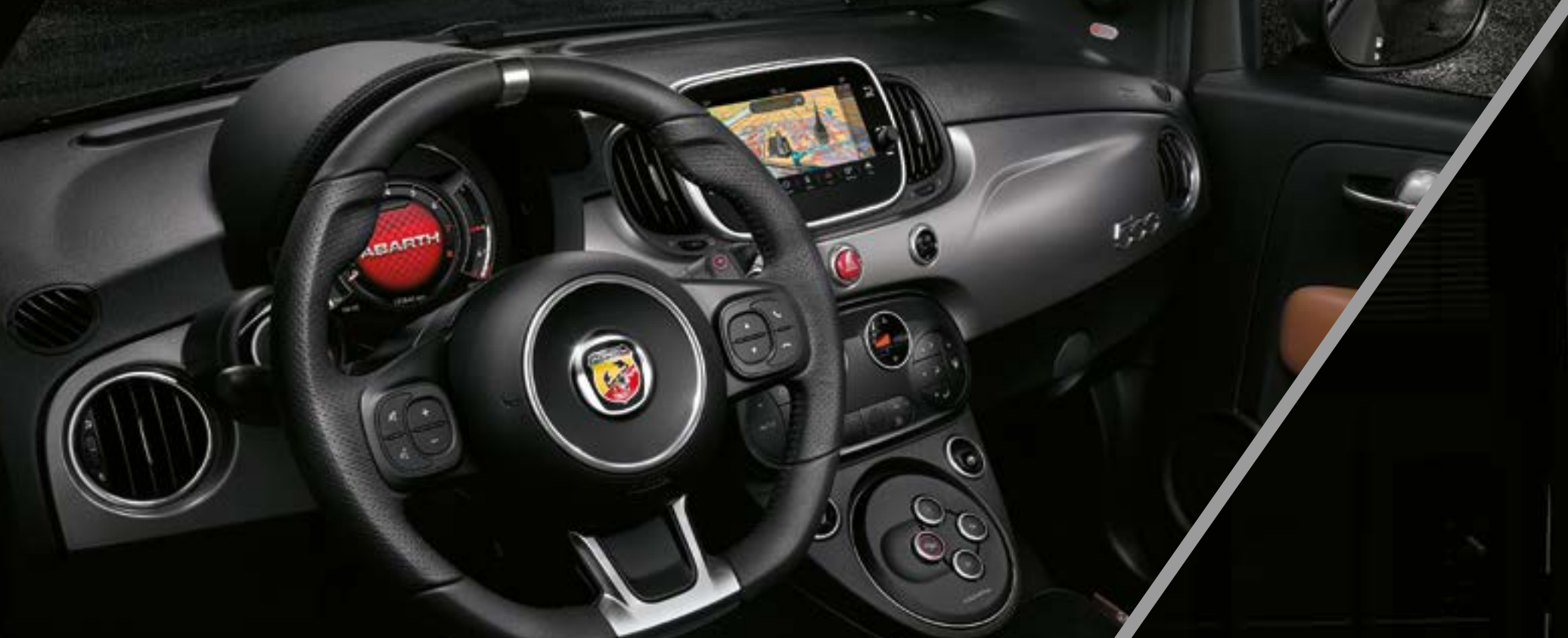
Planche de bord gris mat