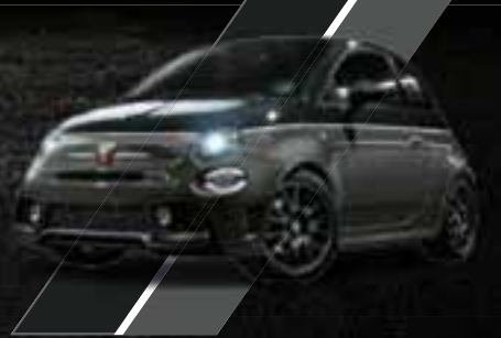
Nero Scorpione / Grigio Record