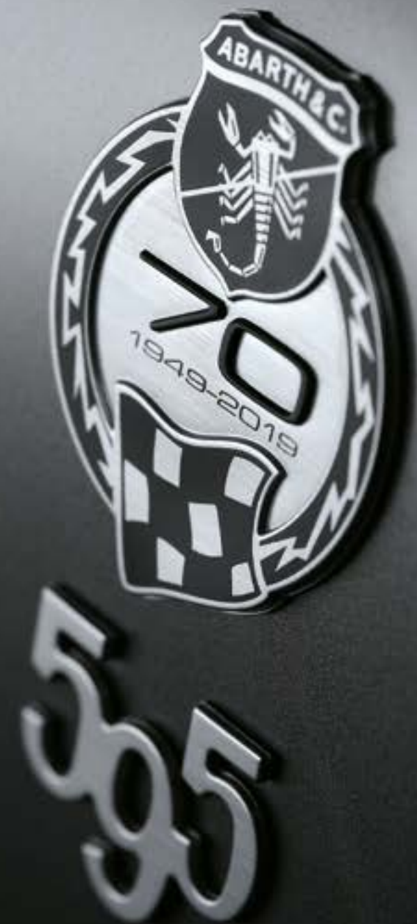
Badges 595 avec écussons 70° anniversaire sur les côtés