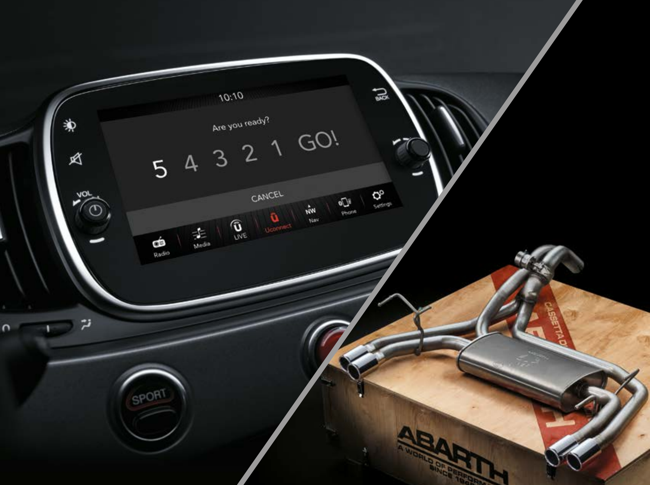
Système de télémétrie Abarth