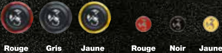
Rouge Gris Jaune Rouge Noir Jaune