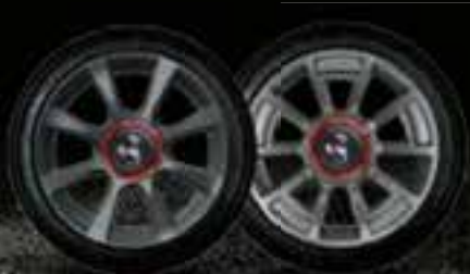
16" 8 BRANCHES 16" HERITAGE