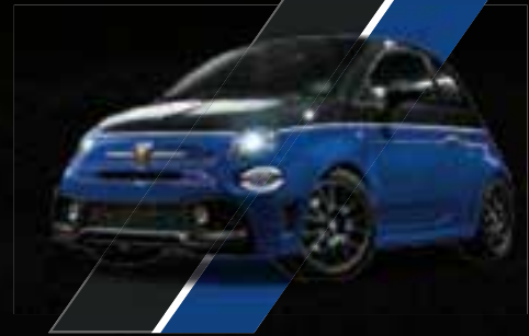
Nero Scorpione / Blu Podio