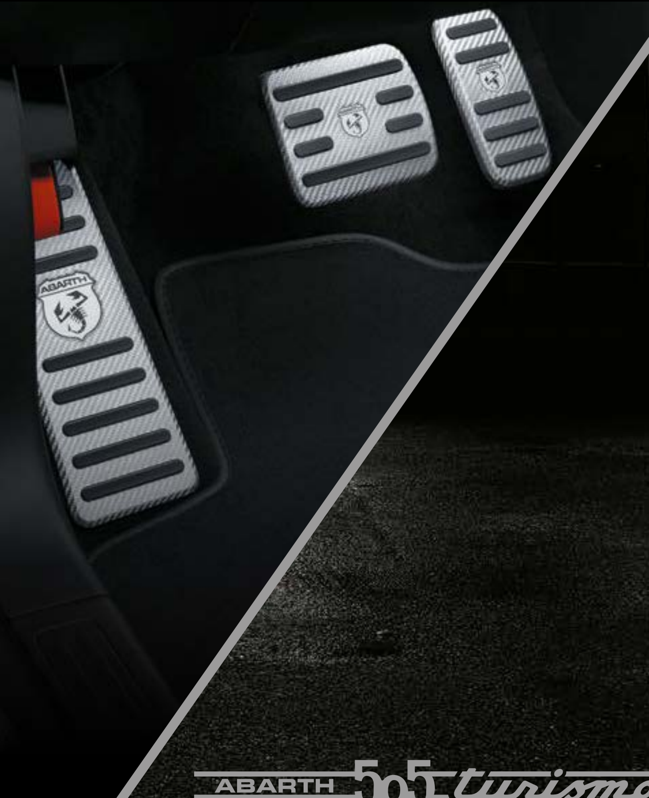
Pédalier et repose-pied en inox