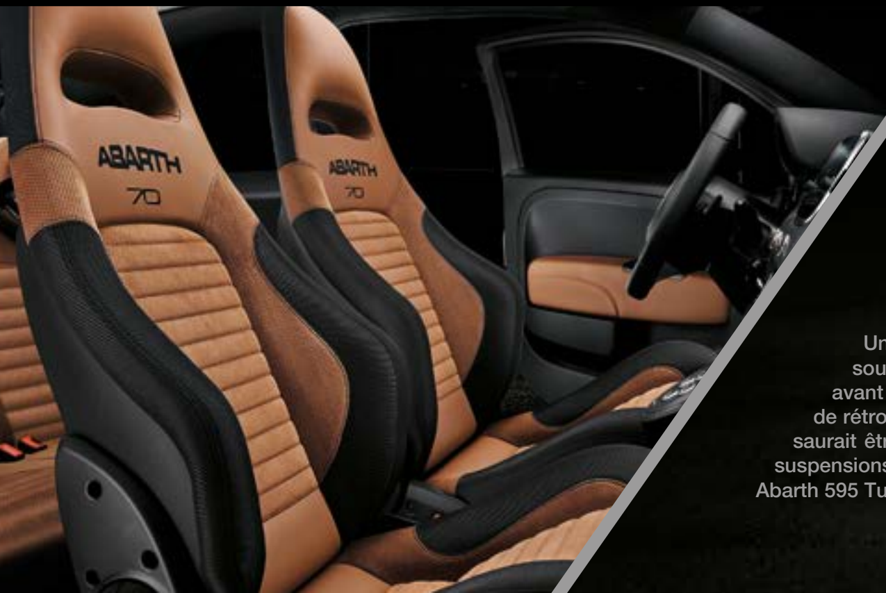
Sièges Sabelt® 70 GT en cuir (option)

Un style inégalable capable de créer des émotions à couper le souffle. Avec sièges Abarth Sport en cuir, inserts de boucliers avant et arrière dans des tons assortis, vitre arrière teintée et coques de rétroviseurs en finition chrome satiné. Et comme la performance ne saurait être laissée de côté, un moteur de 165 ch avec turbo Garrett et suspensions arrière Koni à technologie FSD (Frequency Selective Damping). Abarth 595 Turismo, une personnalité qui ne passe pas inaperçue.