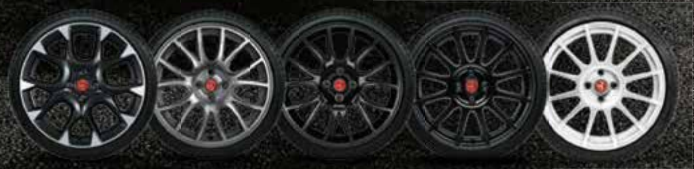
17" COMPETIZIONE 17" TITANIUM 17" MATT BLACK 17" SUPERSPORT 17" SUPERSPORT BLANCHE