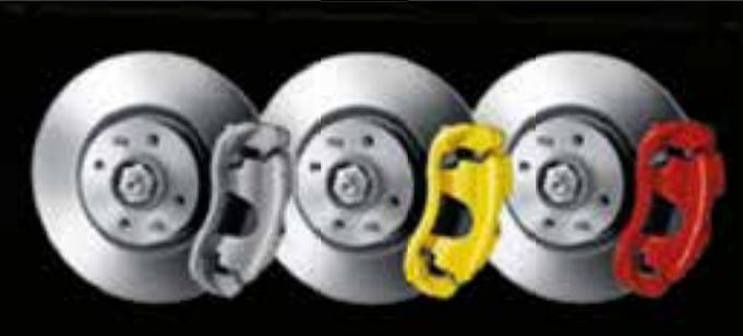
Gris (de série sur 595) Jaunes Rouges