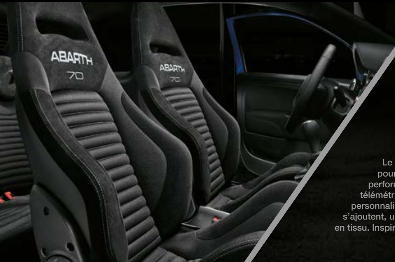
Sièges Sabelt® Racing (option)

Le plaisir dans sa forme la plus pure. Cette voiture est conçue pour tous ceux qui aiment tester et repousser les limites de la performance. À son bord, vous pourrez profiter du système de télémétrie Abarth exclusif, qui vous permettra de créer des trajets personnalisés et de mesurer vos performances au volant. À quoi s'ajoutent, un écran couleur avec mode Sport, et des sièges Abarth Sport en tissu. Inspirée par les circuits, pour son nom comme pour sa nature.