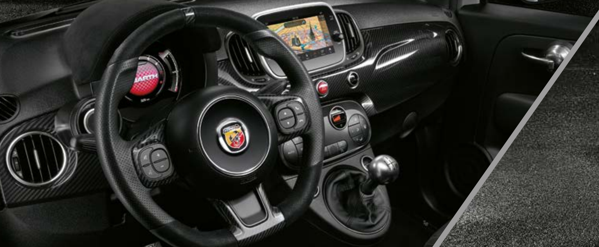
Planche de bord en fibre de carbone (option)