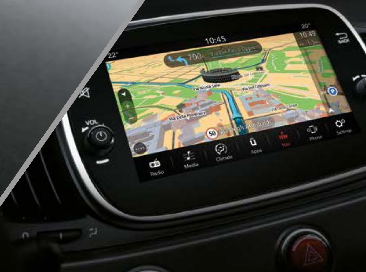
Radio Uconnect™ 7" avec navigation, Apple CarPlay et Android Auto™