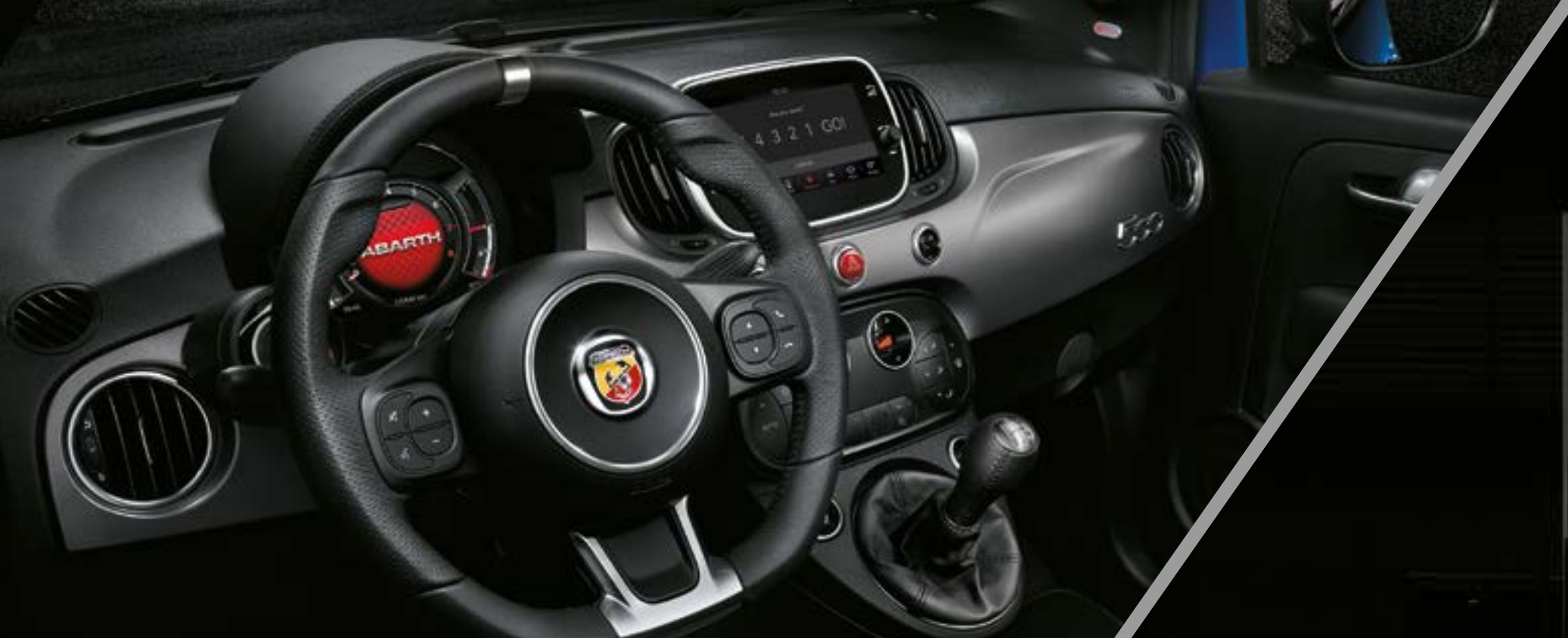
Planche de bord gris mat