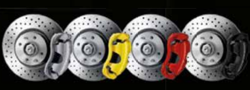
Gris (de série sur 595 Turismo) Jaunes Rouges (de série sur 595 Pista) Noirs