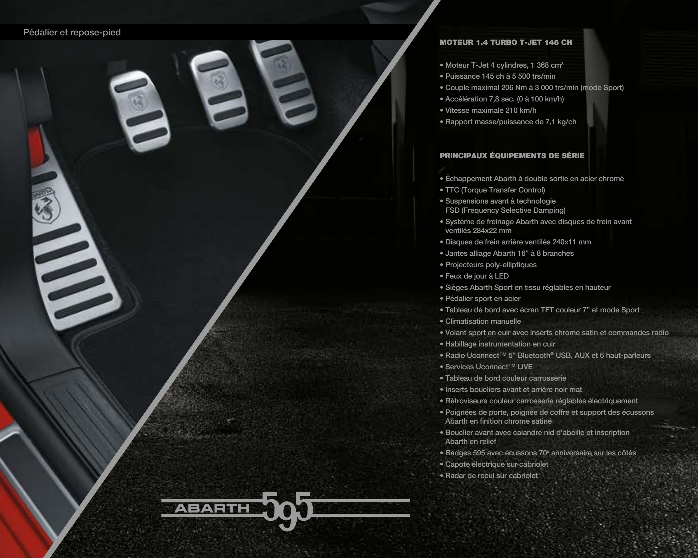
Pédalier et repose-pied