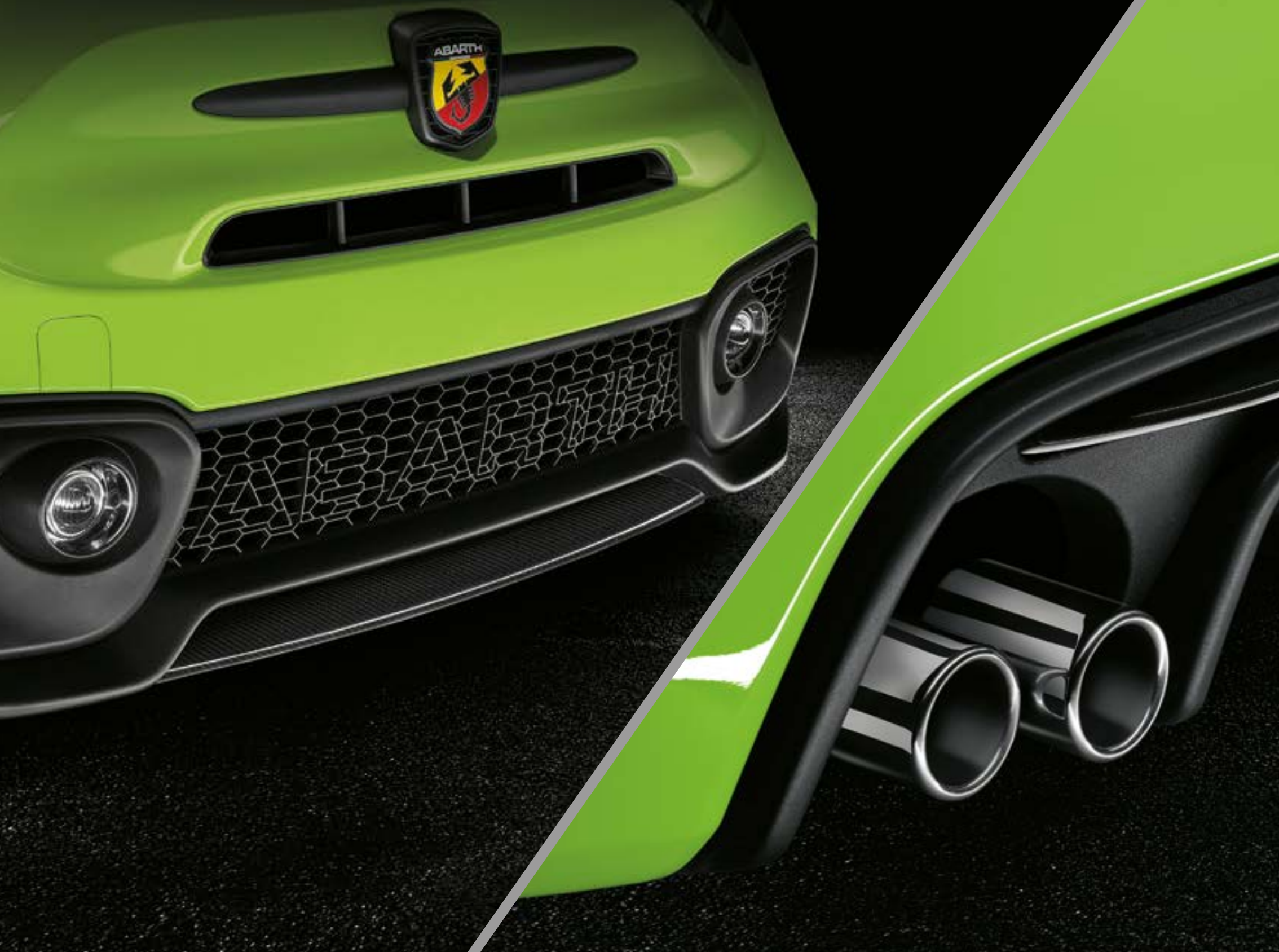
Insert bouclier avant en fibre de carbone (option)