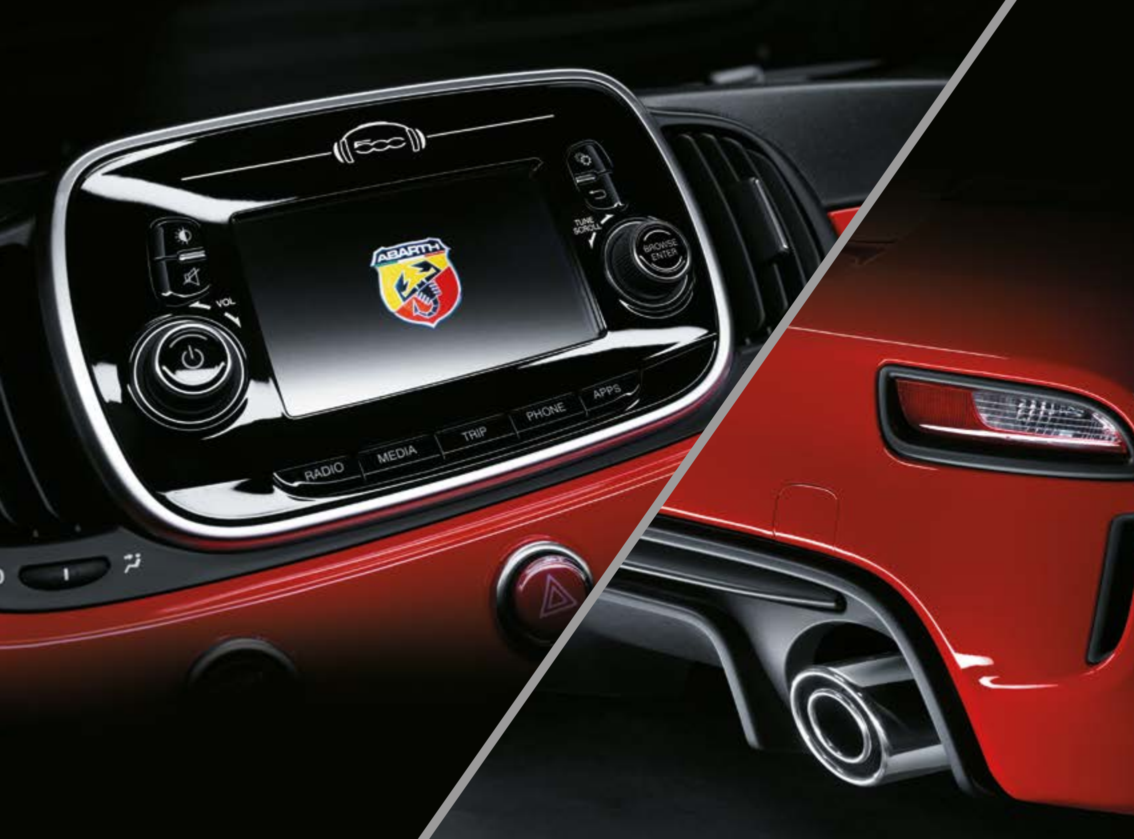
Radio Uconnect™ 5" avec commandes au volant