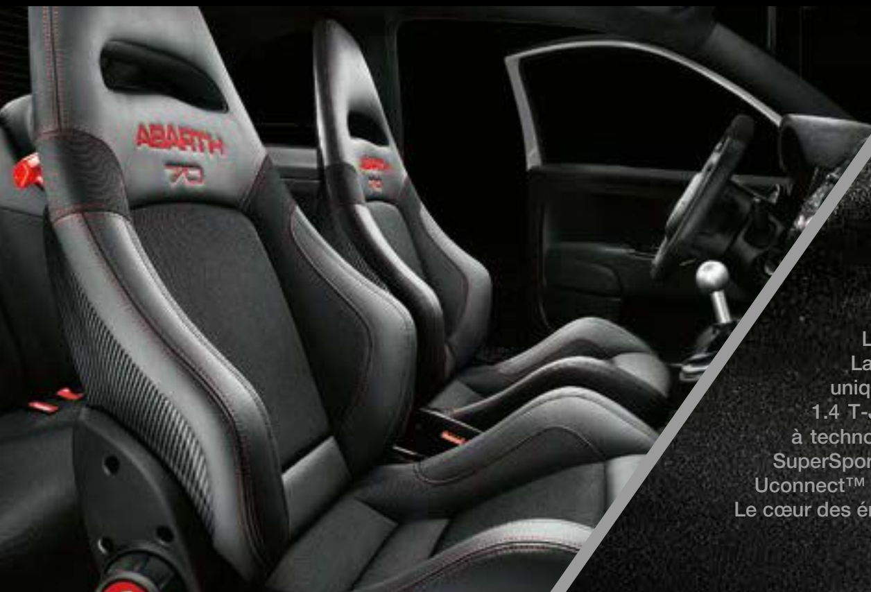
Sièges Sabelt® Racing avec coque en fibre de carbone

Le symbole des performances du Scorpion : Abarth 595 esseesse. La puissance et la performance à l'état pur. Une voiture conçue uniquement pour ceux qui exigent le meilleur. Équipée d'un moteur 1.4 T-Jet 180 ch à 4 cylindres, de suspensions avant et arrière Koni à technologie FSD (Frequency Selective Damping), de jantes en alliage SuperSport blanches de 17 pouces, d'un échappement Akrapovič et du Uconnect™ 7" avec navigation. Le cœur des émotions vibre ici.