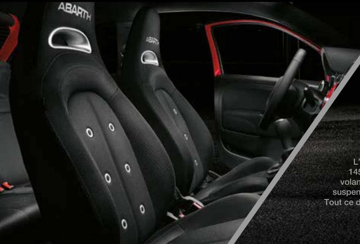
Sièges Abarth Sport en tissu

L'Abarth parfaite pour un démarrage parfait. Un moteur 1.4 T-Jet 145 ch à 4 cylindres, un échappement chromé à double sortie, un volant sport en cuir avec point milieu et commandes au volant, et des suspensions arrière à technologie FSD (Frequency Selective Damping). Tout ce dont vous avez besoin pour être piqué par le Scorpion.