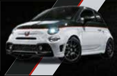
Nero Scorpione / Bianco Gara