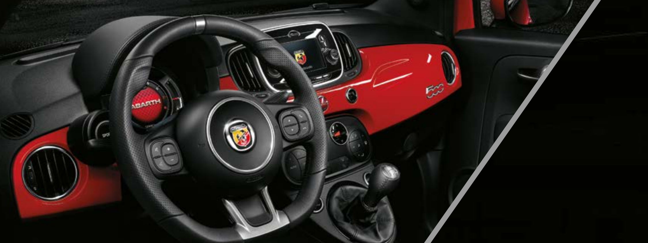
Planche de bord dans la teinte de la carrosserie