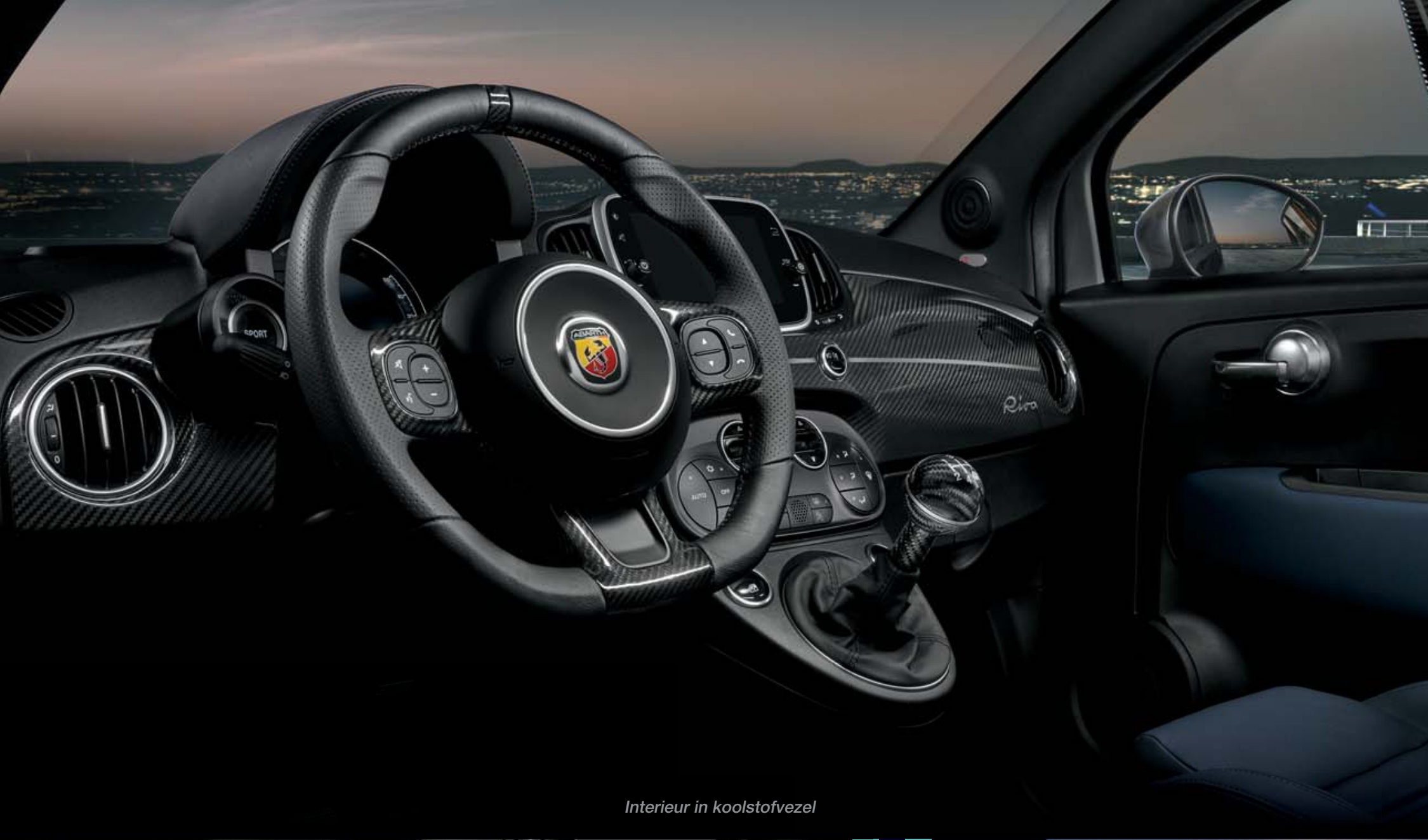
Interieur in koolstofvezel