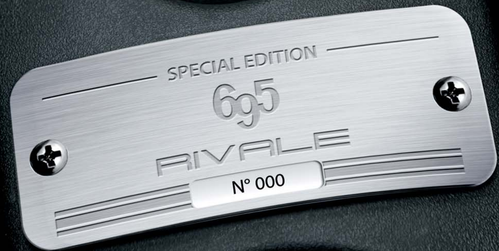
Een genummerd plaatje: het sluitstuk van het exclusieve karakter van uw Abarth 695 Rivale