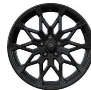
02_ CERCHI IN LEGA DA 19" SNOWFLAKE NOIR BRILLANT