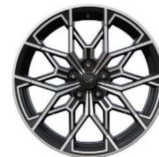
04_ CERCHI IN LEGA DA 19" DIAMANTATI SNOWFLAKE NOIR BRILLANT