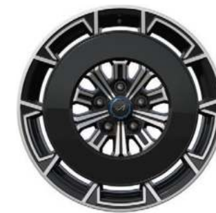
05_ COPRICERCHI AERODINAMICI NOIR BRILLANT PER CERCHI SNOWFLAKE*