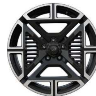
01_ CERCHI IN LEGA DA 19" DIAMANTATI ICONIC NOIR BRILLANT