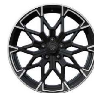
03_ CERCHI IN LEGA DA 19" SEMI DIAMANTATI SNOWFLAKE NOIR BRILLANT