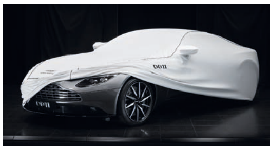
プロテクトパック