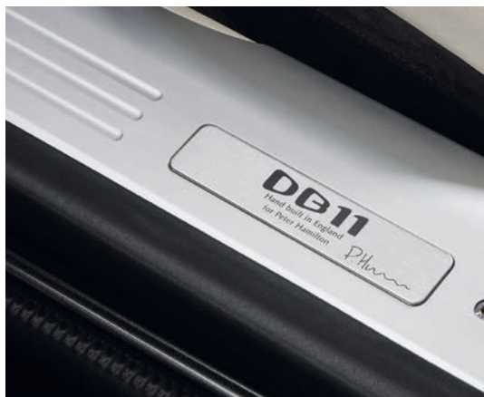
シグネチャーパック