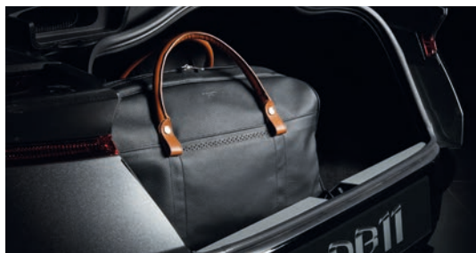
ラゲッジ4点セット