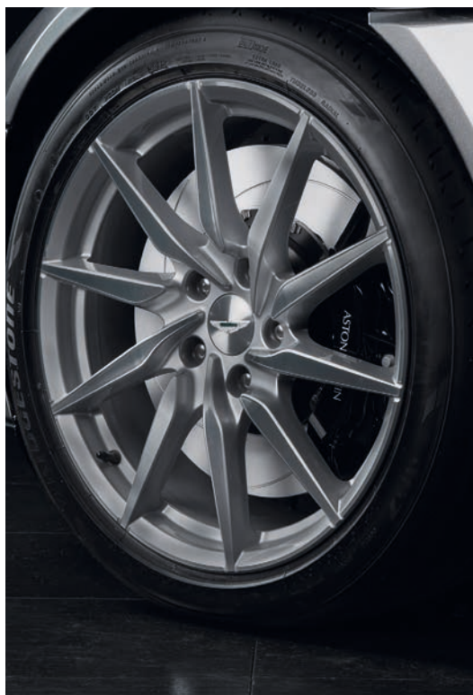
ウィンターホイールおよびタイヤキット