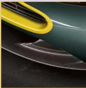
碳纤维前部分离器