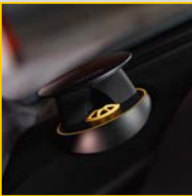
1000瓦Bang & Olufsen BeoSound音响系统，带ICEpower®技术，配合黑色阳极化处理的音响格栅和点缀设计