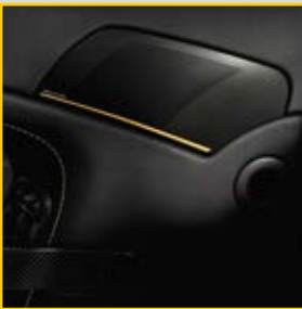
1000瓦Bang & Olufsen BeoSound音响系统，带ICEpower®技术，配合黑色阳极化处理的音响格栅和点缀设计