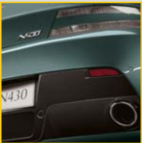
碳纤维尾部扩散器