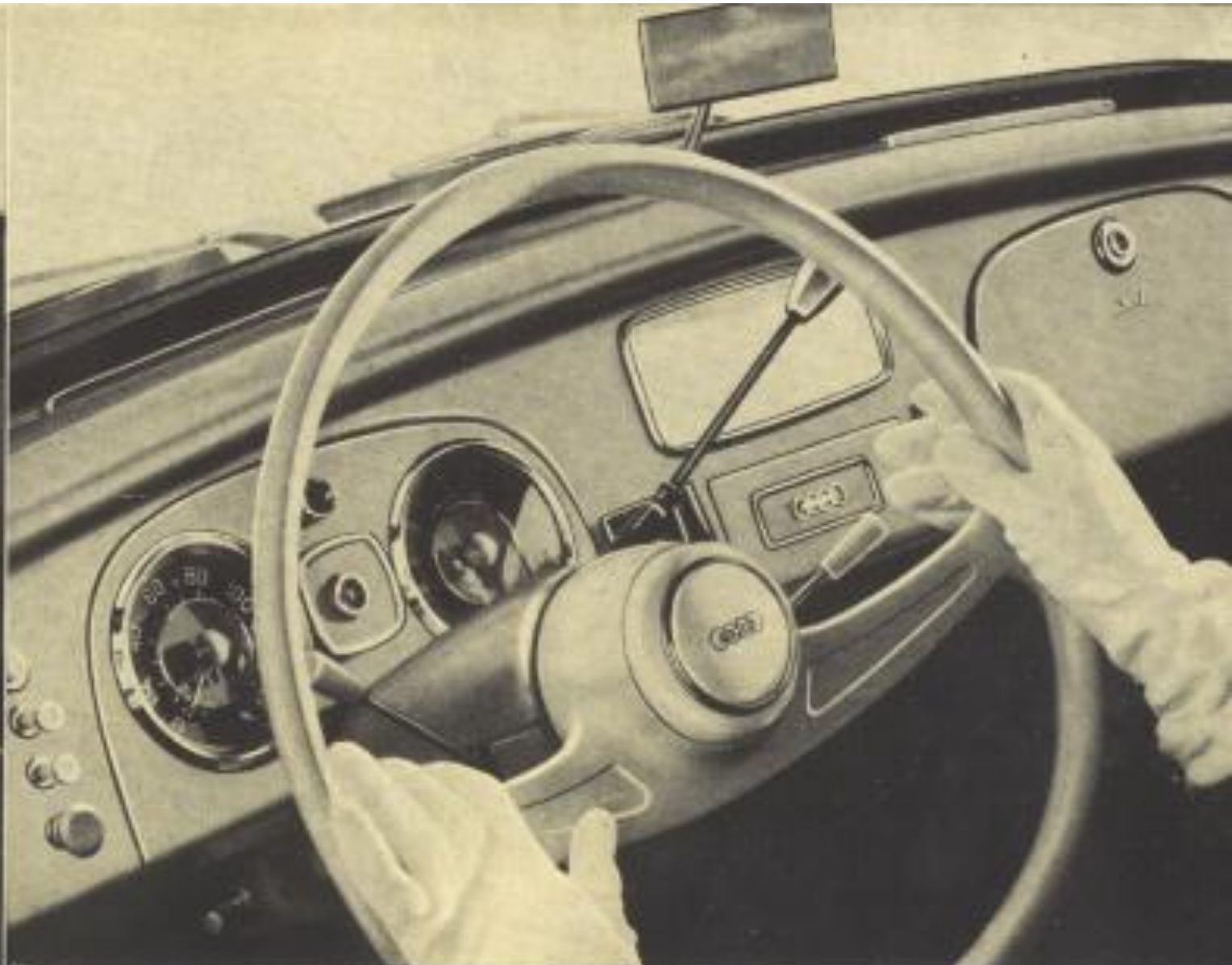
Hier sehen Sie das ovale Lenkrad mit den griffnahen Bedienungshebeln an Steuersäule und Armaturenbrett. Alle Instrumente sind mit einem Blick zu erfassen. Wichtig: das serienmäßig eingebaute, diebstahlsichernde Lenkschloß (außer bei der Limousine Normal).