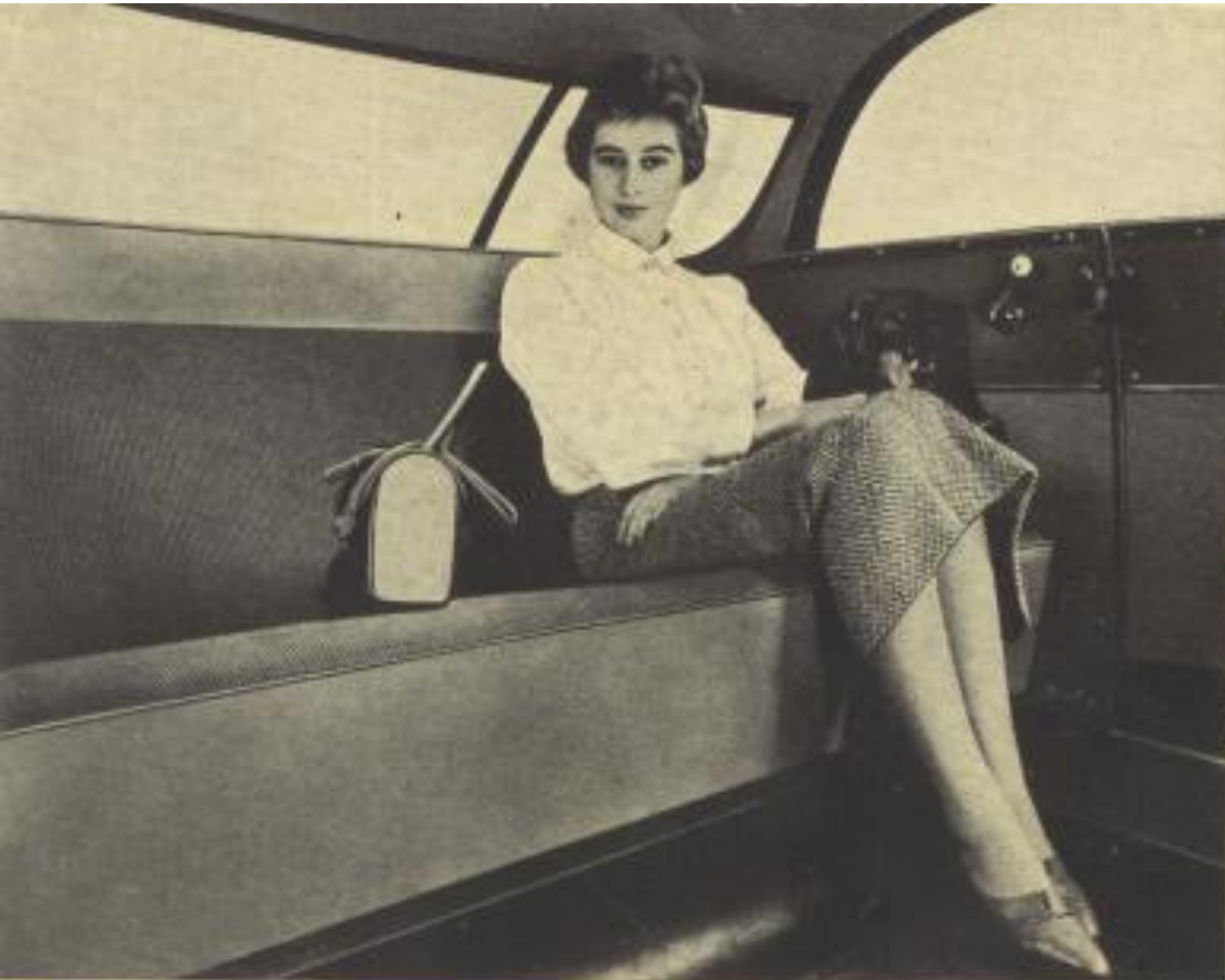
Kein Trickbild: So viel Platz ist im Fond des großen DKW vorhanden, vorn sitzt man ebenso bequem, kein Kardantunnel beeengt den Fußraum. Viele Gegenstände lassen sich zusätzlich in der Ablage zwischen Sitzlehne und Rückfenster unterbringen.