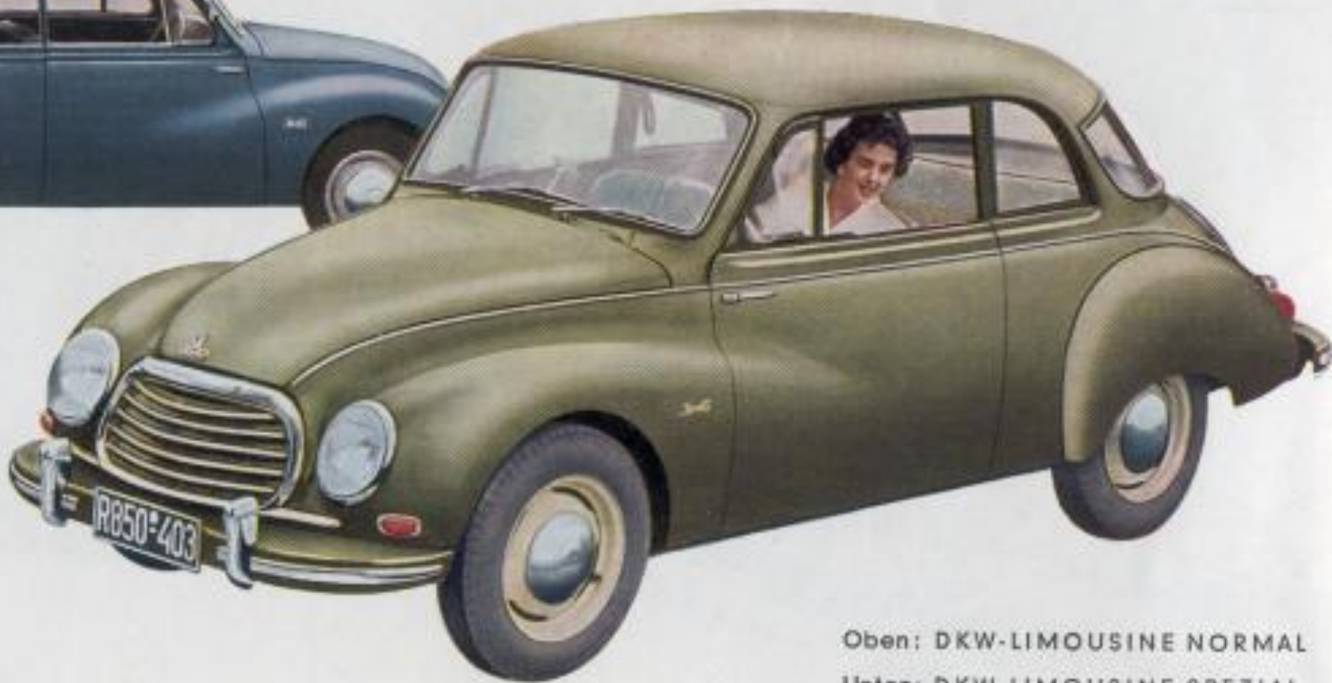
Oben: DKW-LIMOUSINE NORMAL Unten: DKW-LIMOUSINE SPEZIAL

Die DKW-Limousine Spezial besitzt ein sperr-synchronisiertes Viergang-Getriebe. Ihre Innenausstattung ist von gediegener Eleganz. Zweifarbigte Polsterstoffe geben diesem Modell eine besonders geschmackvolle Note.