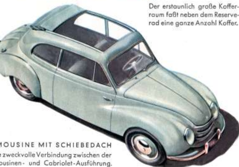
MOUSINE MIT SCHIEBEDACH die zweckvolle Verbindung zwischen der ousinen- und Cabriolet-Ausführung.