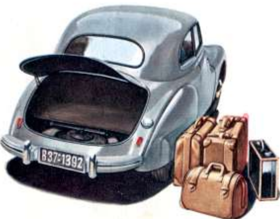
Der erstaunlich große Kofferraum faßt neben dem Reserve- rad eine ganze Anzahl Koffer.