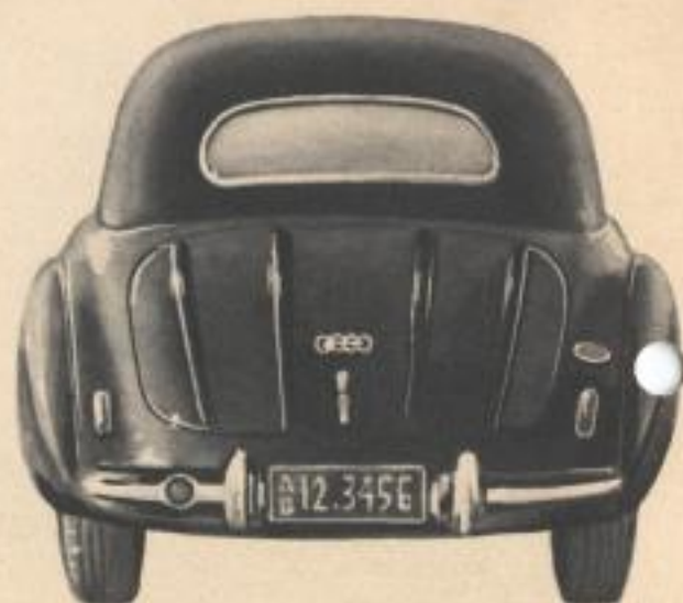
Das breite, schnittige Heck des neuen DKW, dem man die Geräumigkeit des Wagens ansieht, mit verschließbarem Kofferraum.