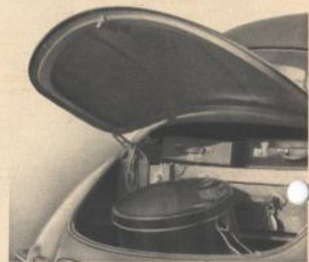
Der Kofferraum ist bequem zugänglich und faßt neben dem Reserverad eine erhebliche Menge Koffer.