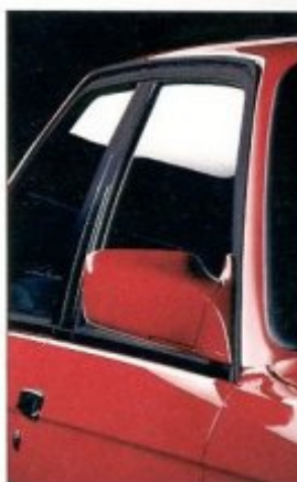
Shadow-Line ist der Name dieser sportlichen Optik. Auf Chrom wurde weitgehend verzichtet. Bis auf die BMW Niere und die Türschlösser zeigen sich die sonst verchromten Teile in matten Schwarz. Die Shadow-Line-Optik wird durch in Wagenfarbe lackierte Stoßfänger und Außenspiegel vervollständigt.