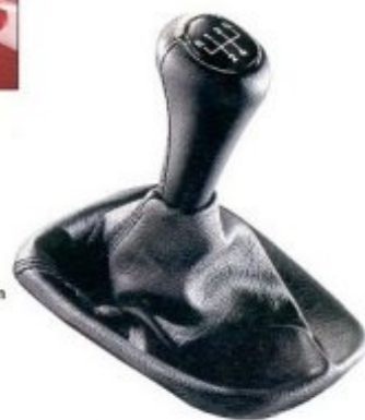
Schalthebel und -balg in feinem Leder gehören zum serienmäßigen Outfit des 318is.