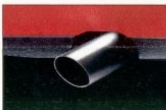
Der 318is besitzt eine sportliche Auspuffanlage mit vergrößertem Auspuffrohr und Dreifach-Katalysator.

höhere Fahrstabilität, höhere Fahrleistungen, niedrigerer Verbrauch.