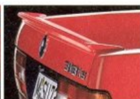
lisch initiierten Designs ist eine spürbare Reduktion der Auftriebswerte und des c_w -Wertes. Oder mit anderen Worten:

höhere Fahrstabilität, höhere Fahrleistungen, niedrigerer Verbrauch.