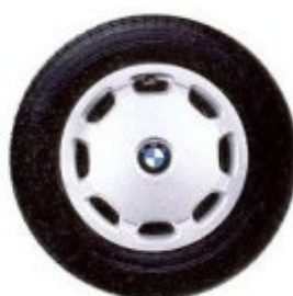
Eigens für den 318is haben die BMW Designer neue, eigenständige Radblenden gestaltet. Sie bieten neben der unverwechselbaren Erscheinung den Vorteil optimierter Bremsenkühlung.

Eine der attraktivsten Führungspositionen: das Cockpit des 318is. Für die faszinierende Ästhetik ihrer Cockpit-Gestaltung ist die 3er-Reihe berühmt. Im 318is setzen spezielle Ausstattungsdetails darüber hinaus markante Akzente, die die dynamische Sonderstellung dieses BMW 3er betonen.