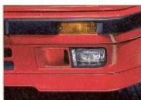
Front- und Heckspoiler des 318is haben ihre endgültige Form im Windkanal erhalten. Das Ergebnis dieses physika-