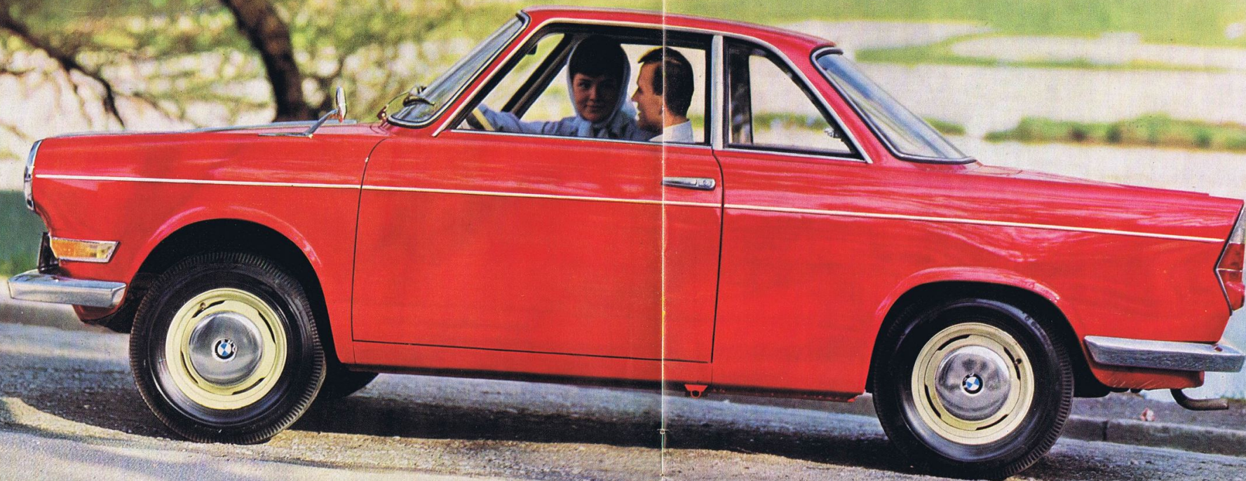
BMW 700 C