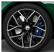
M 星輻式 811M