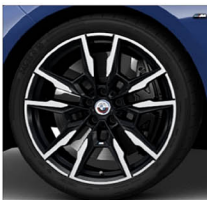
M 雙輻式 895M