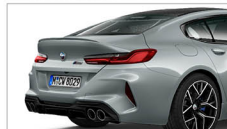
M850i xDrive Gran Coupé