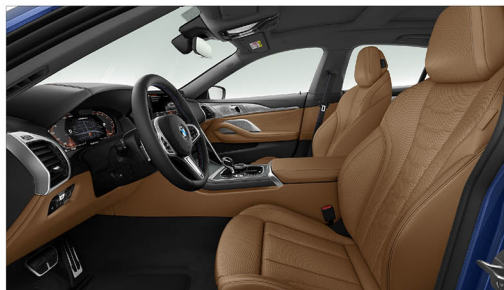
Merino 真皮 / 舒適型跑車座椅 M850i xDrive Gran Coupé