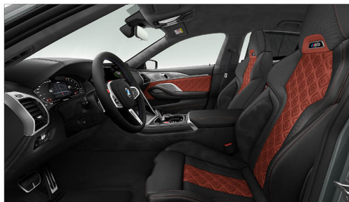
Merino 真皮 / M跑車座椅搭配專屬發光字樣 M8 Coupé / M8 Gran Coupé