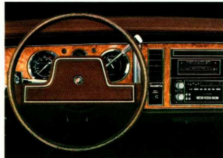
Au Canada, les instruments sont en mesures métriques, s'il y a lieu.

Pour beaucoup d'automobilistes, l'Electra n'est pas seulement une Buick, c'est la Buick par excellence. Nous n'avons nullement l'intention de les contredire et nous reconnaissons même dans cette attitude un hommage aux qualités que la marque