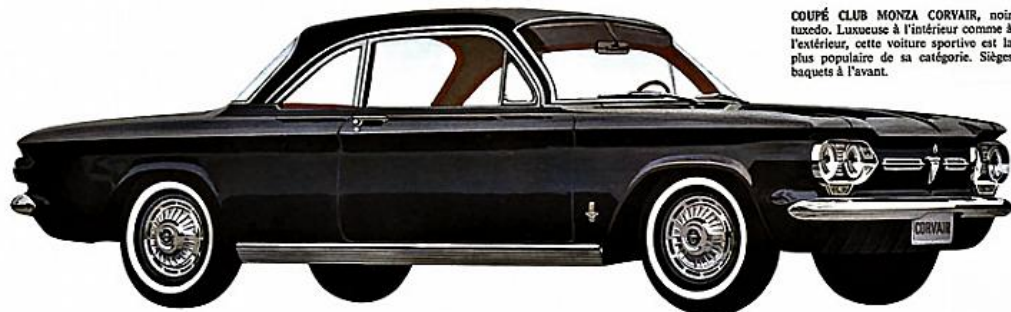
COUPÉ CLUB MONZA CORVAIR, noir tuxedo. Luxueuse à l'intérieur comme à l'extérieur, cette voiture sportive est la plus populaire de sa catégorie. Sièges baquets à l'avant.

TOUJOURS PLUS POPULAIRE! Il suffit de voir et de conduire la Monza une seule fois pour comprendre sa croissante popularité. Intérieur confortable, lignes dégagées, facilité de conduite, voilà les raisons pour lesquelles la Monza est tant imitée... sans être égale. Voyez cet intérieur spacieux, au plancher surbaissé, pratiquement plat. Epreuvez la commodité du siège arrière pliant. Vous estimerez bien raisonnable le prix de la Monza en regard de tous les avantages qu'elle offre.