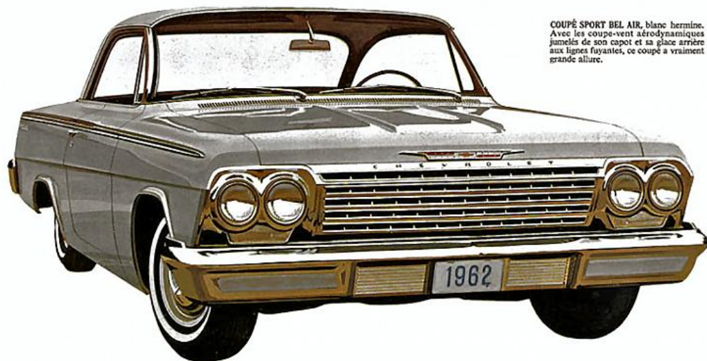
COUPÉ SPORT BEL AIR, blanc hermine. Avec les coupe-vent aérodynamiques jumelés de son capot et sa place arrière aux lignes fuyantes, ce coupé a vraiment grande allure.

UNE FOULE DE CARACTÉRISTIQUES ADMIRABLES dans une voiture de prix populaire! Espace, luxe, prix modéré, voilà ce que demandent les usagers et voilà ce que la Bel Air leur offre. Ces lignes élégantes, cet intérieur spacieux, cette tenue de route impeccable, des milliers de Canadiens les réclamaient. Les voici et, de plus, la Bel Air est de dimensions pratiques permettant des manoeuvres aisées. Les quelques caractéristiques standard qui suivent vous donneront une idée du luxe de la Bel Air: sièges avant et arrière rembourrés de mousse, plafonnier automatique, lampe de boîte à gants, volant de luxe avec bouton spécial d'avertisseur, quatre longs accoudoirs très pratiques, très confortables. Tout cela avec la sûreté du fonctionnement particulier à Chevrolet 1962. Et n'oubliez pas que l'économique série Bel Air comprend maintenant 2 station wagons.