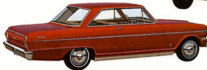
COUPÉ SPORT CHEVY II NOVA 400, rouge Honduras.

LES INTÉRIEURS DES CHEVY II. Voici l'intérieur de la Nova 400; aménagé avec un goût parfait, il est typique de toute la série Chevy II. Remarquez l'empiecement de vinyle qui souligne les dossiers. Les intérieurs se font en fauve, aigue-marine, rouge, bleu et or, assortis à la carrosserie. Si vous aimez l'allure sport, vous demanderez les sièges baquets* tout vinyle, pour la décapotable Nova 400. Les intérieurs de la Chevy II, série 300, et ceux de la Chevy II, série 100, sont aussi élégants que pratiques. Dans toutes les séries, les intérieurs sont présentés dans toute une gamme de belles couleurs assorties à chacune des 14 couleurs ou des 10 combinaisons deux tons offertes pour l'extérieur. (Pas de deux tons pour les décapotables.)