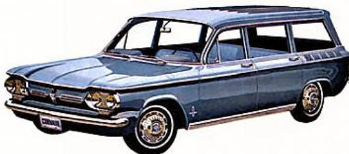
STATION WAGON MONZA CORVAIR, bleu crépuscule. Chargement par l'avant ou l'arrière, 6 places, moteur à l'arrière... idéal pour la famille.

LE PLUS ADAPTABLE QUI SOIT. Pour le travail, les loisirs familiaux, le sport, les station wagons sport Greenbrier offrent jusqu'à 175,5 pi. cu. de volume de charge... soit près de deux fois celui des station wagons ordinaires. Les sièges des Greenbrier, rembourrés de mousse, peuvent accueillir confortablement 6 passagers. Le second siège peut faire face à l'avant ou à l'arrière. Un troisième siège* permet d'accueillir neuf passagers. Les doubles portes, à l'arrière et du côté droit, facilitent le chargement au maximum. Les deux modèles 1962—le Greenbrier et son compagnon le Greenbrier De Luxe—bénéficient d'une finition impeccable à l'intérieur comme à l'extérieur.