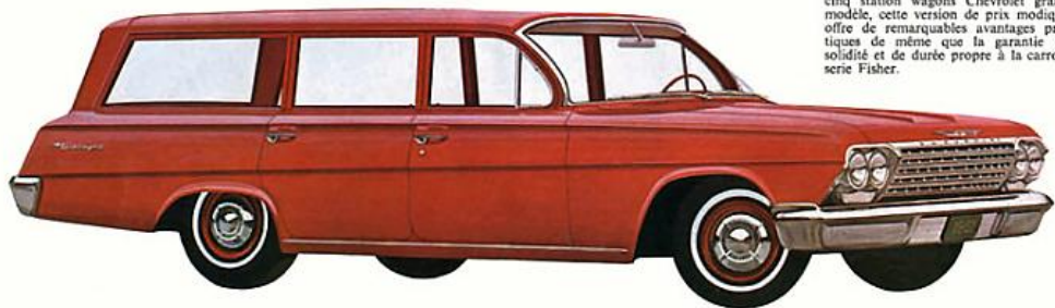
STATION WAGON BISCAYNE 4 PORTES 6 PLACES, rouge romain. Comme les cinq station wagons Chevrolet grand modèle, cette version de prix modique offre de remarquables avantages pratiques de même que la garantie de solidité et de durée propre à la carrosserie Fisher.

L'INTÉRIEUR DE LA BISCAYNE 1962 allie commodité et élégance. Il comporte une doublure de toit en vinyle et des revêtements de siège en vinyle à côtes, également faciles d'entretien. Comme dans les sedans Biscayne, ces garnitures à jolis motifs sont aussi durables que belles. Les tapis de caoutchouc, enduits de vinyle à motifs mouchetés, sont assortis aux couleurs des garnitures. Celles-ci sont offertes en une palette entièrement nouvelle—fauve, aigue-marine ou rouge—qui s'harmonise aux 14 couleurs et 10 combinaisons deux tons de la carrosserie.