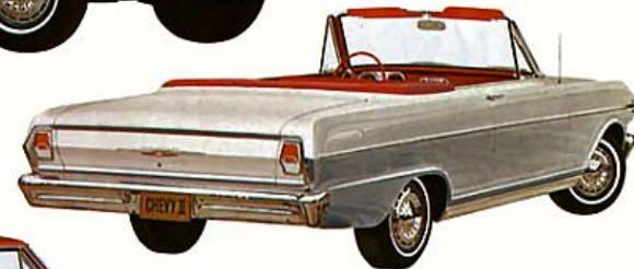
DÉCAPOTABLE CHEVY II NOVA 400, blanc hermine. La décapotable Chevy la moins coûteuse.