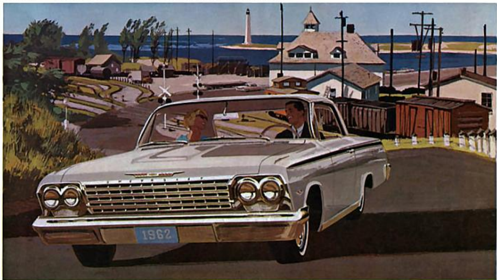
COUPÉ SPORT IMPALA, blanc ermine

UN ROULEMENT DOUX COMME LE VOL D'UN JET. La robuste suspension à 4 ressorts à boudin absorbe les cahots des routes les plus rudes. Les matières isolantes spéciales, comme les blocs de montage de carrosserie en butyle et de nombreux autres perfectionnements, contribuent à cette douceur de roulement. • CARROSSERIE SIGNÉE FISHER. Une fabrication soignée par une main-d'œuvre experte et une attention minutieuse aux détails, caractérisent les carrosseries Fisher. A preuve de cette recherche constante de la qualité, les ailes avant sont doublées à l'intérieur de garde-boue qui protègent le métal contre le sel et la neige fondante provoquant la rouille. • CHÂSSIS À POUTRELLES DE SÉCURITÉ. Ce modèle en X est le plus rigide, le plus robuste pour les voitures de cette taille. • FREINS SAFETY-MASTER. Garnitures de grande taille, collées, exceptionnellement durables, garantissant des arrêts plus sûrs. • ESSUIE-GLACE ÉLECTRIQUES À BALAYAGE PARALLÈLE. • FINI MAGIC-MIRROR résistant au soleil, au sel, à l'écaillage. • COMMUTATEUR D'ALLUMAGE À 5 POSITIONS: accessoires, verrouillage, contact coupé, contact, démarrage. • CLEF UNIQUE POUR TOUTES LES SERRURES. • VERROUILLAGE SANS CLEF ET BIEN D'AUTRES PERFECTIONNEMENTS.