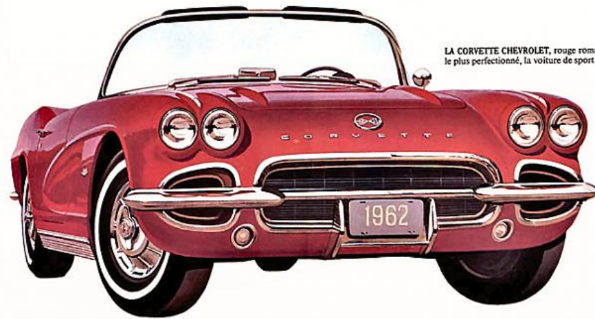
LA CORVETTE CHEVROLET, rouge romain. Le modèle le plus perfectionné, la voiture de sport par excellence.

PUISSANCE NOUVELLE, LIGNES NOUVELLES POUR LA VOITURE DE SPORT PAR EXCELLENCE. La Corvette a encore amélioré ses performances. En effet, les nouveaux moteurs V8 de 327 po. cu., dont on peut l'équiper, lui fournissent une puissance plus nerveuse que jamais: de 250 CV, pour le V8 standard, jusqu'à 360 CV pour le moteur Ramjet à injection de carburant*. La boîte Synchro-Mesh 3 vitesses standard ou la Synchro-Mesh* 4 vitesses s'adaptent à tous les moteurs, tandis que la nouvelle Powerglide* automatique se monte avec deux des moteurs. La nouvelle Corvette présente un profil entièrement nouveau et ses marques distinctives de même que sa grille avant ont été encore embellies. L'intérieur est toujours aussi luxueux avec ses sièges baquets, ses tapis bouclés épais et ses riches aménagements, dont des panneaux de porte nouveau modèle.