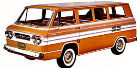
STATION WAGON SPORT CORVAIR GREENBRIER, jaune Yuma et blanc camée. Moulures brillantes de la carrosserie, aménagements spéciaux.

ÉQUIPEMENT SPÉCIAL ET FACULTATIF DES CORVAIR 1962: climatisation à nouveau compresseur silencieux*... siège* arrière pliant, augmentant le volume de charge (standard sur les Monza)... radio à transistors à boutons-poussoirs*... pneus à étroite bande blanche*.