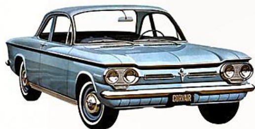
COUPÉ CLUB CORVAIR 700, turquoise crépuscule. Phares jumelés et essuie-glace électriques font partie de l'équipement standard de toutes les Corvair 1962.