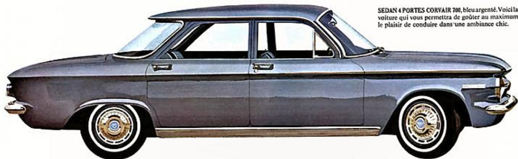
SEDAN 4 PORTES CORVAIR 700, bleu argenté. Voici la voiture qui vous permettra de goûter au maximum le plaisir de conduire dans une ambiance chic.

UNE VOITURE FAMILIALE À LA FOIS ÉCONOMIQUE ET LUXUEUSE. Sportive, nerveuse, avec une élégance unique, cette Corvaire 700 de luxe a tout ce qu'il faut pour plaire en 1962. Elle coûte peu à l'achat, son moteur refroidi par air est économique: elle plaira aux plus ménagers. Deux modèles populaires: coupé Club et sedan 4 portes. Les moulures brillantes des seuils de porte rappellent le style de la Monza. Les intérieurs d'un luxe inédit avec leurs garnitures de tissu et de vinyle, offrent un choix de quatre couleurs assorties. Robustesse, fabrication soignée, sécurité, sont d'autres avantages qu'apporte la Corvaire 700 avec sa carrosserie monocoque signée Fisher.