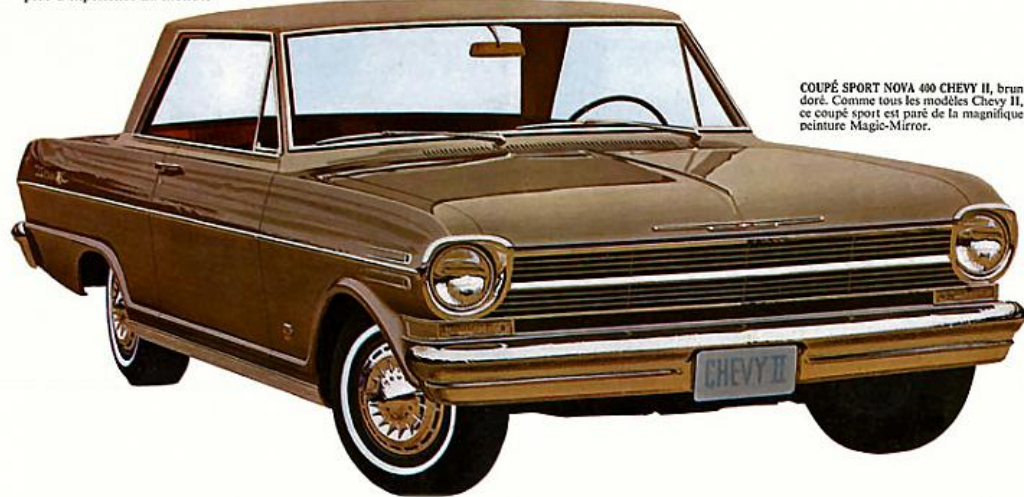
COUPÉ SPORT NOVA 400 CHEVY II, brun doré. Comme tous les modèles Chevy II, ce coupé sport est peint de la magnifique peinture Magic-Mirror.

SÉRIE ENTièrement NOUVELLE DE VÉHICULES PRATIQUES. Tout est fonctionnel dans cette nouvelle voiture économique... la Chevy II. La Chevy II ne mesure qu'un peu plus de 15 pieds de l'avant à l'arrière. Ses autres dimensions sont également pratiques; elle se manœuvre avec une aisance surprenante. Cependant, son intérieur est spacieux et des portes larges et hautes y donnent accès. Le coffre peut contenir sans peine les bagages de toute la famille. La Chevy II est de plus une voiture qui convient aux budgets les plus serrés. Elle est économique à l'achat et elle le reste à l'usage, comme toutes les voitures Chevy. Les moteurs montés en équipement standard, le 4-cylindres comme le 6-cylindres, contribuent naturellement à ces économies. La Chevy II offre neuf modèles. Il est facile de choisir la voiture qui vous plaît parmi les quatre sedans, les trois station wagons, le coupé sport et la décapotable. Avec la Chevy II, vous pouvez être assuré d'avoir une voiture avantageuse, car elle est fabriquée par le constructeur automobile qui a le plus d'expérience au monde.