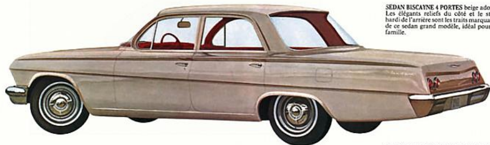
SEDAN BISCAYNE 4 PORTES beige adobe. Les élégants reliefs du côté et le style hardi de l'arrière sont les traits marquants de ce sedan grand modèle, idéal pour la famille.

LES MOINS CÔUTEUSES DE TOUTES LES GRANDES CHEVROLET. Voici trois des voitures les plus avantageuses que vous puissiez trouver. Les Biscayne 1962 (sedan 2 portes, sedan 4 portes, station wagon 6 places), sont les moins coûteuses des grandes Chevrolet. Chaque Biscayne présente les belles lignes Chevrolet. Chacune offre une tenue de route parfaite et un intérieur spacieux. Chacune est dotée d'un équipement supérieur: siège avant rembourré de mousse, essuie-glaces électriques, déflecteurs à manivelle, accoudoirs à l'avant, deux pare-soleil, volant de luxe, serrure de boîte à gants. Et, naturellement, toutes les Biscayne possèdent ces qualités d'excellence grâce auxquelles il est si avantageux de posséder une Chevrolet 1962.