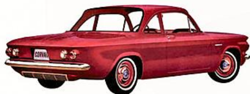
COUPÉ CLUB CORVAIR 500, rouge romain. La moins coûteuse de la série. Les feux arrière sont identiques à ceux des autres modèles Corvaire.

Le nouveau coupé Club Corvaire présente des caractéristiques propres à satisfaire les plus difficiles amateurs de voitures sportives. D'abord, la Corvaire 500 coûte peu. Les grilles nouveau modèle, à l'avant et l'arrière, rappellent celles de la Monza et des modèles 700. La Corvaire 500 de 1962 offre, entre autres dispositifs pratiques, deux pare-soleil, deux accoudoirs et un allume-cigarettes. Vous pouvez choisir parmi trois couleurs, assorties aux couleurs du fini Magic-Mirror de la carrosserie.