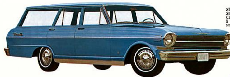
STATION WAGON NOVA 400, 4 PORTES, 2 SIÈGES, bleu crépuscule. Cette Chevy II est très maniable, très facile à garer, avec l'espace utile d'un gros station wagon.

LA SOBRIÉTÉ DANS CE QUELLE A DE PLUS BEAU. Voici la plus prestigieuse des Chevy II et certainement l'une des plus pratiques, l'une des plus agréables à posséder. Pour le luxe, peu de voitures dépassent la Nova 400 et pourtant elle satisfait les plus économes. Un tapis bouclé épais recouvre le tunnel. Les sièges sont recouverts d'un confortable rembourrage de mousse. La Nova 400 est équipée d'autre part, sans supplément de prix, d'accoudoirs à l'avant et à l'arrière, de cendriers individuels à l'arrière, de deux pare-solcil, d'un allume-cigarettes. Vous serez étonné de voir tout ce que la Nova 400 Chevy II vous offre à prix modique. La Nova 400 existe en coupé sport, station wagon et décapotable.