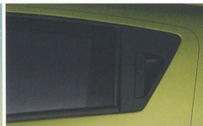
HINTERE TÜRGRIFFE VERBORGEN