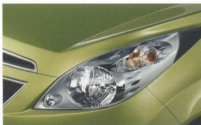
SCHARF GESCHNITTENE SCHEINWERFER