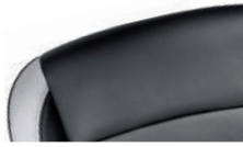
투톤 인조 가죽시트 - 블랙, 라이트 티타늄 (퍼펙트 블랙 전용)