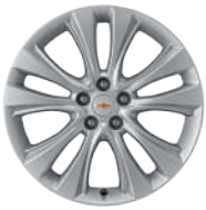
18인치 알로이 휠 (LT 코어 적용)