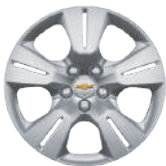
16인치 스틸 휠 (LS 적용)