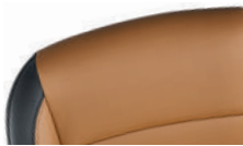
샌드 브라운 인조 가죽시트 (Premier 적용) ※아일랜드 블루(GUM) 선택 불가