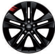
18인치 블랙 레드라인 알로이 휠 (레드라인 전용)