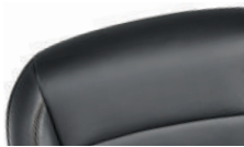
젯 블랙 인조 가죽시트 (LT 및 Premier 적용)