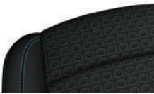
직물시트 (LS 적용)