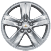
16인치 알로이 휠 (LS 디럭스, LT 적용)