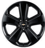
18인치 블랙 알로이 휠 (퍼펙트 블랙 전용)