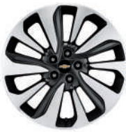
18인치 투톤 알로이 휠 (Premier 적용)