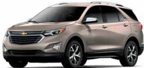
G8K – RÉCIF SABLONNEUX MÉTALLISÉ 1,4