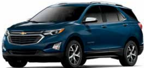
G35 – BLEU ORAGE MÉTALLISÉ 1,4,5