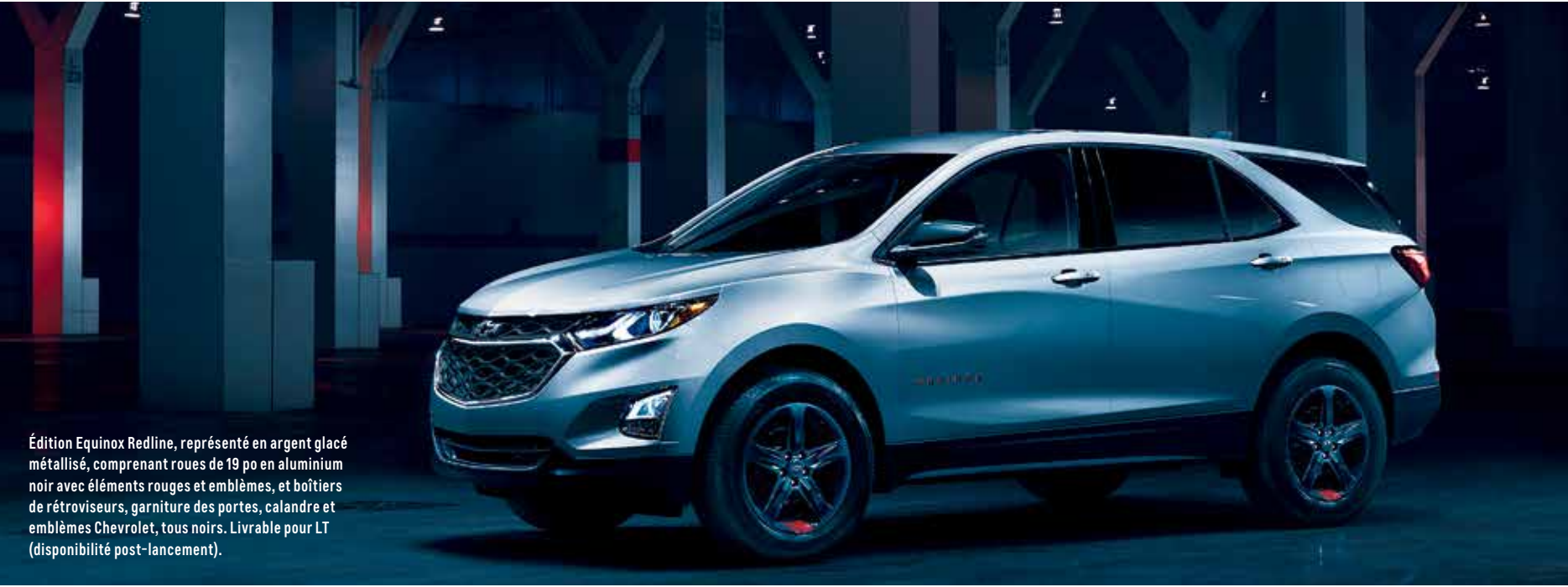
Édition Equinox Redline, représenté en argent glacé métallisé, comprenant roues de 19 po en aluminium noir avec éléments rouges et emblèmes, et boîtiers de rétroviseurs, garniture des portes, calandre et emblèmes Chevrolet, tous noirs. Livrable pour LT (disponibilité post-lancement).