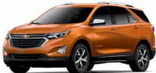
GGQ – ROUGE ORANGÉ MÉTALLISÉ 1,3