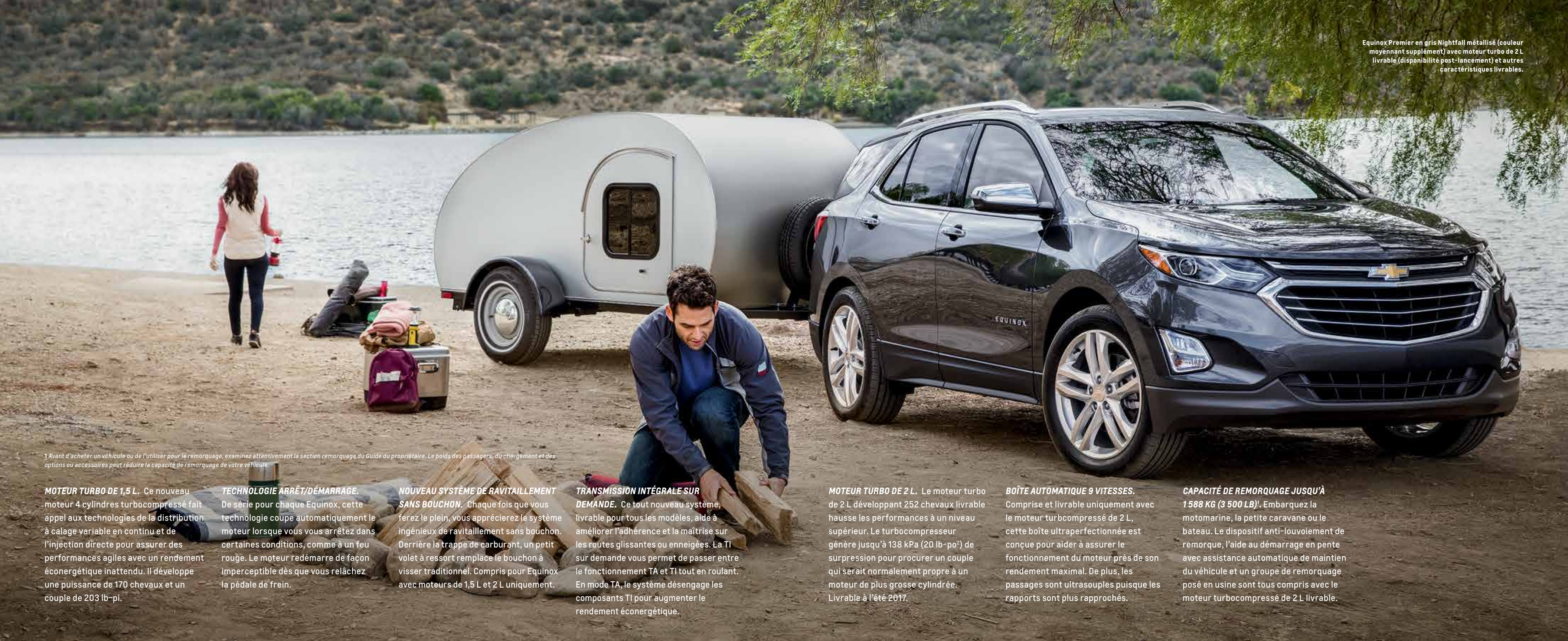
Equinox Premier en gris Nightfall métallisé (couleur moyennant supplément) avec moteur turbo de 2 L livrable (disponibilité post-lancement) et autres caractéristiques livrables.

1 Avant d'acheter un véhicule ou de l'utiliser pour le remorquage, examinez attentivement la section remorquage du Guide du propriétaire. Le poids des passagers, du chargement et des options ou accessoires peut réduire la capacité de remorquage de votre véhicule.