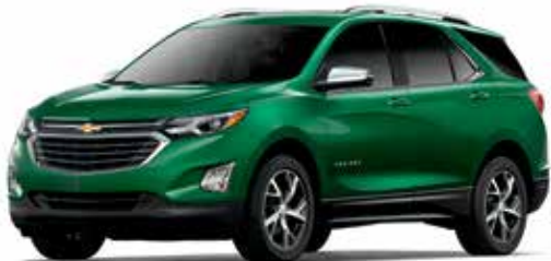
G8U – VERT LIERRE MÉTALLISÉ 1,3,4,6