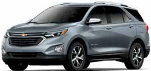
G9K – ACIER SATINÉ MÉTALLISÉ 1,4,5