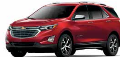
GPJ – TEINTE ROUGE CAJUN 1,2,5,6