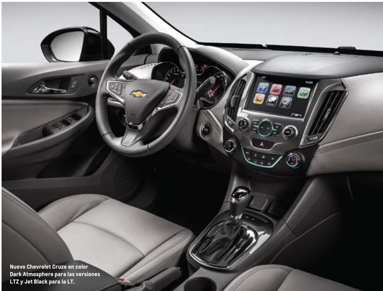
Nuevo Chevrolet Cruze en color Dark Atmosphere para las versiones LTZ y Jet Black para la LT.