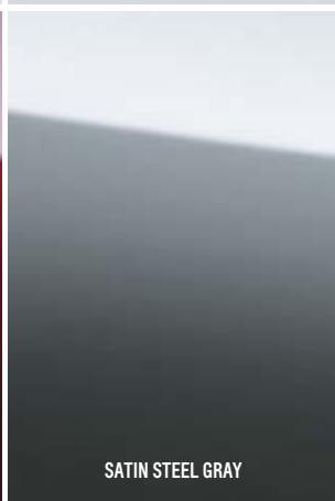
SATIN STEEL GRAY