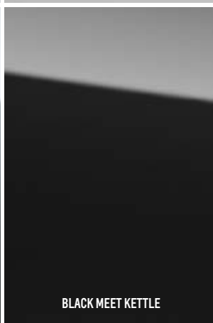
BLACK MEET KETTLE