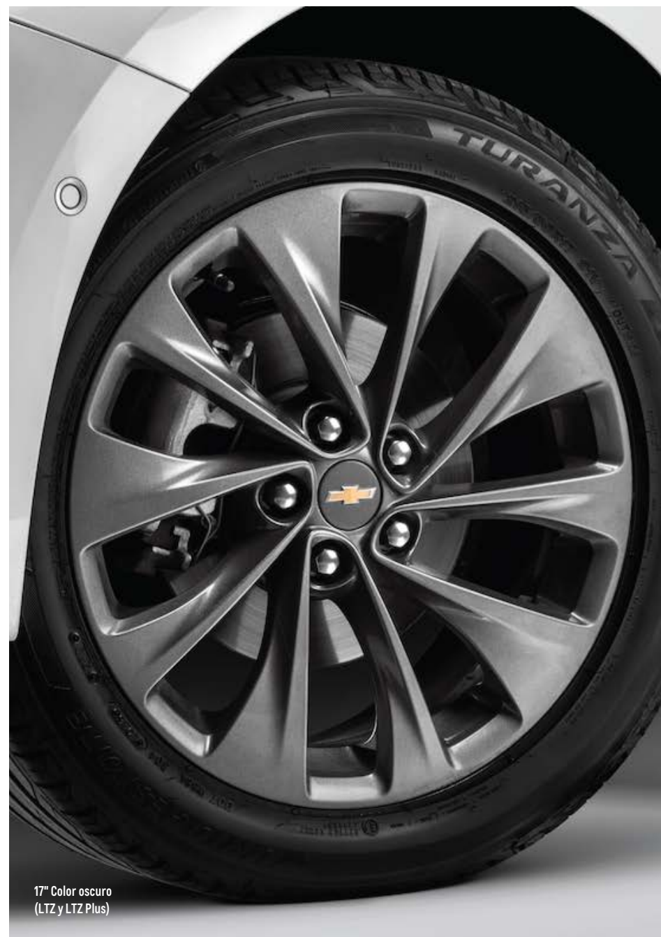
17" Color oscuro (LTZ y LTZ Plus)