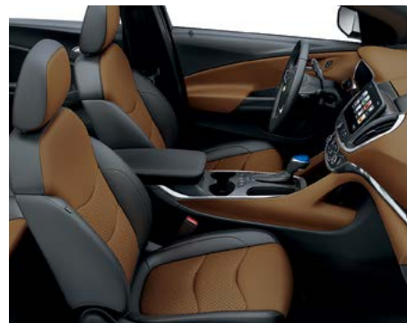
Cuir cognac avec éléments contrastants noir jais 5,6