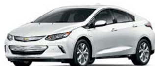
GAZ – BLANC SOMMET