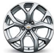
17 po en aluminium, fini usiné ultrabrillant, à 5 rayons divisés (de série pour modèle Premier)