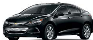
GB8 – NOIR MOSAÏQUE MÉTALLISÉ 1