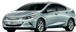
G9A – BRUME VERTE MÉTALLISÉE 1