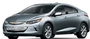
G9K – ACIER SATINÉ MÉTALLISÉ 1