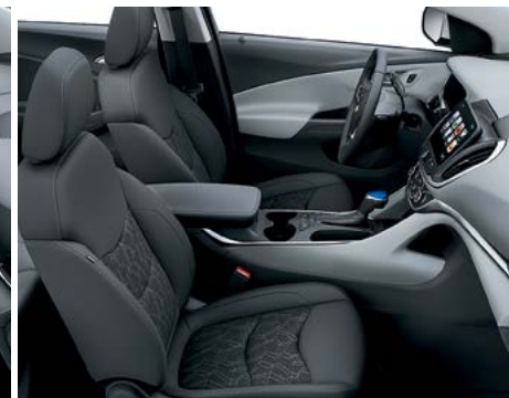
Tissu haut de gamme gris cendré foncé avec éléments contrastants gris cendré clair 2,3