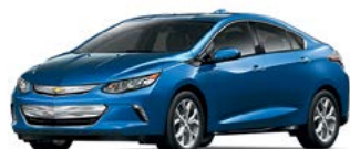
GD1 – BLEU CINÉTIQUE MÉTALLISÉ 1