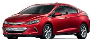
GPJ – TEINTE ROUGE CAJUN 1