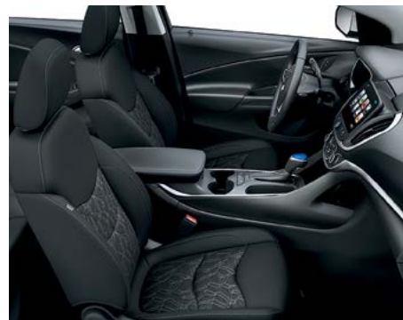
Tissu haut de gamme noir jais avec éléments contrastants noir jais 2