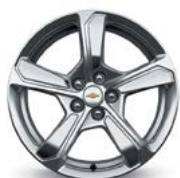
17 po en aluminium peint à 5 rayons (de série pour LT)