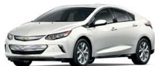
G1W – NACRE IRISÉ TRIPLE COUCHE 1