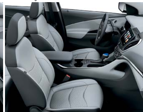
Cuir gris cendré clair avec éléments contrastants gris cendré foncé 3,4