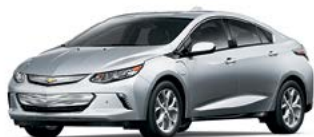
GAN – ARGENT GLACÉ MÉTALLISÉ