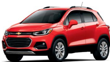
G7C – ROUGE ARDENT 1