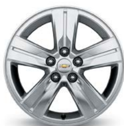
16 po en aluminium (de série pour LS à TI et LT)