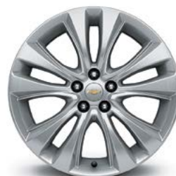
18 po en aluminium (de série pour Premier)

1 Non livrable pour LS. 2 Livrable moyennant supplément. 3 Non livrable avec intérieur noir jais/cognac.