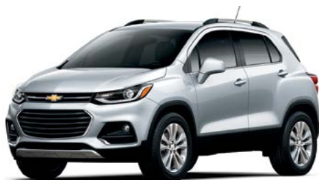
GAN – ARGENT GLACÉ MÉTALLISÉ 3