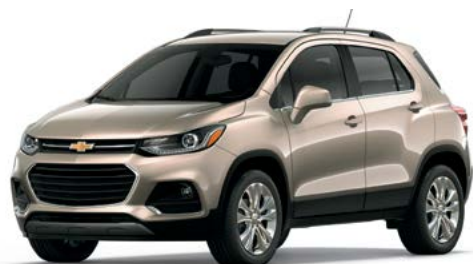
G8K – RÉCIF SABLONNEUX MÉTALLISÉ