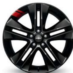
17 po en aluminium peint en noir avec traits hachurés rouges (livrable pour LT avec édition Série Distinction)