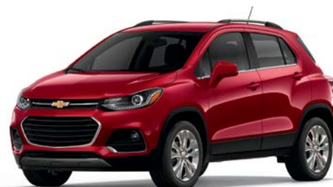
GPJ – TEINTE ROUGE CAJUN 1,2