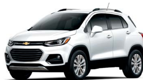
GAZ – BLANC SOMMET