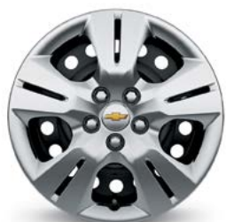
16 po en acier avec enjoliveur de roue (de série pour LS à TA)