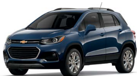
G35 – BLEU ORAGE MÉTALLISÉ