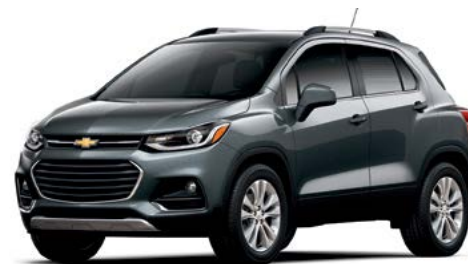
G7Q – GRIS NIGHTFALL MÉTALLISÉ 1,2