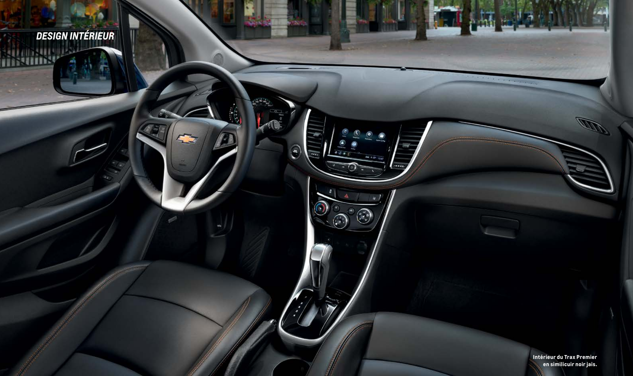
Intérieur du Trax Premier en similicuir noir jais.

CONFORT MODERNE. L'habitacle au style bien pensé est aussi confortable qu'élégant. Les sièges avec leurs surpiquûres contrastantes ajoutent à l'aspect et à la perception haut de gamme. Chassez les frissons grâce aux sièges conducteur et passager avant chauffants de série pour Premier.