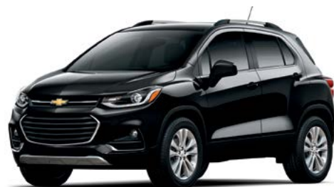
GB8 – NOIR MOSAÏQUE MÉTALLISÉ 2