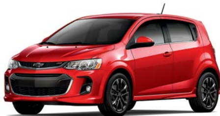
G7C – ROUGE ARDENT