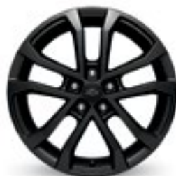
17 po en aluminium peint noir (de série pour modèle Premier)