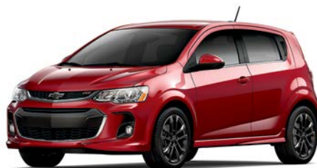
GPJ – TEINTE ROUGE CAJUN 1