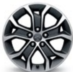
16 po en aluminium (de série pour LT à hayon, livrables pour berline LT 2 )