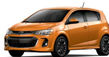
GGQ – ROUGE ORANGÉ MÉTALLISÉ 1,2