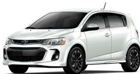
GAZ – BLANC SOMMET