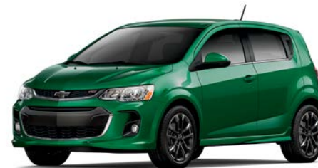
G8U – VERT LIERRE MÉTALLISÉ 1