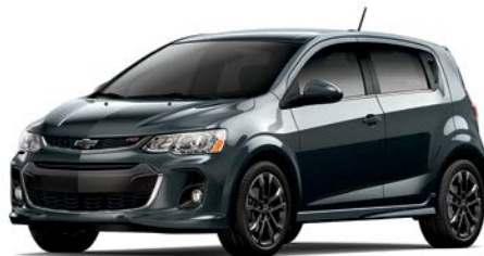
G7Q – GRIS NIGHTFALL MÉTALLISÉ 1