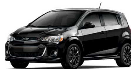
GB8 – NOIR MOSAÏQUE MÉTALLISÉ 1