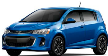
GD1 – BLEU CINÉTIQUE MÉTALLISÉ 1