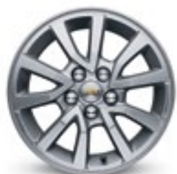
15 po en aluminium (de série pour berline LT)