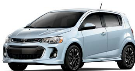
GGB – BLEU ARCTIQUE MÉTALLISÉ 1