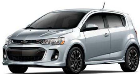
GAN – ARGENT GLACÉ MÉTALLISÉ