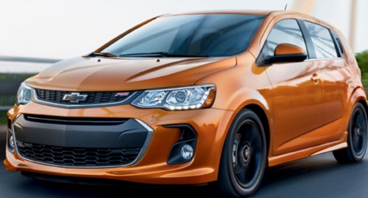
Sonic Premier RS à hayon en rouge orangé métallisé (couleur moyennant supplément).