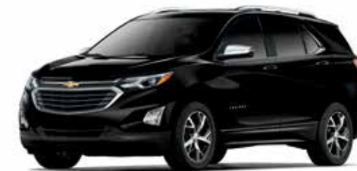
GB8 – NOIR MOSAÏQUE MÉTALLISÉ 1,2