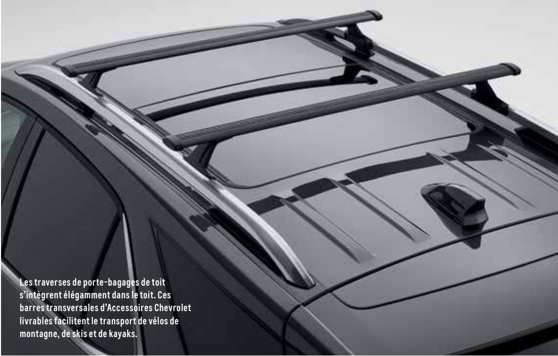
Les traverses de porte-bagages de toit s'intègrent élégamment dans le toit. Ces barres transversales d'Accessoires Chevrolet livrables facilitent le transport de vélos de montagne, de skis et de kayaks.

EQUINOX LS L'Equinox LS comprend les caractéristiques de série suivantes :