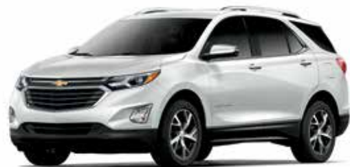
G1W – NACRE IRISÉ TRIPLE COUCHE 1,2,3