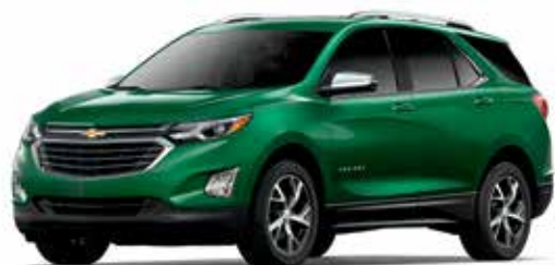
G8U – VERT LIERRE MÉTALLISÉ 1,3,4,6