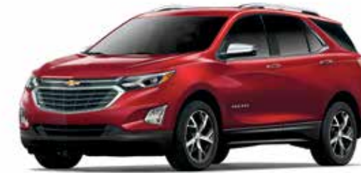
GPJ – TEINTE ROUGE CAJUN 1,2,5,6