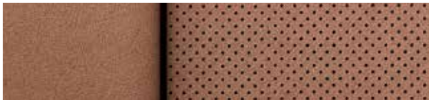
Cuir perforé cognac avec garnitures contrastantes noir jais 7,8