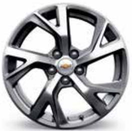
18 po en aluminium fini usiné avec évidements peints (de série pour Premier)