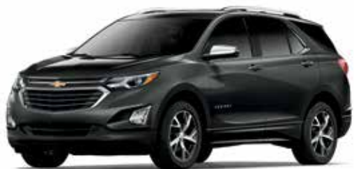
G7Q – GRIS NIGHTFALL MÉTALLISÉ 1