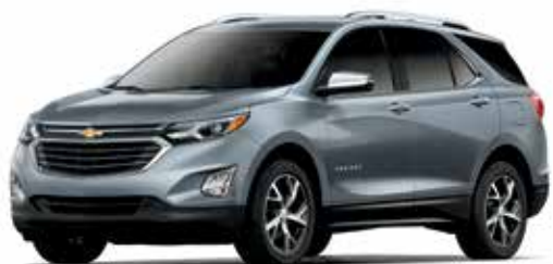
G9K – ACIER SATINÉ MÉTALLISÉ 1,4,5