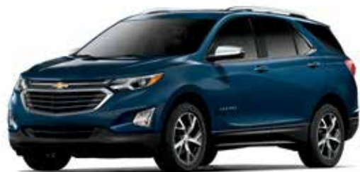
G35 – BLEU ORAGE MÉTALLISÉ 1,4,5