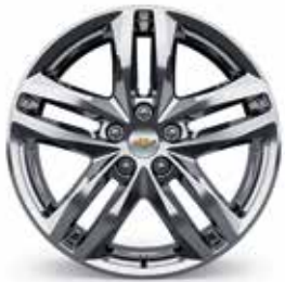
19 po en aluminium usiné ultra brillant avec évidements peints argent scintillant (livrables pour Premier)¹