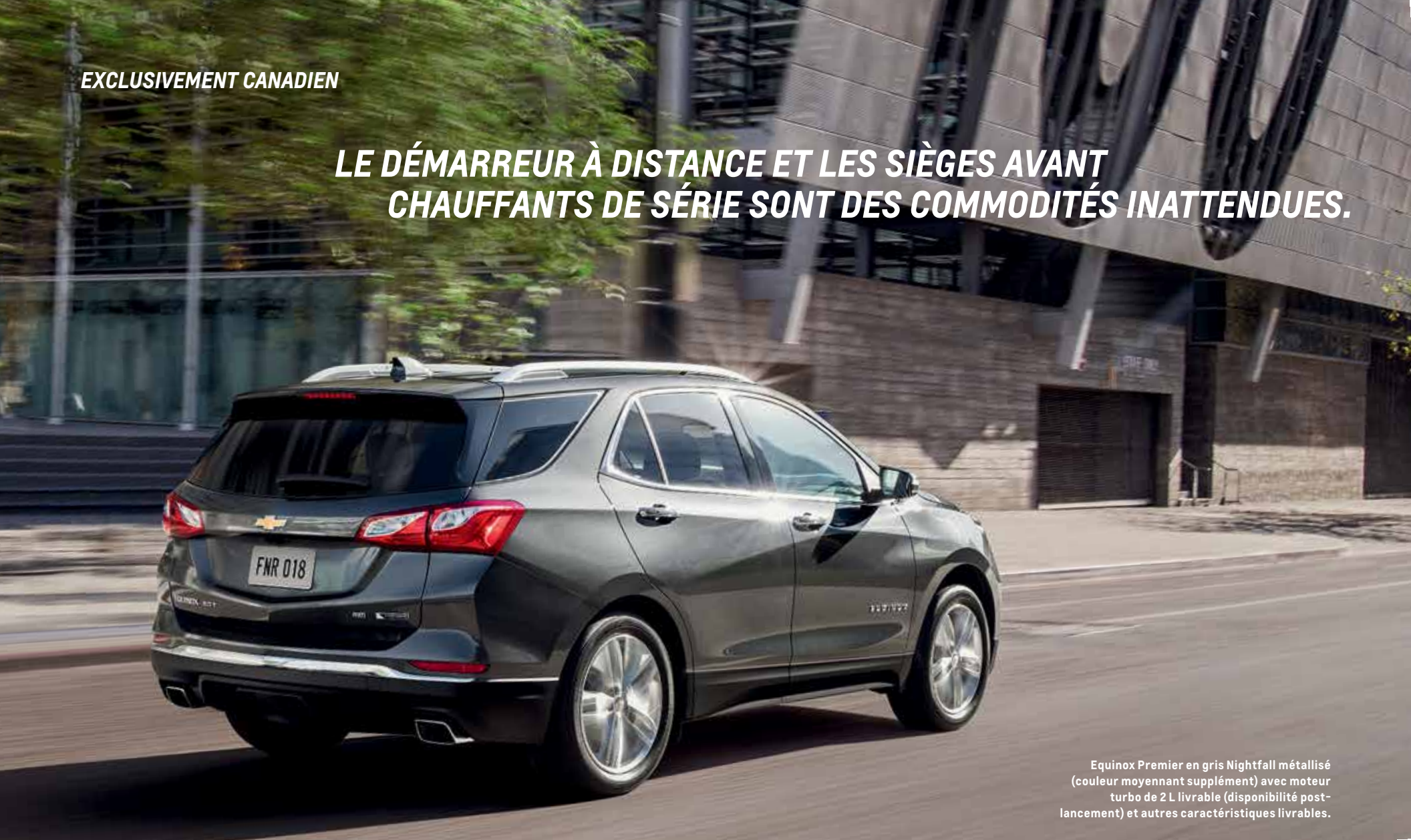
Equinox Premier en gris Nightfall métallisé (couleur moyennant supplément) avec moteur turbo de 2 L livrable (disponibilité post-lancement) et autres caractéristiques livrables.

CONÇU POUR LE MONDE QUE VOUS HABITEZ. L'Equinox 2018 est conçu spécifiquement pour les températures extrêmes du nord que nous subissons au Canada. Les sièges baquets avant chauffants, rétroviseurs extérieurs chauffants et démarreur à distance sont de série pour chaque Equinox.