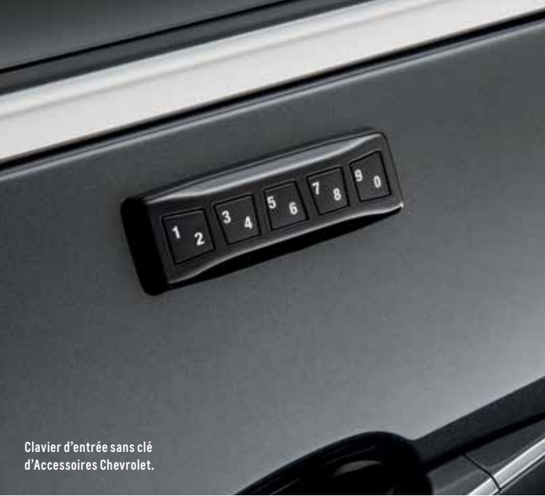
Clavier d'entrée sans clé d'Accessoires Chevrolet.

Édition Equinox Redline, représenté en argent glacé métallisé, comprenant roues de 19 po en aluminium noir avec éléments rouges et emblèmes, et boîtiers de rétroviseurs, garniture des portes, calandre et emblèmes Chevrolet, tous noirs. Livrable pour LT (disponibilité post-lancement).