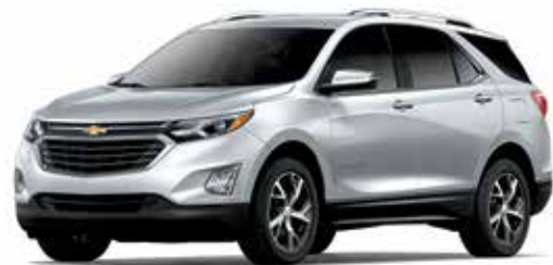
GAN – ARGENT GLACÉ MÉTALLISÉ