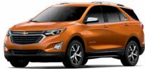
GGQ – ROUGE ORANGÉ MÉTALLISÉ 1,3