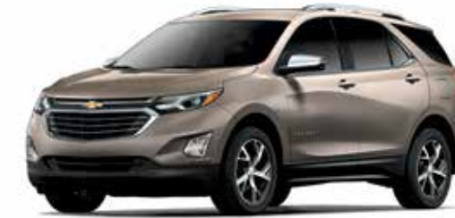
GMU – GRIS PEPPERDUST MÉTALLISÉ 1,4,5,6