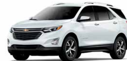
GAZ – BLANC SOMMET