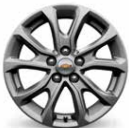
17 po en aluminium peint (de série pour LS et LT)