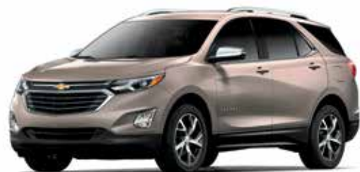
G8K – RÉCIF SABLONNEUX MÉTALLISÉ 1,4