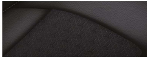
黑色皮革织物拼接内饰