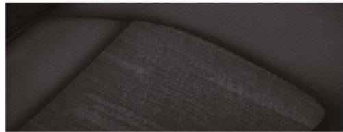
黑色立体压花织物内饰