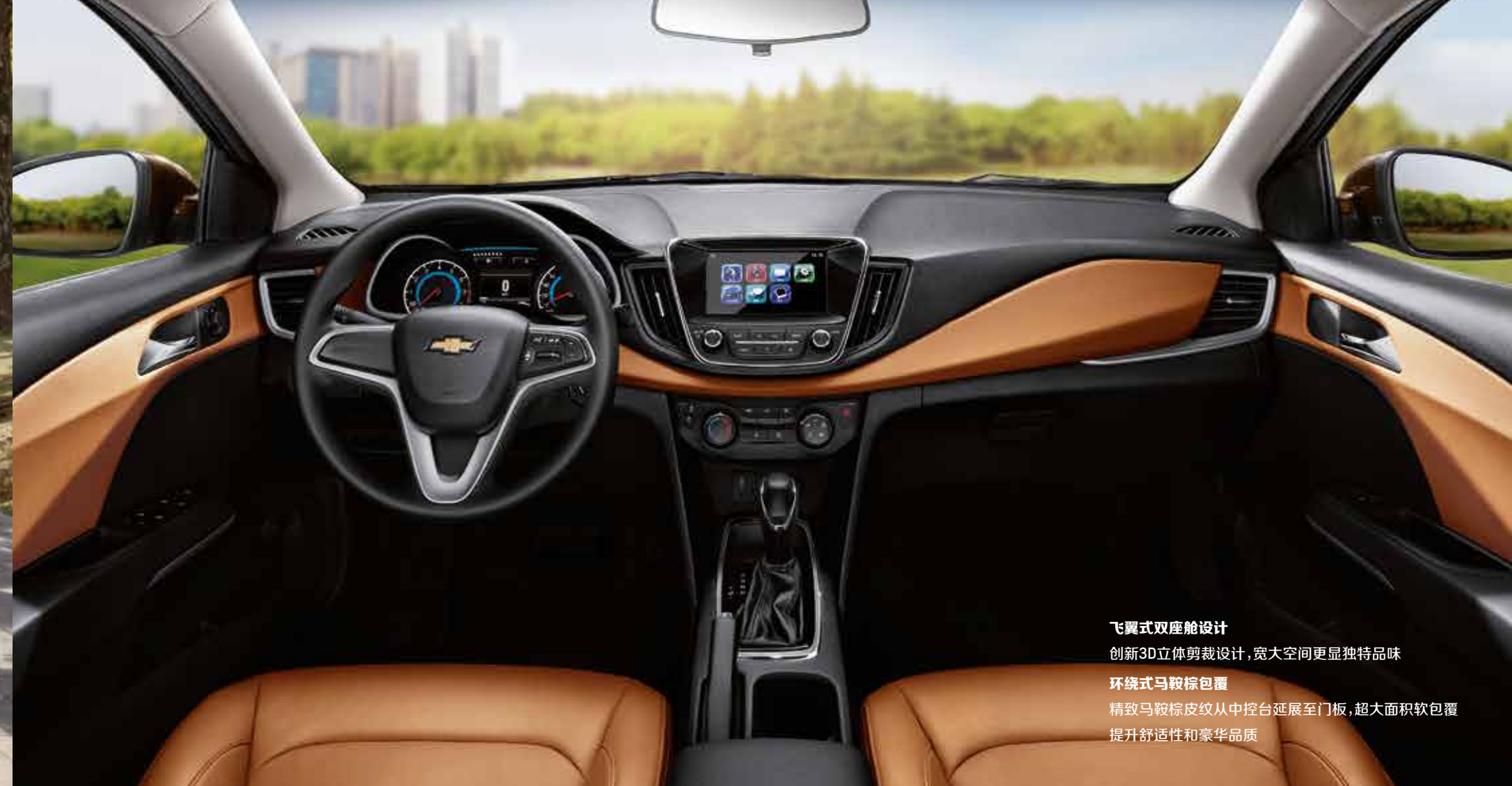
飞翼式双座舱设计 创新3D立体剪裁设计,宽大空间更显独特品味 环绕式马鞍棕包覆 精致马鞍棕皮纹从中控台延展至门板,超大面积软包覆 提升舒适性和豪华品质