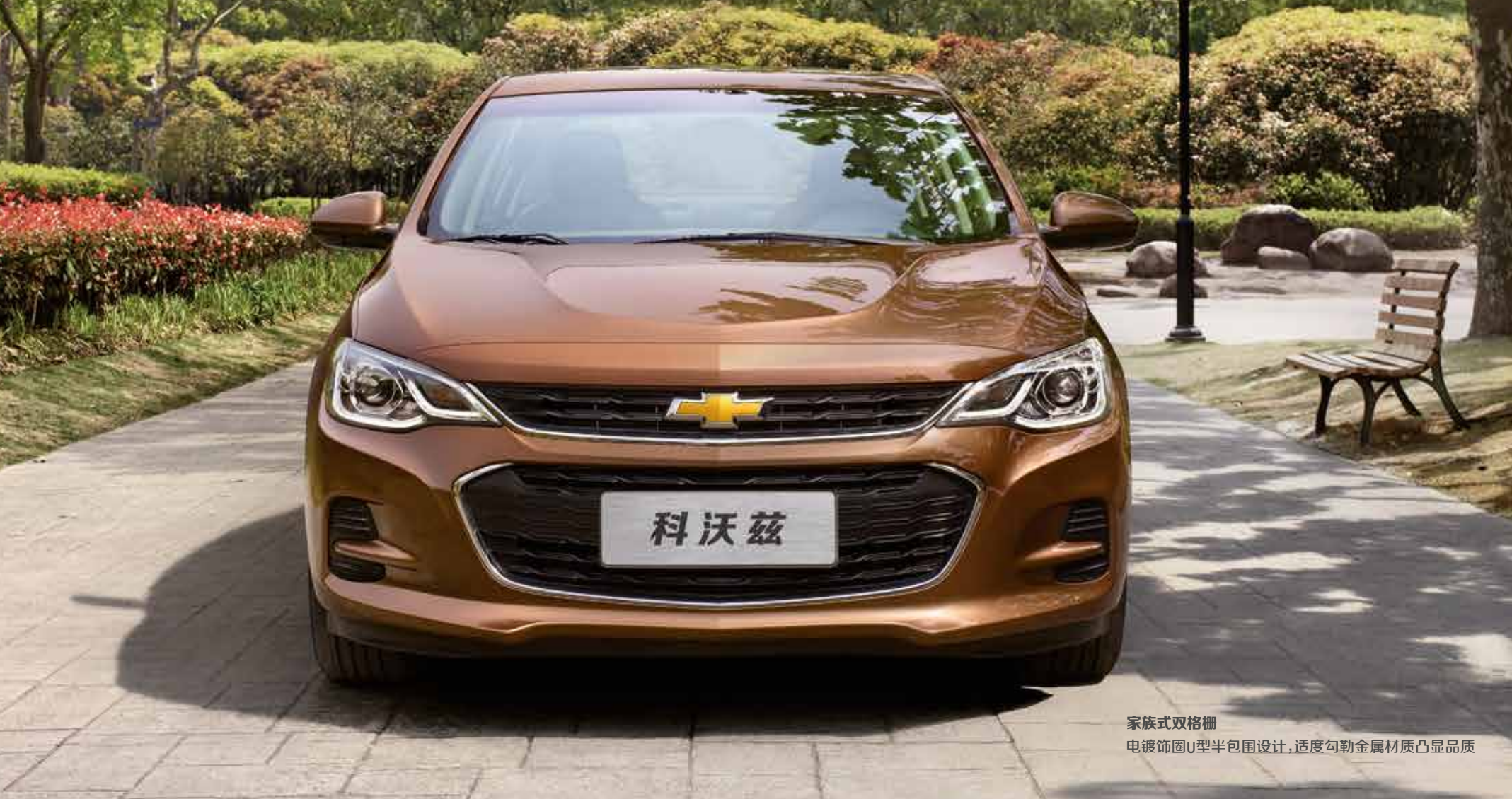
家族式双格栅 电镀饰圈U型半包围设计,适度勾勒金属材质凸显品质