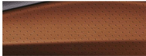
马鞍棕真皮打孔内饰