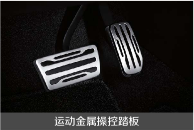
运动金属操控踏板