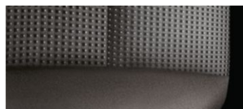
LS – Ткань черного цвета