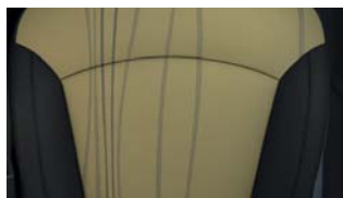
LTZ* : Sellerie mixte tissu Papyrus / cuir de synthèse