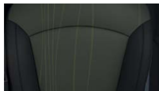
LTZ* : Sellerie mixte tissu anthracite à motif vert / cuir de synthèse