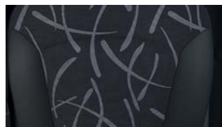
LS et LS+ : Sellerie tissu anthracite