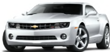
Blanco Laguna Seca