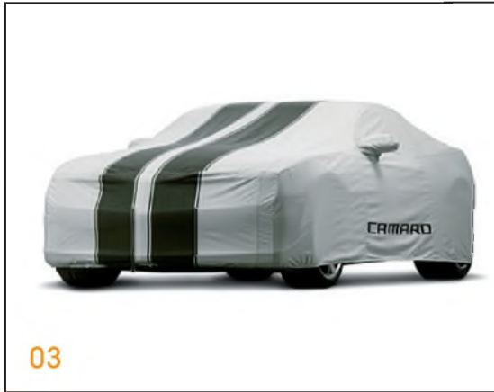
03 Cubierta para intemperie