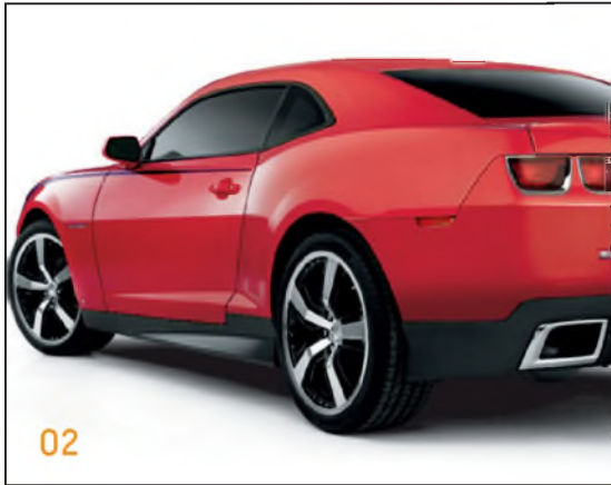
02 Kit deportivo