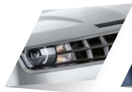
Silver Ice (metalizado)