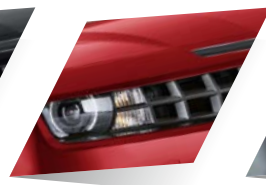
Crystal Red (premium)