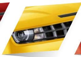
Rally Yellow (premium)