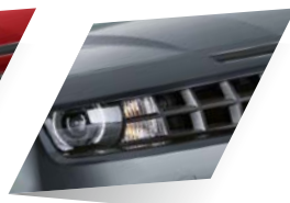
Ashen Grey (metalizado)