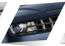
Imperial Blue (metalizado)