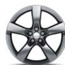
Llantas de aluminio 20" Acabado Pintado (delanteras y traseras)