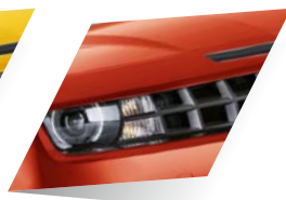
Inferno Orange (premium)