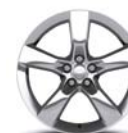
Llantas de aluminio 20" Acabado Pulido (delanteras y traseras)