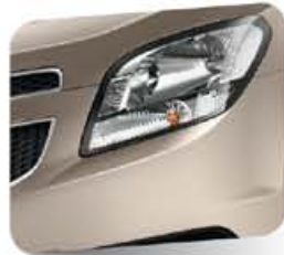
Daydream Beige (metálico)