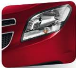
Velvet Red (metálico)