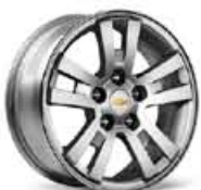
Llanta de Aleación 16" LT+