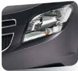
Smokey Grey (metálico)