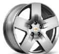
Llanta de Aleación 18" LTZ **