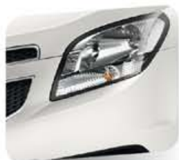
Olympic White (sólido)