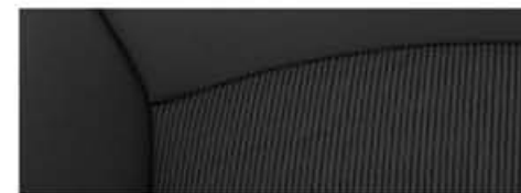
LT / LT+ / LTZ - Tela Jet Black / Jet Black