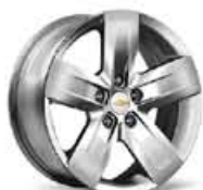
Llanta de Aleación 17" LTZ