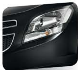
Carbon Flash Black (metálico)