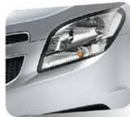
Ice Silver (metálico)