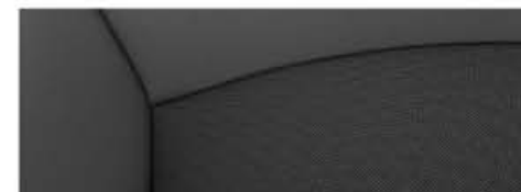
LTZ - Cuero/símil cuero Jet Black/Jet Black (opcional)