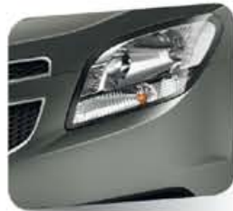
Pewter Grey (metálico)