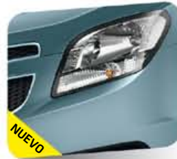
Arctic Blue* (metálico)