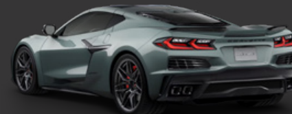
7. シーウルフグレートライコート