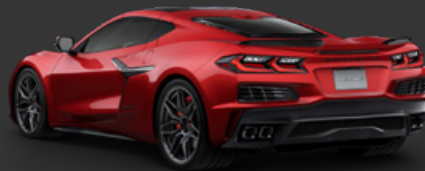
2. レッドミスト メタリック ティントコート