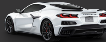
4. アークティックホワイト