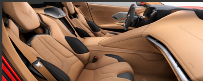
ナチュラルディップド / シートベルト：ナチュラル 対応ボディカラー：全カラーに受注発注