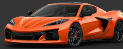
3. セプリングオレンジ ティントコート