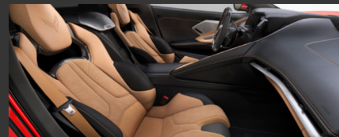
ナチュラル / シートベルト：ナチュラル 対応ボディカラー：全カラーに受注発注