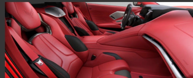
アドレナリンレッド ディップド / シートベルト：レッド 対応ボディカラー：1./4./7./8. に受注発注 2./3./5./6. は設定なし アドレナリンレッド ディップド選択時のみ、シートとステアリングホイールがナバレザーに変更となります。

※写真の車両は一部日本仕様と異なる場合があります。日本仕様車は右ハンドルとなります。