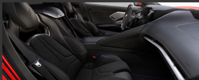
ジェットブラック / シートベルト：ブラック 対応ボディカラー：1./4./8. に標準装備 2./3./5./6./7. に受注発注