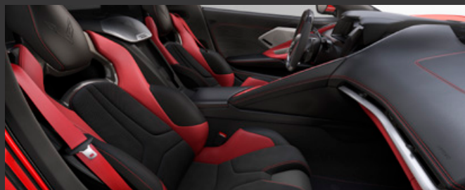
アドレナリンレッド / シートベルト：レッド 対応ボディカラー：1./4./7./8. に受注発注 2./3./5./6. は設定なし