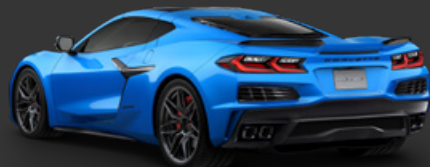
5. リップタイドブルー メタリック