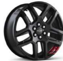
20인치 레드라인 시그니처 블랙 알로이 휠 (Redline 전용)