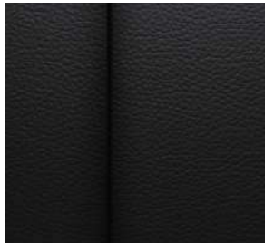
젯 블랙 천연가죽 시트 (LT Leather Premium 전용)