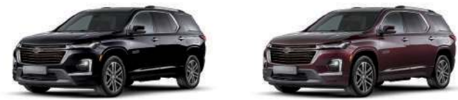
미드나이트 블랙 (GB8)