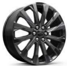
20인치 다크 안드로이드 페인티드 알로이 휠 (RS 전용)