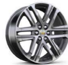
20인치 루나 그레이 머신드 알로이 휠 (High Country 전용)