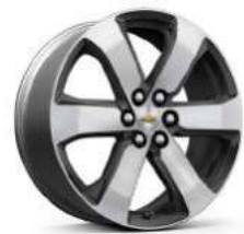
20인치 테크니컬 그레이 포켓 머신드 알로이 휠 (LT Leather Premium 전용)