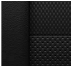
젯 블랙 & 레드 포인트 천연가죽 시트 (RS 전용)