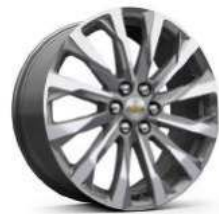
20인치 아전트 메탈릭 머신드 알로이 휠 (Premier 전용)