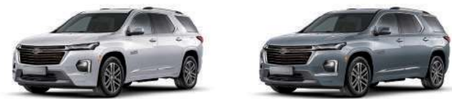
아발론 화이트 펄 (G1W)