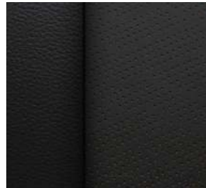
젯블랙 & 클로브 천공 천연가죽 시트 (High Country 전용)