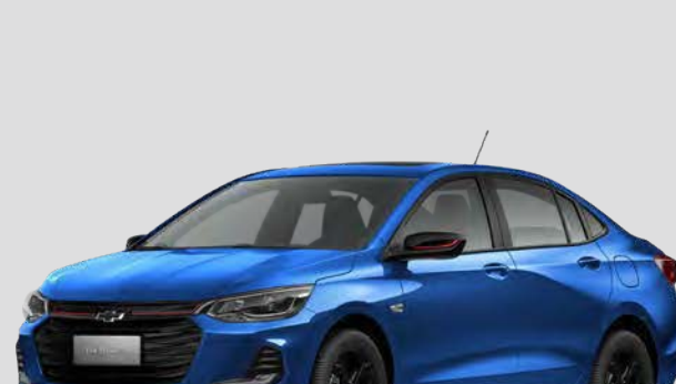
Azul Cobalto Metálico