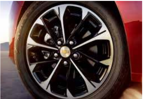
16吋心悦铝合金运动轮毂