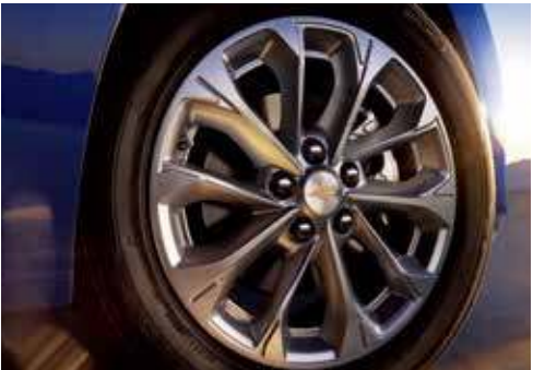
16吋心驰铝合金轮毂