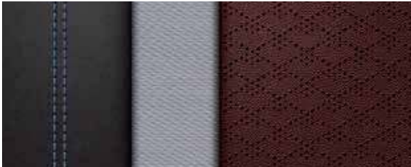
棕灰双拼菱纹打孔皮质内饰+雾蓝缝线