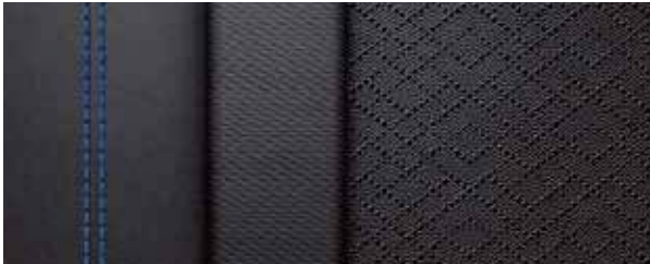
曜黑菱纹打孔皮质内饰+宝蓝缝线