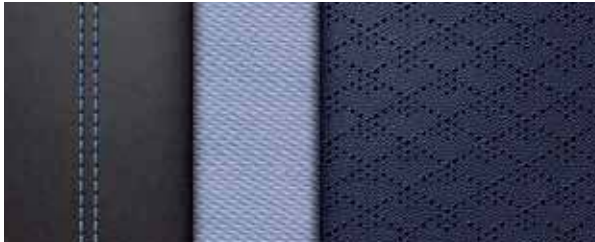
蓝灰双拼菱纹打孔皮质内饰+雾蓝缝线