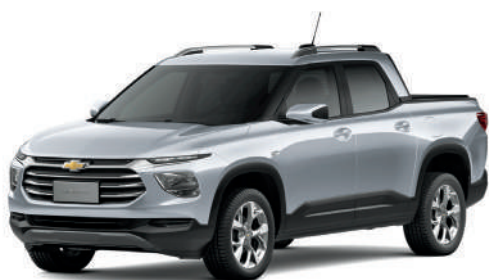
SHARK SKIN SILVER