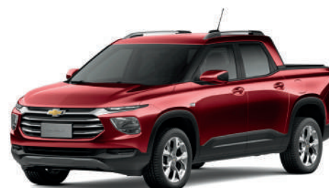
CHILI RED PEARLESCENT