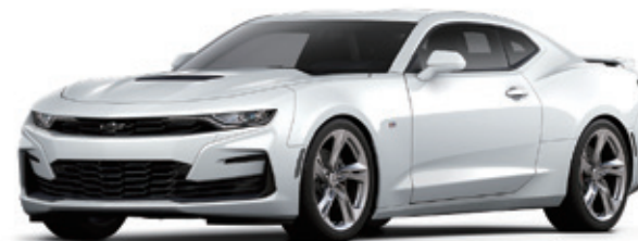
サミットホワイト