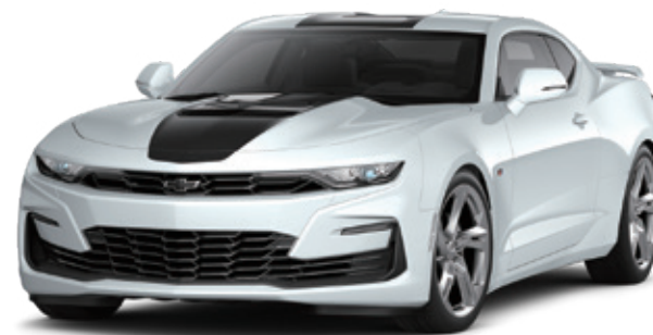
サミットホワイト