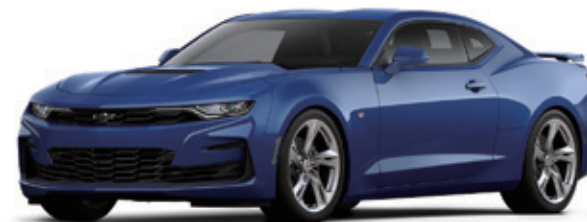
リバーサイドブルーメタリック