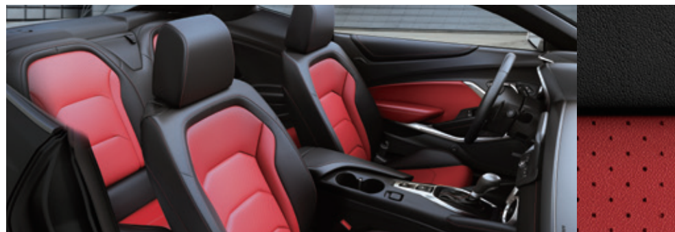
ジェットブラック/アドレナリンレッド

※各モデルの詳細は、別冊の主要諸元・装備をご覧ください。またはシボレー正規ディーラーにお問い合わせください。