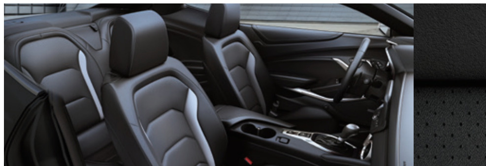
ジェットブラック/ジェットブラック