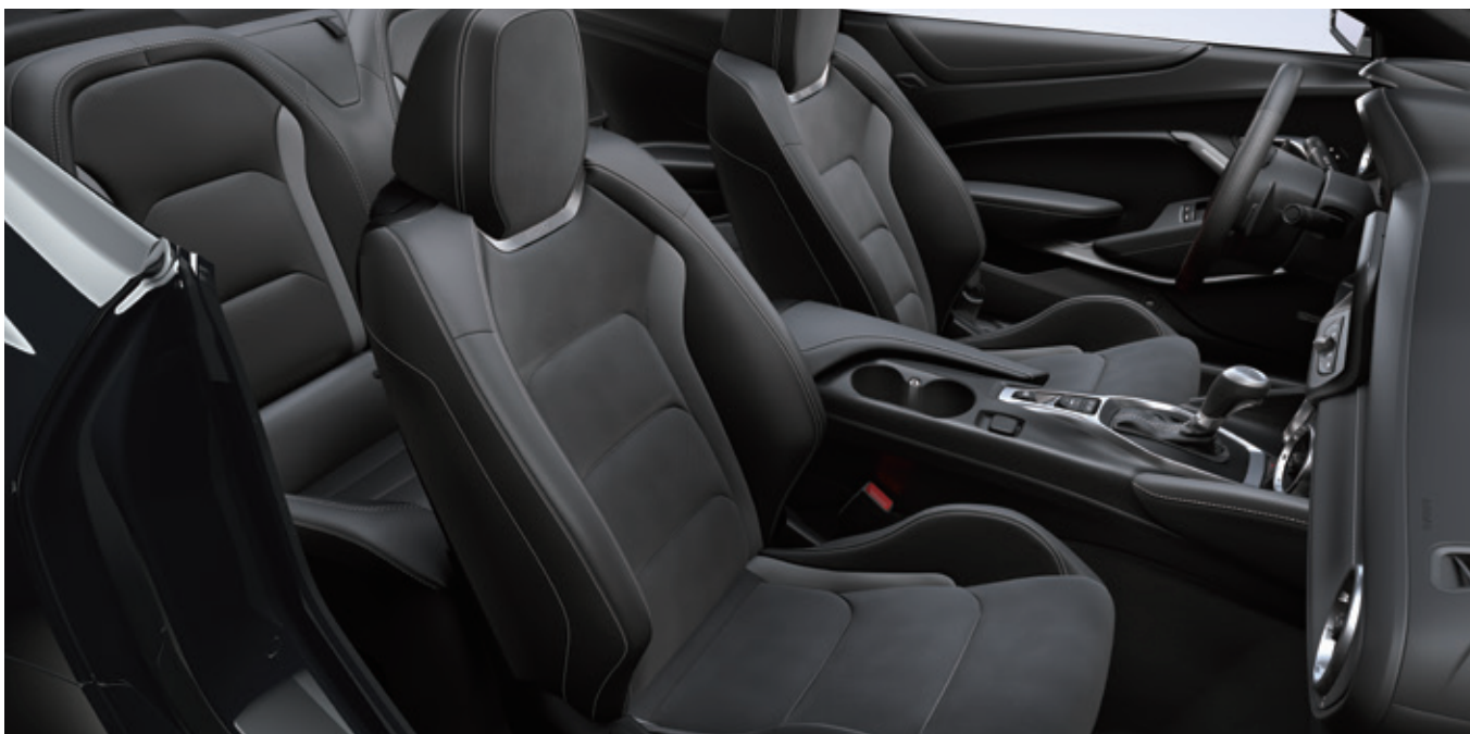
RECARO パフォーマンスフロントバケットシート ※シート表皮にはレザー以外にパーフォーレテッドスエード、合皮を使用しています。