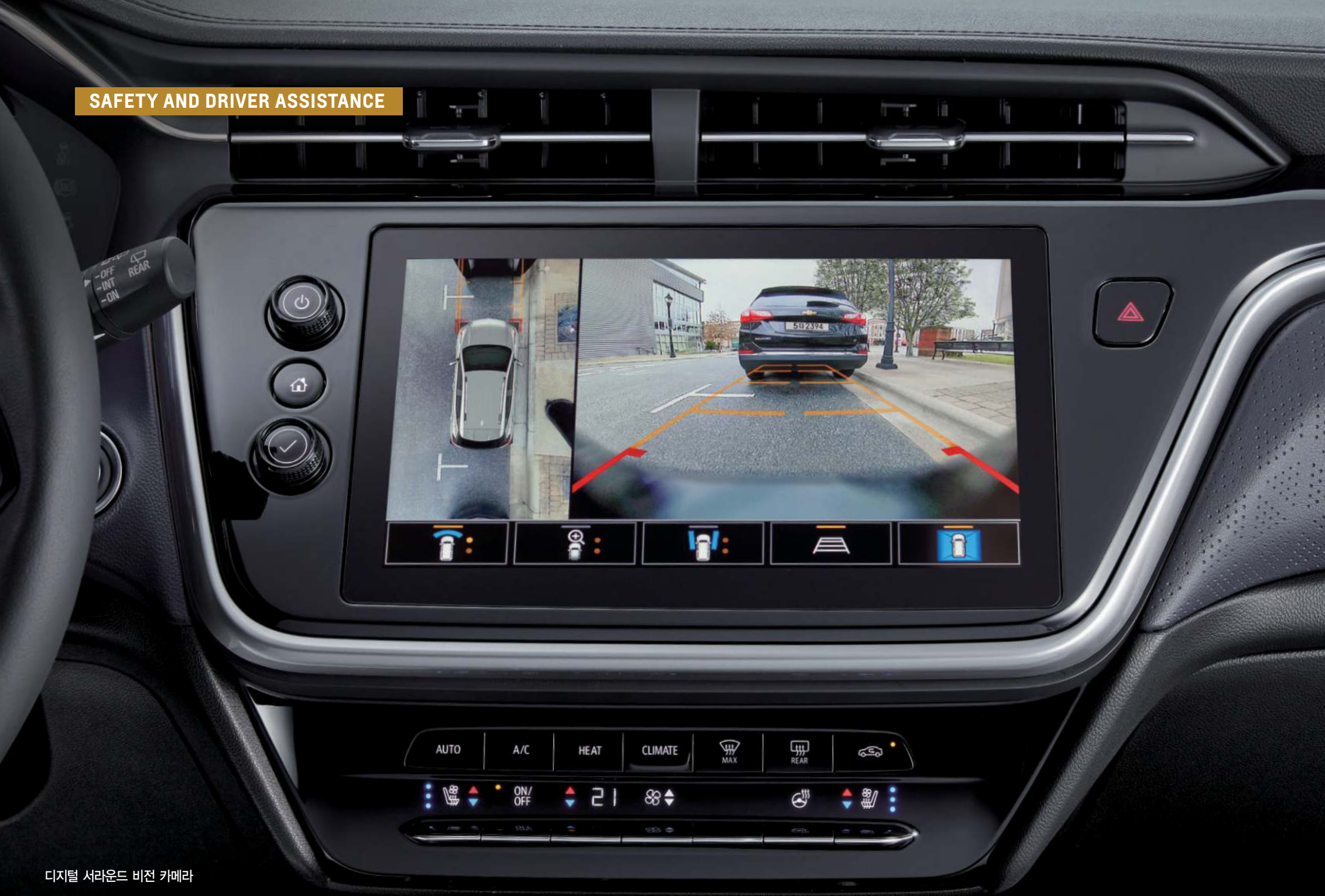
디지털 서라운드 비전 카메라