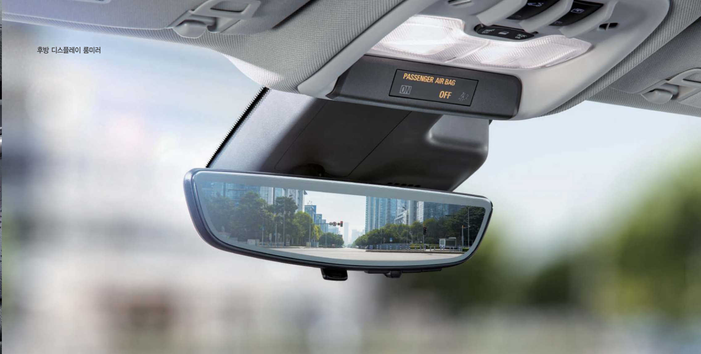
후방 디스플레이 룸미러