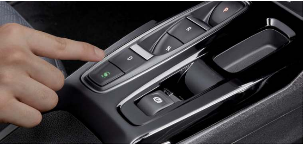
버튼식 기어시프트 & One Pedal Driving Regen on Demand®