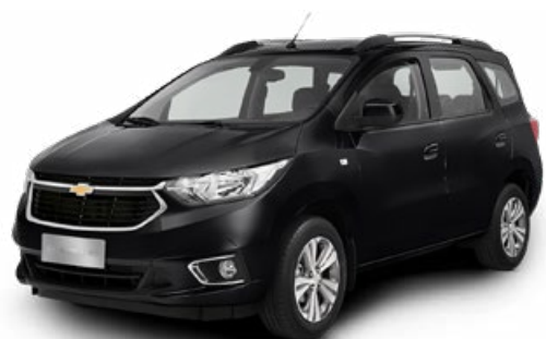
BLACK MEET KETTLE