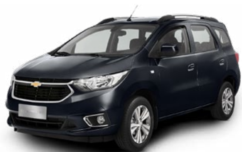
OLD BLUE EYES