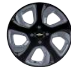
16인치 그레이 인서트 블랙 알루미늄 휠 (NWQ)