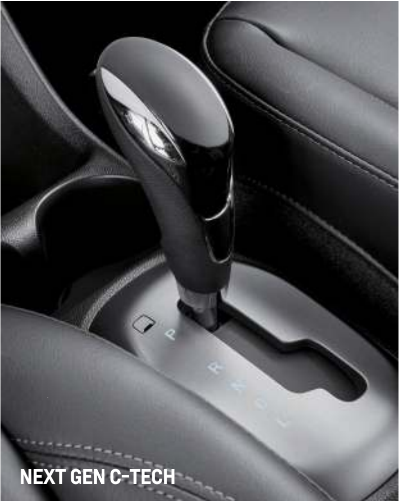
NEXT GEN C-TECH