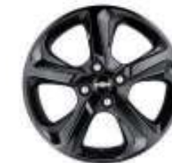
16인치 블랙 알루미늄 휠 (P1B)