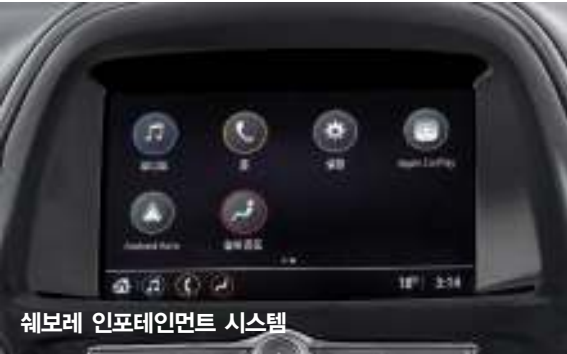
쉐보레 인포테인먼트 시스템