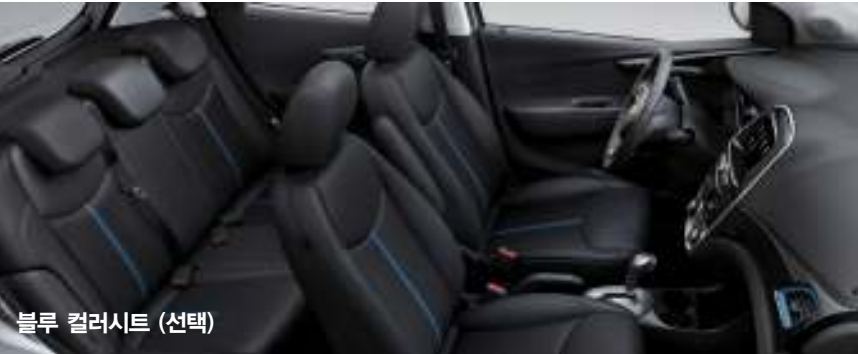
블루 컬러시트 (선택)