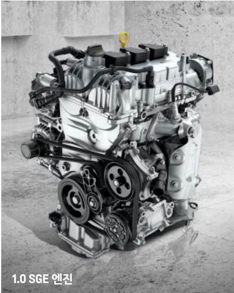
1.0 SGE 엔진