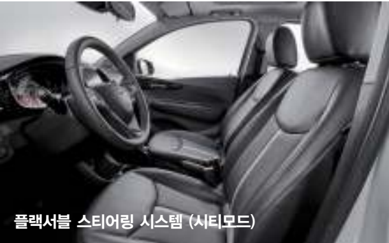
플렉서블 스티어링 시스템 (시티모드)

시트의 중앙라인과 송풍구 테두리에 포인트를 주어 고급스러운 인테리어 디자인을 완성 (기본 : 다크실버, 선택 : 블루)