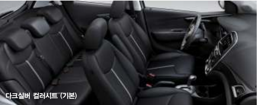
다크실버 컬러시트 (기본)