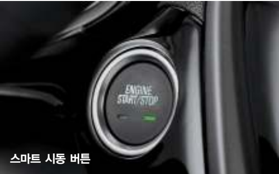
스마트 시동 버튼