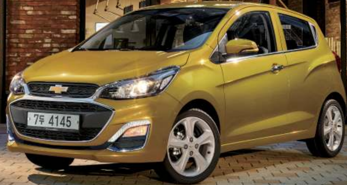
15" 알로이 휠 LED 주간 주행등 & 크롬 베젤

C-TECH에 S/S 테크놀로지를 LT/Premier/레드픽/마이핏 트림에서 적용 가능하며, 신호대기나 정차 등의 상황에서 엔진을 자동으로 멈추어 줌으로써 더욱 향상된 연비를 구현합니다. On/Off 버튼이 운전석 좌측에 위치하여 운전환경에 따라 기능을 켜고 끄기 편리합니다.