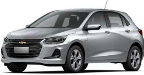
SWITCHBLADE SILVER MET