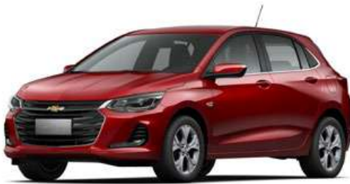
RED-E OR NOT RED MET-5V