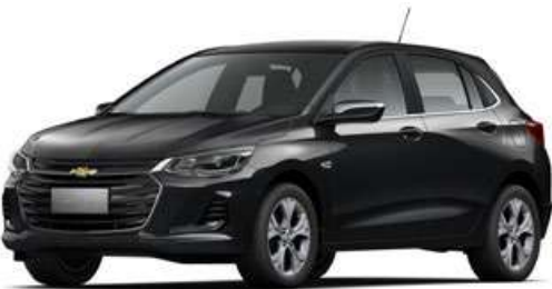
BLACK MEET KETTLE MET