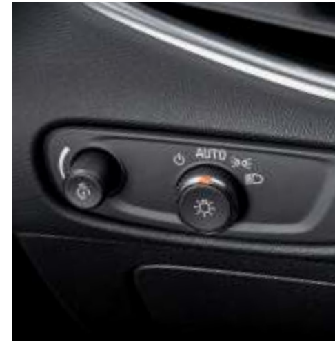
오토라이트 컨트롤 전자식 주차 브레이크(EPB)