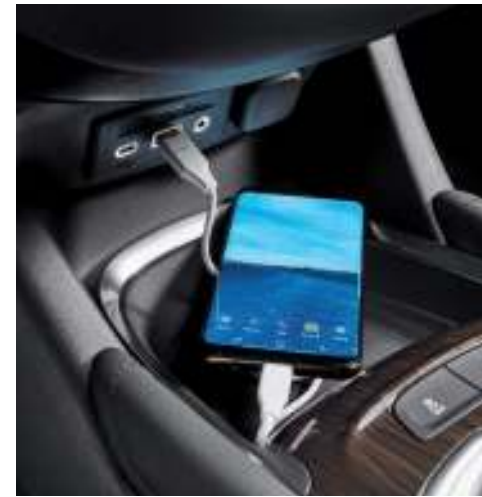
열선내장 스티어링 휠 일루미네이팅 듀얼 USB 포트 (A타입 1개/C타입 1개) 및 AUX 단자