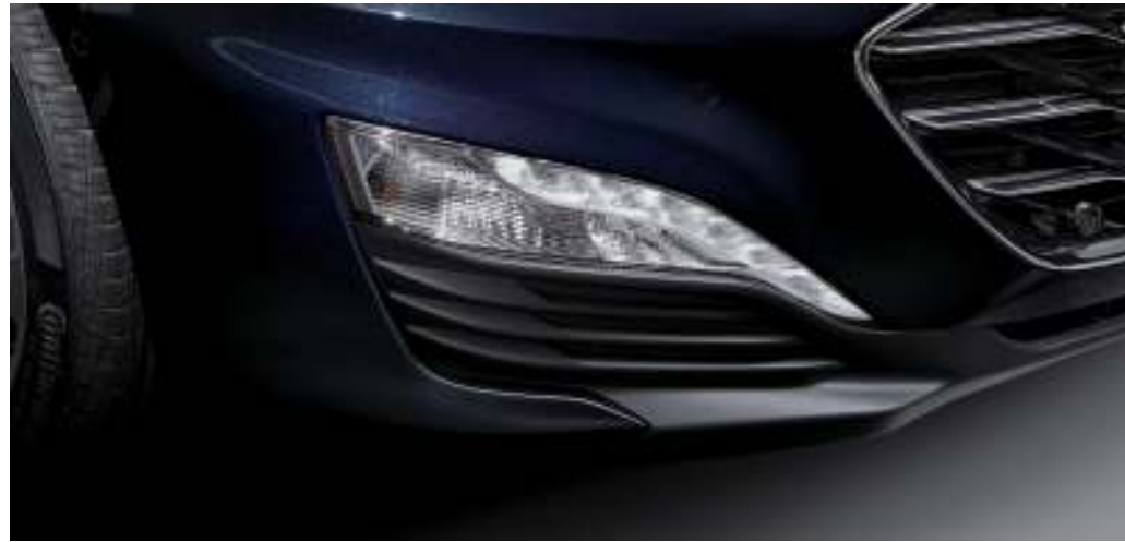
크리스탈 LED 주간주행등 운전석 & 동반석 3단 통풍시트 좌우 독립식 전자동 에어컨