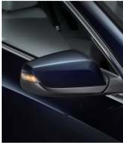
LED 방향지시등 일체형 아웃사이드 미러 와이드 크롬 듀얼 브라이트 머플러 팁 대용량 트렁크