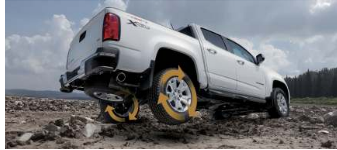
디퍼렌셜 잠금 장치 올 터레인 타이어 & 풀 사이즈 스페어 타이어 힐 디센트 컨트롤(HDC) 트랜스퍼 케이스 쉴드

언더바디에 장착된 트랜스퍼케이스 쉴드는 거친 노면의 바위, 돌 등으로부터 4WD 변속장치를 보호하며, Goodyear 올 터레인 타이어와 풀사이즈 스페어 타이어는 오프로드에서도 자신 있는 주행을 가능하게 합니다.