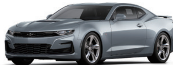
サテンスティールグレイメタリック