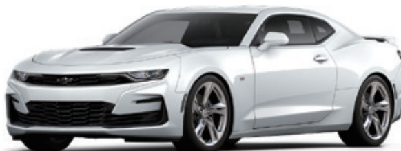
サミットホワイト