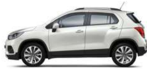
스노우 화이트 펄 (GP5)