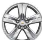
16인치 알로이 휠 (LS 디럭스, LT 적용)