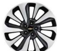
18인치 투톤 알로이 휠 (Premier 적용)