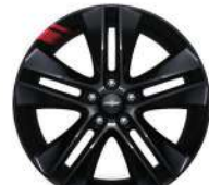
18인치 블랙 레드라인 알로이 휠 (레드라인 전용)