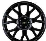
NEW 18인치 블랙 알로이 휠 (옵션)

※ 본 카탈로그에 수록된 제품사양 및 제원은 발행일 기준이며 차의 성능 개선을 위하여 예고없이 변경될 수 있습니다. ※ 본 카탈로그는 최상위 모델을 중심으로 제작되었으며, 하위 모델의 경우 적용되지 않은 사양이 있을 수 있습니다. ※ 본 카탈로그에 수록된 제품사양은 각 모델별로 다르게 적용되오니 자세한 내용은 가격표를 참조하여 주시기 바랍니다. ※ 본 카탈로그의 차량색상은 인쇄된 것이므로 실제 차량색상과 다소 차이가 날 수 있습니다. ※ 본 카탈로그의 이미지 및 사양은 실제와 다를 수 있습니다.