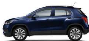
미드나잇 블루 (G5J)