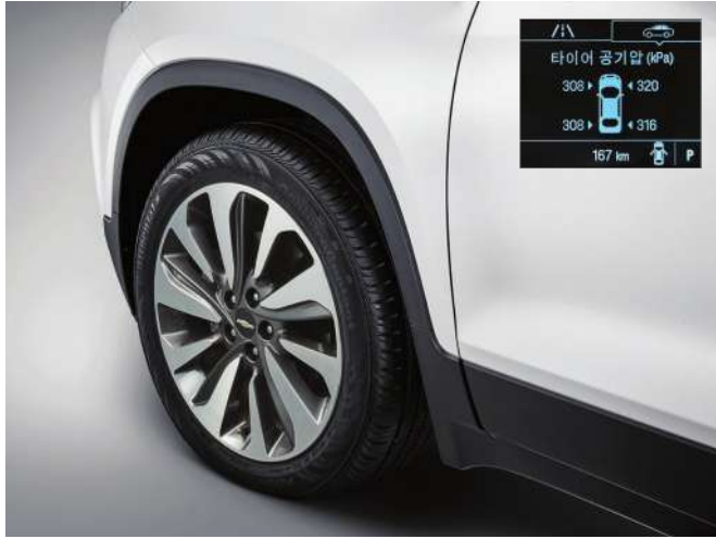
타이어 공기압 모니터링 시스템 (TPMS) 크루즈 컨트롤