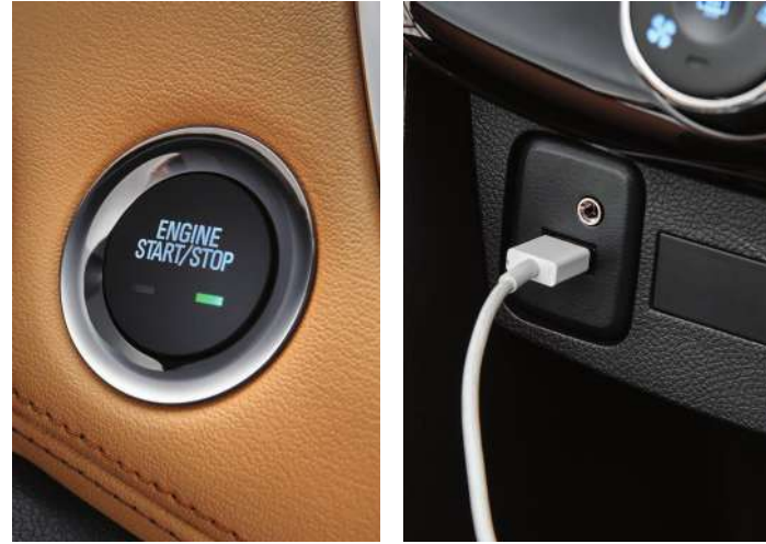
스마트 시동 버튼 USB 단자 220V 인버터