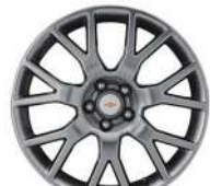
18인치 매쉬타입 알로이 휠 (LT 코어 전용)