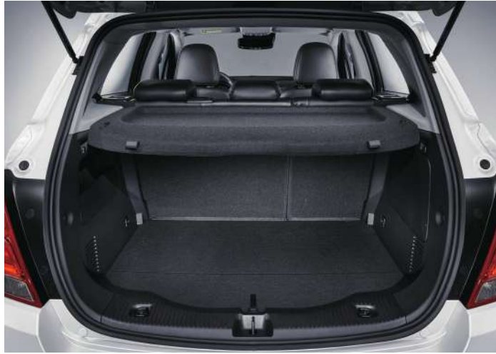
대용량 트렁크 공간 원터치 세이프티 전동 선루프