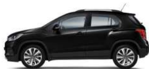
모던 블랙 (GB0)