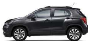
다크 나이트 그레이 (GUN)