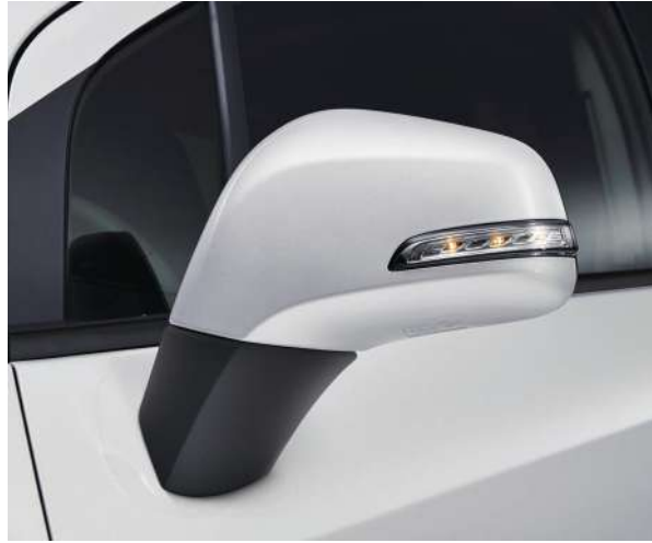
LED 방향 지시등 일체형 아웃사이드 미러 크롬베젤 안개등