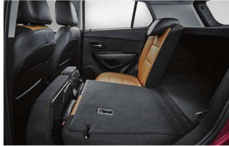
6:4 플립 & 폴딩시트 오토 라이트 컨트롤 & 헤드램프 각도 조절 장치