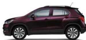
카본 버건디 (GNL)