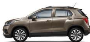
첼시 브라운 (GNM)