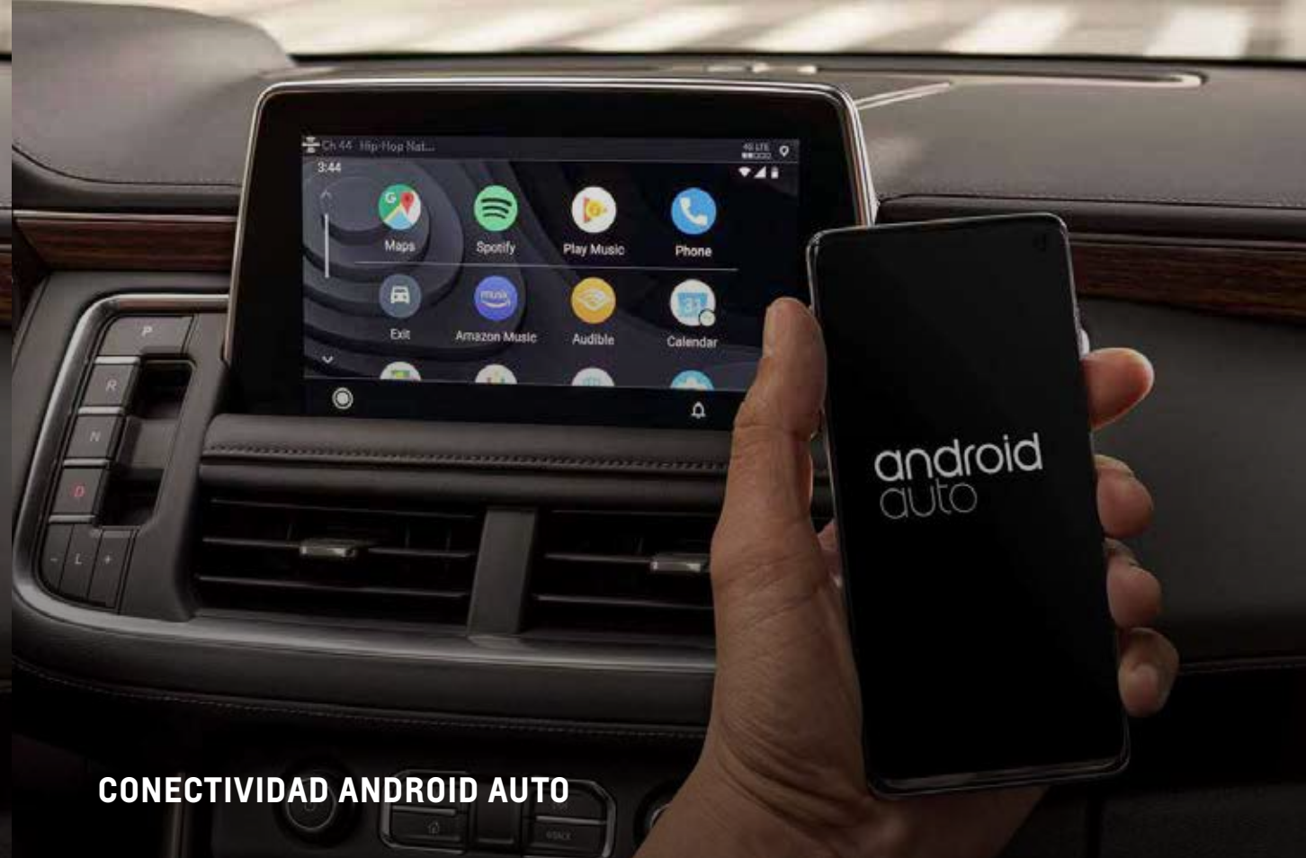
CONECTIVIDAD ANDROID AUTO