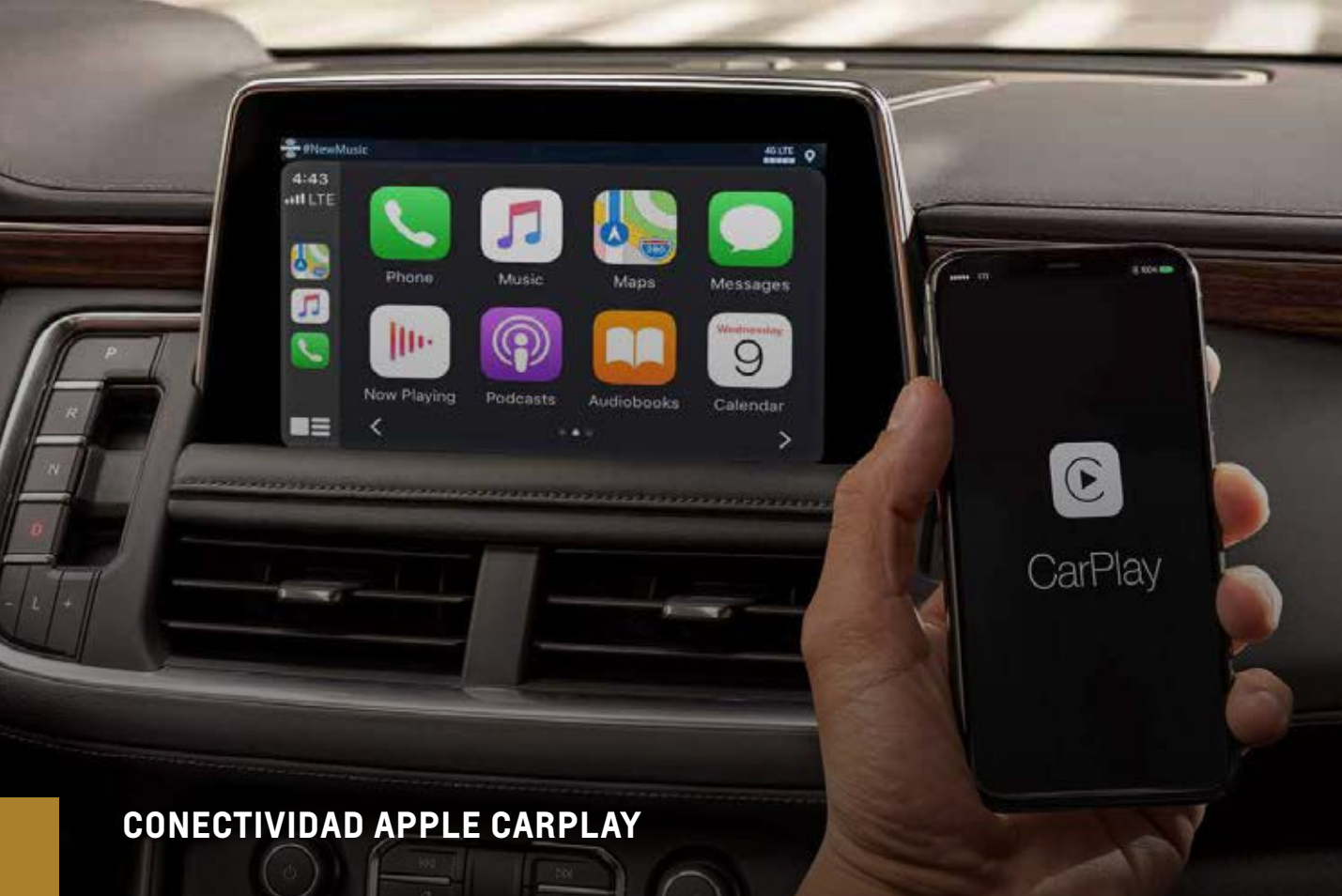
CONECTIVIDAD APPLE CARPLAY